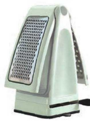
②スティックス グレーター