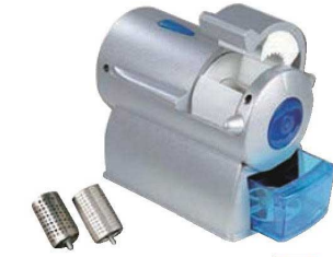
①インペリア パルメザンチーズ製粉機