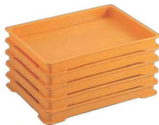
⑨PP サンバット #5