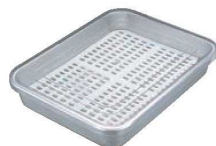
⑬アルマイト 冷凍ケース (目皿付)