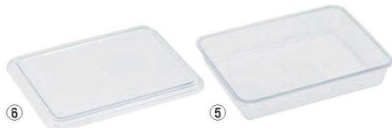
⑤ポリカーボネイト 角バット