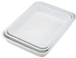
①ホーロー 角バット