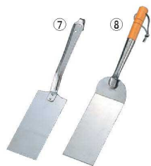
⑦UK 18-8 ギョーザ返し