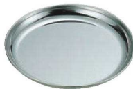
⑳EBM 18-0 給食皿