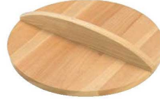
③EBM さわら 木蓋 (ギョーザ鍋用蓋兼用)