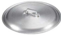
②アルミ ギョーザ鍋用蓋

※餃子鍋の板厚が厚いのは、熱が均一に広がり熱効率がすぐれ、ムラなく焼きあがるためです。