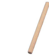
⑬EBM ギョーザ用 めん棒 (ブナ材)