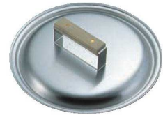
④ステンレス ギョーザ鍋用蓋