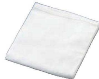
⑱ナイロン ギョーザ絞り袋