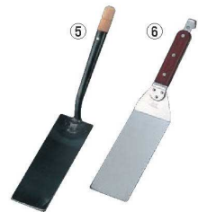
⑤EBM 鉄 ギョーザ返し