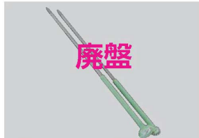
⑭ステンレス 温度計付 揚簀 天ぷらメーター