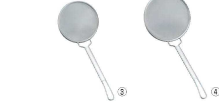
③フジボシ18-8 強力丸カス揚