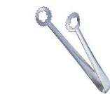
⑩EBM ステンレス 天ぷらトング