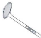
⑦TS 18-8 mini 丸型 カス揚