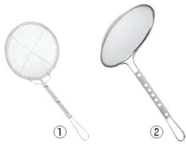
①EBM 18-8 手アミ式 丸型 カス揚