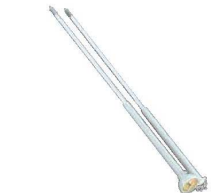
⑬アルミ 温度計付 揚簀 天ぷらメーター