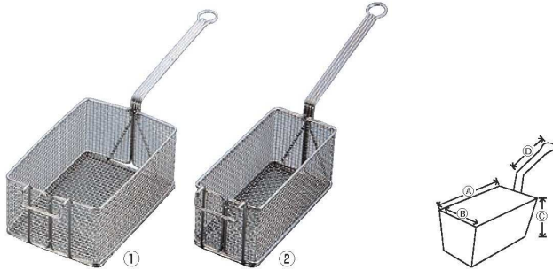
EBM 18-8 ポテトフライヤー