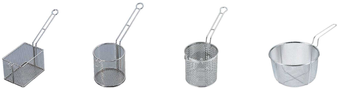
⑨EBM 18-8 フライドポテトバスケット (4メッシュ)