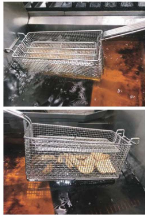
UK 18-8 パンチング ポテトフライヤー