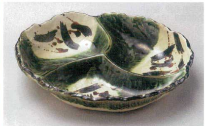
01007-179 織部三つ仕切9.0鉢 4,500円 20入 (27.4×25×4.5cm)