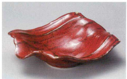
01010-149 紅柚子天目両上り9.5鉢 4,150円 15入 (29.3×24.3×8.1cm)