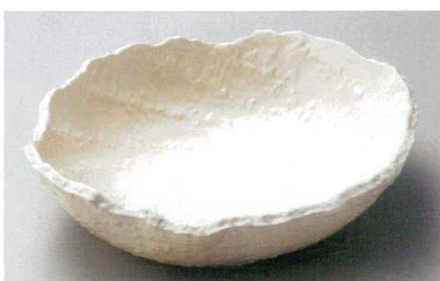
01014-649 白地うず潮9号盛鉢(萬古焼) 2,500円 16入 (27.5×24.2×7.3cm)