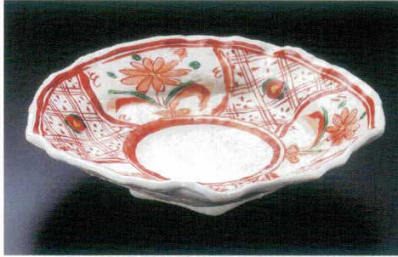
01002-189 赤絵間取9.0盛鉢 8,800円 10入 (27.5×27.5×7cm)