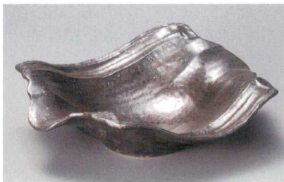
01008-469 金結晶両上がり9.5寸鉢 4,200円 20入 (29×24×7.7cm)