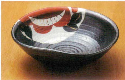
01005-579 赤絵椿天目9寸鉢 5,600円 12入 (27.5×26×9cm)