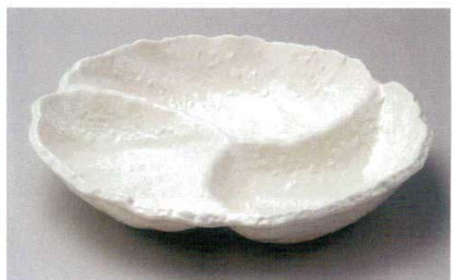
01013-649 白地うず潮三つ切オードブル(萬古焼) 2,600円 16入 (27.8×25.7×5.3cm)