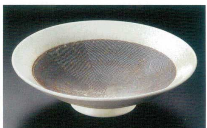
01017-059 櫛鏝9.0盛鉢 1,950円 18入 (28×7.7cm)