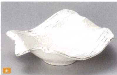
01009-469 炭化土粉引両上がり9.5寸鉢 4,200円 16入 (29×24×7.7cm)