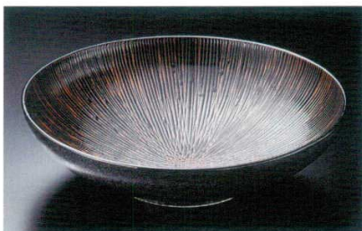
01011-479 乱十草9.5大鉢 3,000円 12入 (28.5×7.5cm)