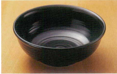
01001-179 黒玉淵9寸大盛鉢 11,000円 8入 (27.8×11.3cm)