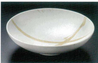
01012-579 白湧水メタ9.5鉢 2,950円 15入 (28.2×7.7cm)