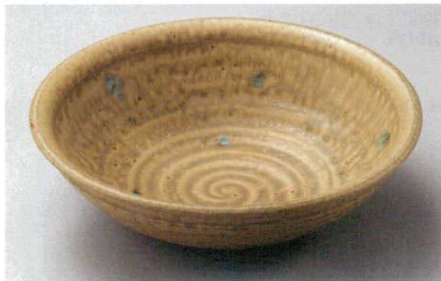
01004-109 黄瀬戸織部チョコボ9.0平鉢 5,500円 16入 (27.5×8.5cm)