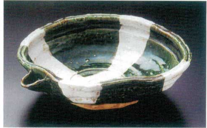
01003-179 織部剣先片口浅口大鉢 6,800円 12入 (29×24.8×7.5cm)