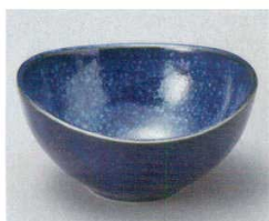
10226-559 窯変紺楕円3.5鉢 380円 100入 (10.8×10.5×5.2cm)