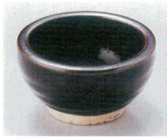
10208-269 ゆず天目厚口3.3小鉢 1,000円 80入 (10.8×6cm)