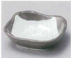
10214-549 アッシュダーク3.0角小鉢 820円 100入 (10.5×10.5×3.5cm)