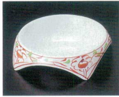
10201-149 錦万暦四足小鉢 2,400円 80入 (10.7×10.7×2.8cm)