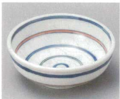
10224-199 胸筋3.5ボウル 450円 120入 (10.7×4cm)