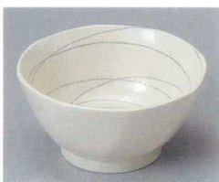
10228-309 白マット点丸ねじり八角3.6小鉢 380円 120入 (10.7×5.5cm)