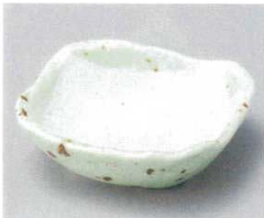
10215-549 アッシュグリーン3.0角小鉢 820円 100入 (10.5×10.5×3.5cm)