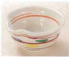
10205-449 虹彩片口小鉢 1,600円 80入 (10.7×10.2×5.5cm)