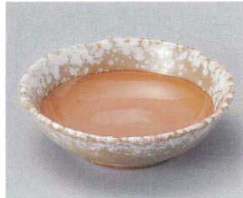
10216-559 胡桃三つ足3.5鉢 750円 120入 (10.9×3.5cm)