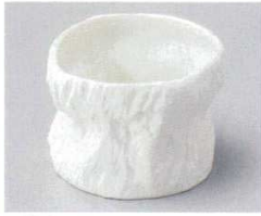
10203-469 白マット盛込カップ 1,600円 48入 (9×6.6cm)