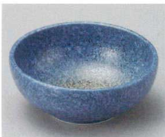
10225-029 星屑3.5ボール 400円 100入 (10.7×4.2cm)