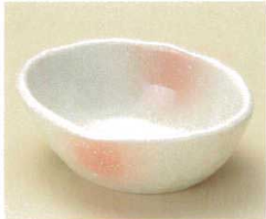
10217-309 晴白雪小付 480円 100入 (10.7×8.3×4.2cm)