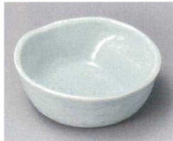
10211-149 青磁結び小鉢 980円 120入 (10.4×3.3cm)