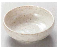
10229-209 うのふ3.5ボール 360円 100入 (10.8×3.7cm)