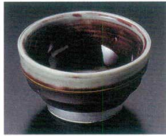
10206-269 辰砂削り3.3小鉢 1,100円 90入 (10.8×5.7cm)