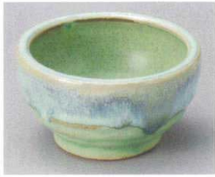
10207-269 深海マット厚口3.3小鉢 1,050円 60入 (10.8×6cm)