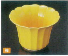
10202-459 黄釉菊割反型中鉢 1,600円 60入 (10.7×7.3cm)