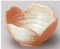
10213-459 あけぼの六兵衛小鉢 大 880円 100入 (10.3×5.8cm)