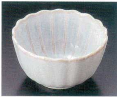
10210-449 窯変彩釉菊型小鉢 小 1,050円 120入 (10.3×5.6cm)