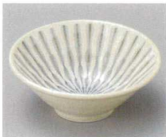
10223-059 白影3.5寸小鉢 430円 180入 (10.8×4cm)