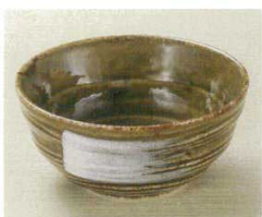
10227-519 縹部渦潮35鉢 380円 80入 (10.7×5cm)