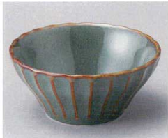
10212-029 かすみ 山藍10cm浅ボウル 900円 120入 (10.3×4.6cm)