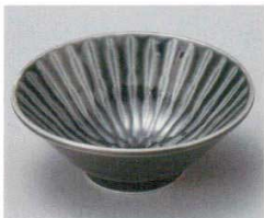
10222-059 黒影3.5寸小鉢 430円 180入 (10.8×4cm)