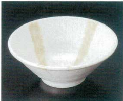
10220-479 和二重白流3.5鉢 440円 180入 (10.8×4cm)