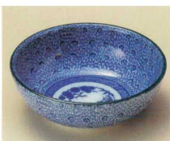
10230-479 古染松竹梅玉割 350円 120入 (11.5×4cm)