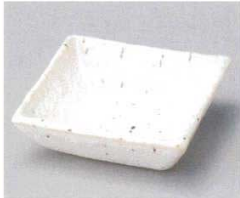
10218-579 白うのふ正角浅鉢 450円 100入 (9×8.7×3cm)