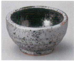
10209-269 銀彩結晶厚口3.3小鉢 1,000円 60入 (10.8×6cm)