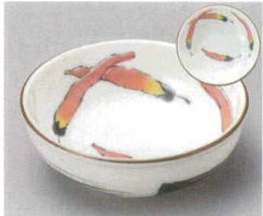
10219-199 染付とうがらし3.5ボール 450円 150入 (10.7×4cm)