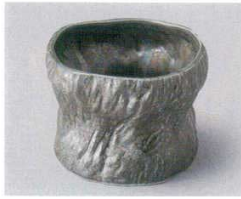
10204-469 シルバー盛込カップ 1,600円 48入 (9×6.6cm)