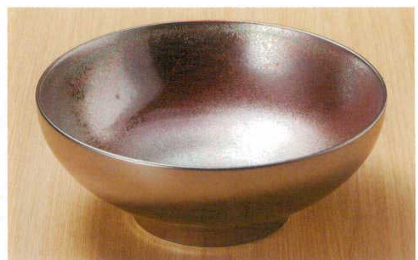
01217-139 紅彩25cm深大鉢 6,700円 15入 (25.3×10cm)