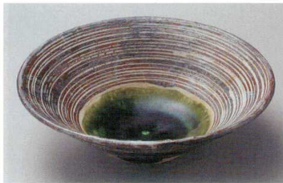
01210-519 鼠志野織部こま筋85大鉢 8,500円 20入 (25.5×7.4cm)