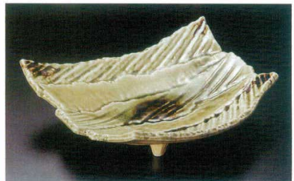
01208-149 ビード口変形8.5鉢 4,200円 20入 (26×24×7.5cm)