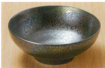
01216-139 黒彩25cm深大鉢 6,700円 15入 (25.3×10cm)