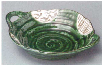
01212-109 織部山里手付大鉢 2,450円 24入 (25.5×20.5×5.5cm)