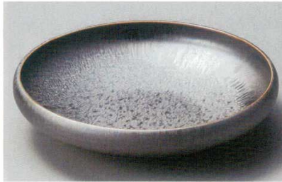
01202-139 いぶし金彩丸くくり大鉢 9,800円 (25.8×5.8cm)