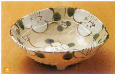
01207-179 格子花盛鉢 5,200円 30入 (26×24.5×7.5cm)