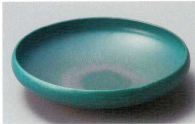
01201-139 窯変マットグリーン丸くくり大鉢 9,800円 (25.8×5.8cm)