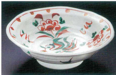
01213-149 赤絵8.0鉢 7,700円 15入 (25.5×7.5cm)