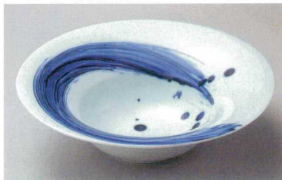
01204-149 呉須刷毛渦大鉢 5,700円 20入 (26×8cm)