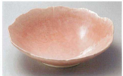
01211-579 彩りピンク花型8.0盛鉢 4,650円 20入 (25.5×6.8cm)