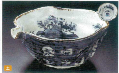
01203-179 山水片口特大鉢 6,600円 20入 (26×23.5×10.5cm)