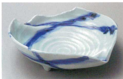
01215-179 呉須格子四ツ切8.0鉢 4,750円 15入 (25.3×25×7.3cm)