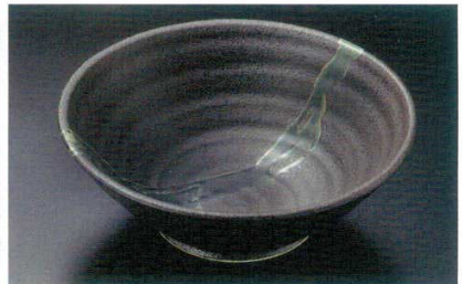
01214-109 南蛮織部流し8.5寸反井 3,700円 17入 (25.5×9cm)