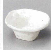
12030-199 白マットナデ角小付 400円 150入 (9.3×9×4cm)