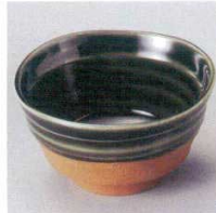
12032-139 織部3寸鉢 360円 120入 (9.4×5.3cm)