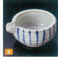
12018-259 呉須十草片口小付 800円 120入 (9.5×8×4.5cm)