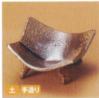
12001-309 トジメ灰釉小付足付(手造り) 2,750円 100入 (9.5×8.5×5.5cm)