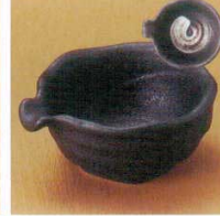
12022-199 南蛮白刷毛片口小付 450円 200入 (9.5×8.5×4.2cm)