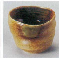
12006-459 伊賀織部吹きひねり小鉢 1,480円 80入 (9.5×9×7.5cm)