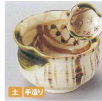
12005-519 織部花3.6小付(手造り) 1,500円 80入 (9.5×6.3cm)