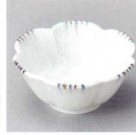
12011-559 測二色十草花型小付 1,300円 100入 (9.3×4.2cm)