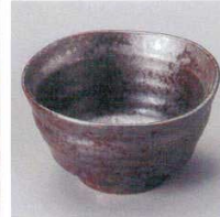
12034-139 茶結晶3寸鉢 360円 150入 (9.4×5.3cm)