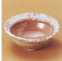
12025-559 胡桃丸3.0鉢 550円 200入 (9.3×3.8cm)