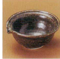
12021-029 窠変織部片口3.0小付 650円 100入 (9.5×4.4cm)