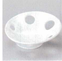
12015-179 ホワイト9.5cm透かし小付 1,150円 120入 (9.5×3.3cm)