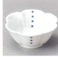
12010-589 フチドット花型小付 1,320円 120入 (9.3×4.2cm)