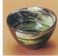
12016-559 しみず丸小付 1,000円 150入 (9.3×8.9×5.6cm)