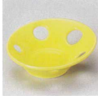
12013-179 イエロ-9.5cm透かし小付 1,150円 120入 (9.5×3.3cm)