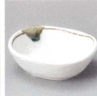
12035-519 志野ライン小判珍味 360円 100入 (9.2×7.8×3cm)