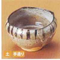
12007-309 唐津四方ククリ小鉢 1,850円 100入 (9.5×9.5×6cm)