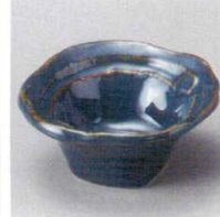
12029-199 ナマコナデ角小付 400円 150入 (9.3×9×4cm)