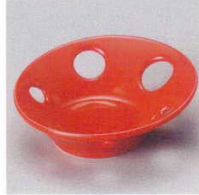
12014-179 レッド9.5cm透かし小付 1,150円 120入 (9.5×3.3cm)