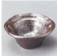
12031-199 黒マットナデ角小付 400円 150入 (9.3×9×4cm)