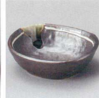
12036-519 鉄釉白ライン小判珍味 360円 100入 (9.2×7.8×3cm)