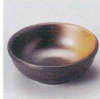
12026-029 金茶吹2.8ボール 450円 120入 (9.5×3.5cm)