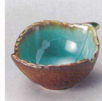
12028-319 伊賀エメラルド木ノ葉型珍味 440円 120入 (9.3×7.5×4cm)