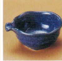
12023-199 青均窠片口小付 450円 200入 (9.5×8.5×4.2cm)