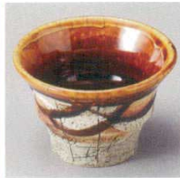
12002-519 船軸刻紋反りミニカップ 2,000円 100入 (9.6×6.4cm)