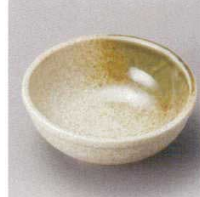
12027-029 織部吹砂茶2.8ボール 450円 100入 (9.5×3.5cm)