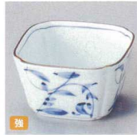
12003-439 唐草入角小鉢 2,200円 120入 (9.3×9.3×5.5cm)