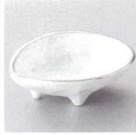
12008-139 白釉測プラチナアワビ小付 1,450円 180入 (9.5×7×3.4cm)