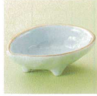
12009-139 青磁測金アワビ小付 1,450円 180入 (9.5×7×3.4cm)