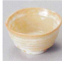
12033-139 志野3寸鉢 360円 120入 (9.4×5.3cm)