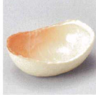
12020-149 明星椿円3.0小付 800円 150入 (9.3×7.4×3.3cm)