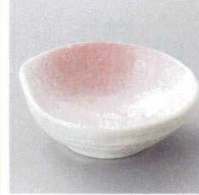
12017-459 桜雪片口千代久 880円 100入 (9.5×9.3×3cm)