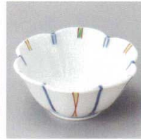
12004-589 錦三色十草小付 1,640円 120入 (9.3×4.2cm)