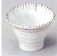
12019-579 十草青磁高浜小付 720円 100入 (9.4×6.7cm)