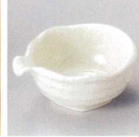
12024-199 粉引片口小付 400円 200入 (9.5×8.5×4.2cm)