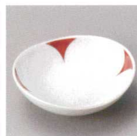
12626-739 錦四葉精円小付(有田焼) 520円 10入 (8×7.5×2cm)