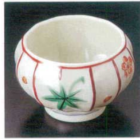
12601-299 錦ボンボリ(大) 2,100円 100入 (8×6.3cm) 12602-299 錦ボンボリ(小) 1,950円 120入 (6×4.5cm)