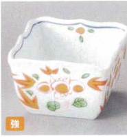
12603-439 赤絵小鉢 2,350円 120入 (7.9×7.9×5.2cm)