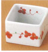
12610-739 帯花紋角小付(赤)(有田焼) 1,300円 5×24入 (7×7×4.5cm)