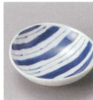
12634-739 縞十草精円小付(有田焼) 400円 10入 (8×7.5×2cm)