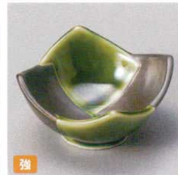
12620-579 繪部風車小鉢 780円 150入 (8.2×8.2×4.7cm)