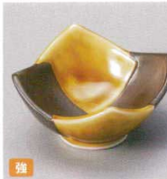
12621-579 黄瀬戸風車小鉢 780円 150入 (8.2×8.2×4.7cm)