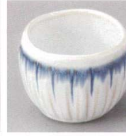
12612-449 削ぎ青流し小付 1,200円 100入 (8×6cm)