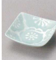
12616-739 はふり小付(梅・青)(波佐見焼) 950円 5入 (8×8cm)