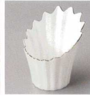
12606-259 オブリーク小付 測プラチナ白 1,500円 100入 (8×7.5×8.5cm)