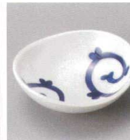
12635-739 唐草精円小付(有田焼) 400円 10入 (8×7.5×2cm)