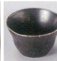
12636-139 いぶし黒結晶反型小付 330円 150入 (8.6×5.2cm)