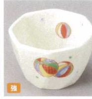
12611-259 手まり八角型小付 1,150円 160入 (7.5×5cm)