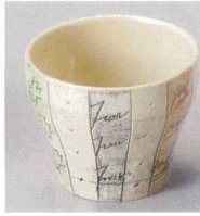
12604-519 色彩十草ミニカップ 1,900円 60入 (7.8×8.5cm・200cc)