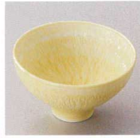
12608-149 黄とちり丸小付 1,400円 60入 (8.3×4.8cm)