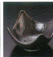
12630-459 伊賀四方小付 480円 120入 (6.4×4cm)