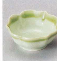
12617-439 緑釉桔梗型小付 1,150円 100入 (6×3.3cm)