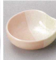
12624-029 ほのかピンク8cm小付 650円 120入 (8×7.8×3.2cm)