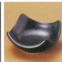
12631-199 黒釉角小付 400円 200入 (8×8×3.4cm)