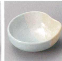
12637-029 ほのかブルー8cm小付 650円 120入 (8×7.8×3.2cm)