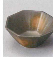
12618-139 黒茶吹八角小付 750円 180入 (8×7.7×3.4cm)