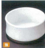
12622-579 強化白磁スタッキング小付 720円 120入 (7.8×3.5cm)