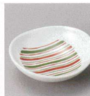
12629-739 錦十草精円小付(有田焼) 520円 10入 (8×7.5×2cm)