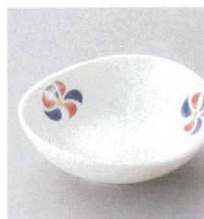
12628-739 錦車精円小付(有田焼) 520円 10入 (8×7.5×2cm・50cc)