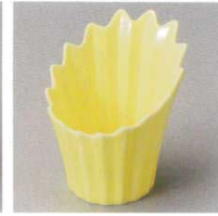
12607-259 オブリーク小付 イエロー 1,150円 100入 (8×7.5×8.5cm)