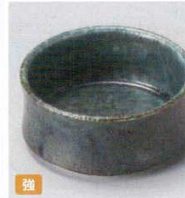
12623-579 強化イラボスタッキング小付 720円 120入 (7.8×3.5cm)