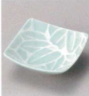
12615-739 はふり小付(竹・青)(波佐見焼) 950円 5入 (8×8cm)