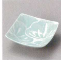
12614-739 はふり小付(松・青)(波佐見焼) 950円 5入 (8×8cm)