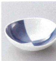
12633-739 市松精円小付(有田焼) 400円 10入 (8×7.5×2cm・50cc)