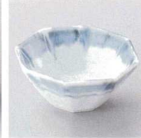
12619-139 呉須流し八角小付 750円 240入 (8×7.7×3.4cm)