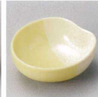
12625-029 ほのかイエロー8cm小付 650円 120入 (8×7.8×3.2cm)