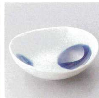
12632-739 二色丸紋精円小付(有田焼) 400円 10入 (8×7.5×2cm・50cc)