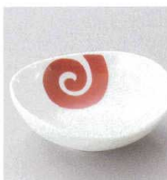
12627-739 錦渦紋精円小付(有田焼) 520円 10入 (8×7.5×2cm・50cc)