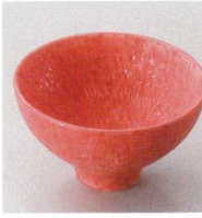
12609-149 赤とちり丸小付 1,400円 60入 (8.3×4.8cm)