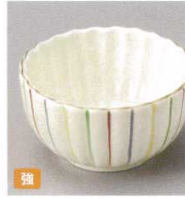
12605-589 赤絵十草菊型2.8小付 1,530円 120入 (8×4.3cm)