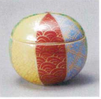
12809-259 手まり蓋付珍味 4,500円 150入 (6.5×6cm)