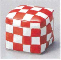
12815-739 赤絵市松角陶箱(小)(有田焼) 2,350円 1入 (6.5×6.5×6.5cm)