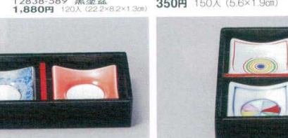
12849-149 柿四方皿 690円 300入 (4.8×4.8×1.5cm) 12850-149 木箱 1,400円 200入 (18.3×6.2×2.2cm)