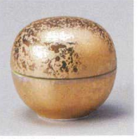
12810-299 金箔手まり珍味 3,100円 100入 (6.3×5.3cm)