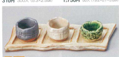
12856-309 鉄梅小丸珍味(手造り) 760円 200入 (4.5×4.3×3cm) 12857-309 粉引小丸珍味(手造り) 760円 200入 (4.5×4.3×3cm)