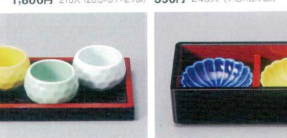
12836-589 玉彫珍味(グリーン) 630円 200入 (4.8×3cm) 12837-589 玉彫珍味(青磁) 630円 200入 (4.8×3cm) 12838-589 裏塗盆 1,880円 120入 (22.2×8.2×1.3cm)