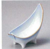
12819-259 測金コハルト吹筒型中付 2,000円 100入 (11.3×6.7×9.8cm)