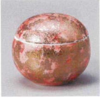
12808-179 朱金タタキ丸蓋物 3,700円 (7.5×6cm)