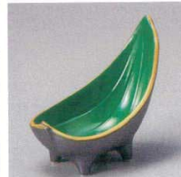
12818-149 緑交趾笹舟珍味 3,400円 150入 (11.3×6.7×9.8cm)