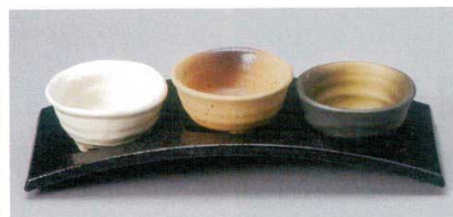
12827-479 白刷毛三ツ足珍味 390円 240入 (7.3×3.7cm) 12828-479 黄しからき三ツ足珍味 390円 240入 (7.3×3.7cm)