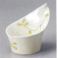
12822-259 カラー小鉢 2,400円 80入 (12×8.5×8.5cm)