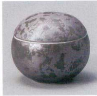
12813-179 いふし銀タタキ丸蓋物 2,300円 (7.5×6cm)