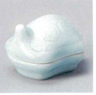
12816-299 青磁亀珍味入 1,250円 100入 (7×5.5×4.6cm)