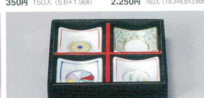
12851-149 駒四方皿(小) 800円 300入 (4.7×4.7×1.5cm) 12852-149 測金グリーン四方皿(小) 880円 300入 (4.8×4.8×1.5cm) 12853-149 上絵(小)フーセン小皿 800円 300入 (4.8×4.8×1.5cm)