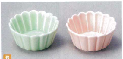
12831-559 ヒワ菊花3.5小鉢 1,380円 120入 (8.9×4.5cm)