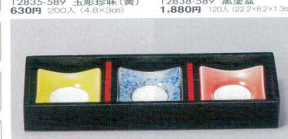
12847-149 黄四方皿 690円 300入 (4.8×4.8×1.5cm) 12848-149 測金ブルー四方皿 880円 300入 (4.8×4.8×1.5cm)