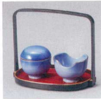
12802-299 濃コハルト両切珍味(金付) 1,100円 200入 (5×3.5cm) 12803-299 濃コハルト蓋付珍味(金付) 2,000円 200入 (4.5×4.5cm) 12804-299 小判型手さげ 1,050円 100入 (12.5×8.4×10.5cm)