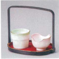
12805-299 ヒワ吹竹型珍味(金付) 780円 300入 (4.8×4cm) 12806-299 ヒンガ吹竹切珍味(金付) 910円 300入 (5×3.5cm) 12807-299 小判型手さげ 1,050円 100入 (12.5×8.4×10.5cm)