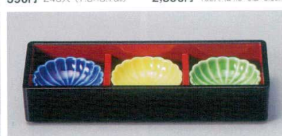
12839-299 菊型珍味(小)紺 350円 150入 (5.6×1.9cm) 12840-299 菊型珍味(小)黄 350円 150入 (5.6×1.9cm)