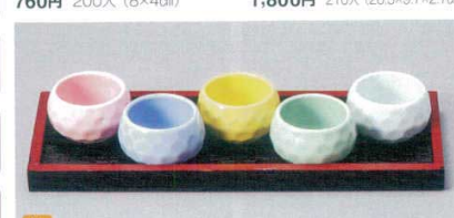
12833-589 玉彫珍味(ピンク) 630円 200入 (4.8×3cm) 12834-589 玉彫珍味(ブルー) 630円 200入 (4.8×3cm) 12835-589 玉彫珍味(黄) 630円 200入 (4.8×3cm)