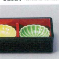
12841-299 菊型珍味(小)緑 350円 150入 (5.6×1.9cm) 12842-299 菊型珍味(小)用木枠 2,250円 160入 (19.3×6.8×3.8cm)