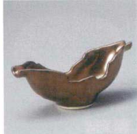
12820-149 黄金釉変形舟型珍味 2,450円 60入 (16.5×6.5×6.5cm)