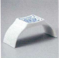
12821-149 両切り小花(裏絵)珍味 2,700円 100入 (13.3×6.3×7.3cm)