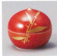
12812-439 朱巻笹蓋付珍味大 2,200円 100入 (6.4×5.6cm)