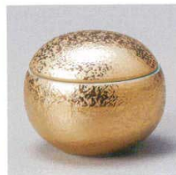
12811-259 金手まり蓋付珍味 4,800円 150入 (6.5×6cm)