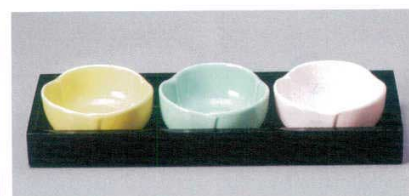
12823-299 黄手造風珍味 760円 200入 (8×4cm)