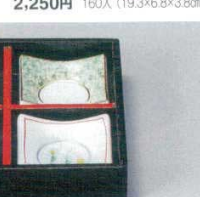
12854-149 上絵測赤小皿(小) 880円 300入 (4.8×4.8×1.5cm) 12855-149 木箱 1,700円 200入 (12×12×2.5cm)