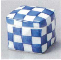
12814-739 染付市松角陶箱(小)(有田焼) 2,100円 1入 (6.5×6.5×6.5cm)