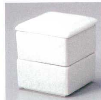
12817-459 白二段珍味 1,900円 60入 (7×7×7.2cm)