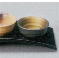
12829-479 焼ゴ三ツ足珍味 390円 240入 (7.3×3.7cm) 12830-479 黒石三ツ足珍味(ABS樹脂) 2,300円 100入 (24.5×9.2×3.5cm)