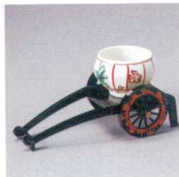
12801-299 御所車付錦ボンボリ 3,600円 60入 (19×11×8.7cm)