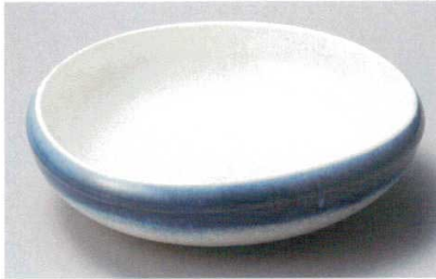
01401-319 アーバンネービー深ボール 8,600円 (24×6.7cm)