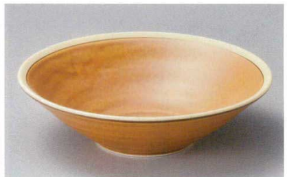
01410-579 カラメル7.0鉢 2,000円 25人 (23.1×6cm)