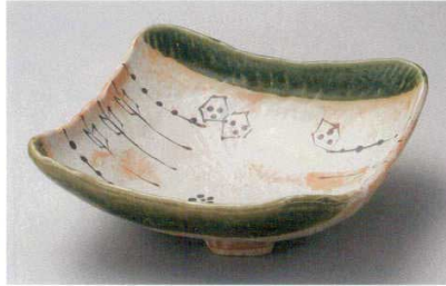
01402-559 織部尺角鉢 8,420円 15入 (24.3×23.5×9cm)