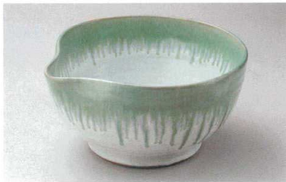
01404-179 白唐津織部片口8寸高台鉢 6,720円 10人 (24.5×12.5cm)