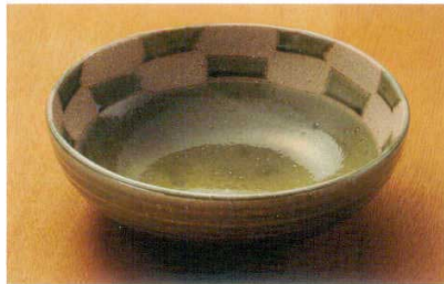
01405-109 織部間取8.0ボール 5,800円 17入 (24.5×8cm)