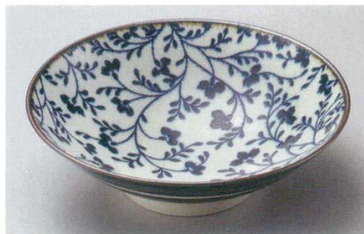
01409-109 おふけ草花8.0種鉢 2,000円 27人 (24.5×7.5cm)