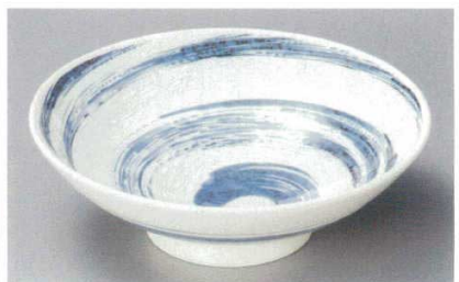
01413-179 粉吹青流8.0盛鉢 1,550円 (24.5×7cm)