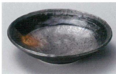
01412-179 新月手捻り8寸盛鉢 1,520円 (24×5.7cm)