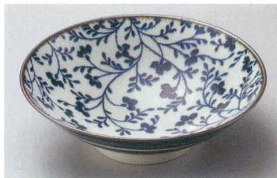
01409-109 おふけ草花8.0種鉢 2,000円 27入 (24.5×7.5cm)