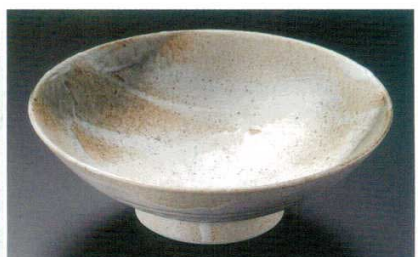
01416-179 雪志野8.0盛鉢 1,400円 30人 (24.5×8.2cm)