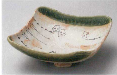
01402-559 織部尺角鉢 8,420円 15人 (24.3×23.5×9cm)