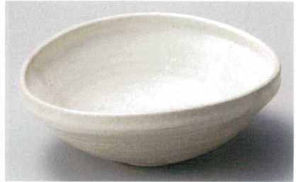
01403-669 粉引楕円鉢 8,000円 (23×20.5×9cm)