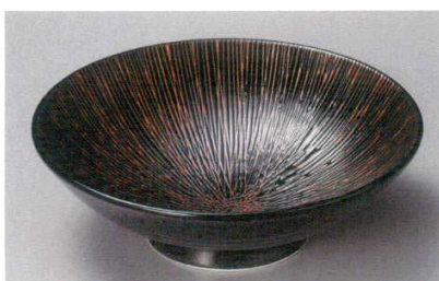
01414-059 黒十草8寸盛鉢 1,450円 20入 (24.3×7.7cm)