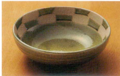
01405-109 織部間取8.0ボール 5,800円 17人 (24.5×8cm)