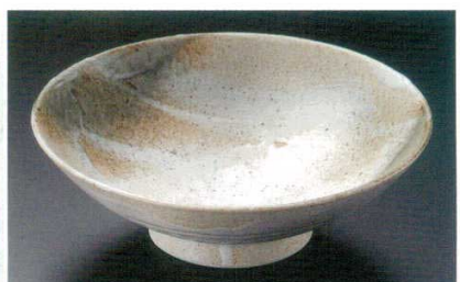
01416-179 雪志野8.0盛鉢 1,400円 30入 (24.5×8.2cm)