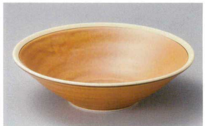
01410-579 カラメル7.0鉢 2,000円 25入 (23.1×6cm)