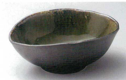
01407-139 いぶし織部変形大鉢 2,950円 20人 (24×20.7×9.2cm)