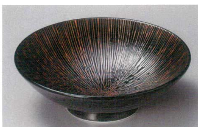
01414-059 黒十草8寸盛鉢 1,450円 20人 (24.3×7.7cm)