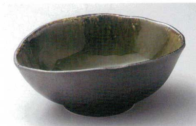
01407-139 いぶし織部変形大鉢 2,950円 20入 (24×20.7×9.2cm)