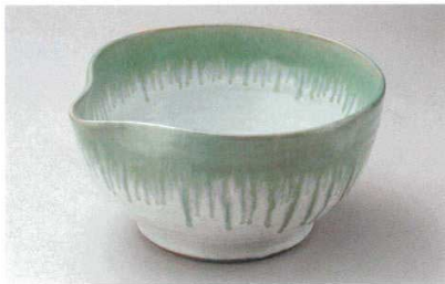
01404-179 白唐津織部片口8寸高台鉢 6,720円 10入 (24.5×12.5cm)