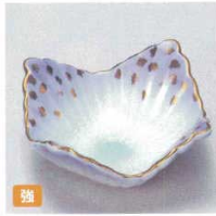
15001-139 マロン吹金タタキ菊形小鉢 1,580円 100入 (10.5×10.5×4.8cm)