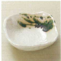
15024-549 織部伊吹3.0角小鉢 780円 100入 (10.5×10.5×3.1cm)