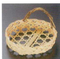
15035-419 竹かざら付丸皿 1,100円 100入 (11×4.5cm)