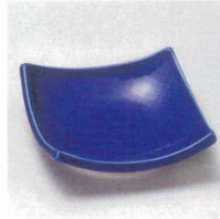
15014-439 ルリ正角深皿 1,000円 100入 (11.1×3.3cm)