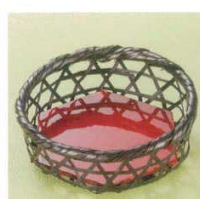
15033-419 染竹丸皿(朱塗板付) 2,300円 100入 (11.5×3.5cm)