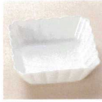
15008-249 かすみ松花堂 1,100円 80入 (11.1×3.2cm)