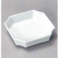
15018-439 白入角鉢 1,000円 100入 (11.2×2.8cm)