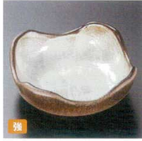
15005-579 備前志野四方皿 1,050円 80入 (11×11×4.3cm)