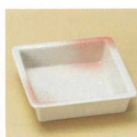
15032-239 ピンク吹松花堂 620円 80入 (11.6×11.6×3.2cm)