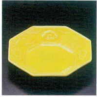
15006-189 黄釉八角皿 1,220円 80入 (12×11.5×2.4cm)