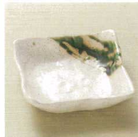
15021-549 織部伊吹4.0角小鉢 830円 80入 (11×11×2.5cm)