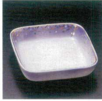
15004-559 武蔵野松花堂 1,350円 120入 (11.5×11.5×2.8cm)