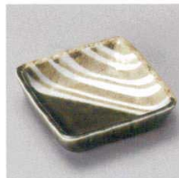
15019-559 織部ストライプ4.0正角鉢 830円 80入 (10.5×10.5×2.7cm)