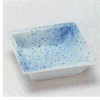
15010-459 吹墨角鉢 1,200円 100入 (11.5×11.5×3.5cm)