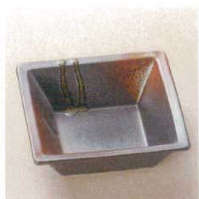
15030-029 明志野リム角小鉢 650円 80入 (11×3.5cm)