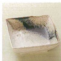
15028-029 銀河石目3.2角小鉢 850円 80入 (10.5×3.5cm)