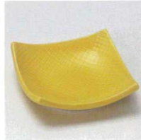
15013-439 黄正角深皿 1,000円 100入 (11.1×3.3cm)