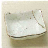
15022-549 グリーン斑点4.0角小鉢 830円 80入 (11×11×2.5cm)