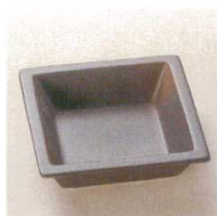
15029-039 備前正角鉢 720円 (11.2×11.2×3cm)