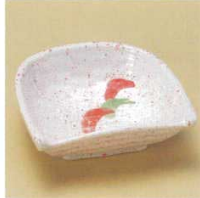
15017-149 赤絵カゴ小鉢 880円 80入 (10.5×4cm)