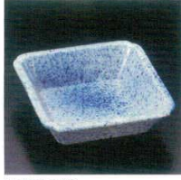
15011-299 測切平鉢吹 1,050円 100入 (11.5×11.5×3.5cm)