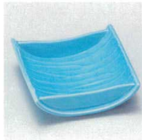
15023-439 舟型トルコ 880円 100入 (11.5×3cm)