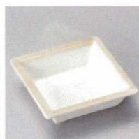
15026-059 測サビほかし角鉢 780円 90入 (11.4×11.4×3.4cm)