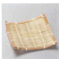
15036-419 竹角皿 950円 100入 (11×11×1.5cm)