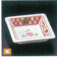
15002-189 赤絵万歴四角鉢 1,100円 60入 (11×11×3.3cm)