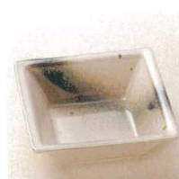
15031-029 銀河リム角小鉢 650円 80入 (11×3.5cm)