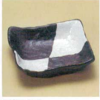
15012-559 市松4.0浅鉢 880円 120入 (11×11×3.2cm)