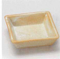
15016-439 志野狭口角鉢 1,000円 120入 (11×3.5cm)