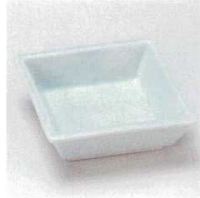
15015-439 青白狭口角鉢 1,000円 120入 (11×3.5cm)