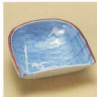
15020-149 竹籠小鉢 840円 80入 (10.5×10.5×4cm)