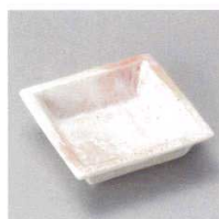
15025-059 桜吹き角鉢 780円 90入 (11.4×11.4×3.4cm)