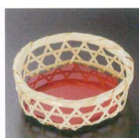
15034-419 白竹丸皿(朱塗板付) 2,150円 100入 (11.5×3.5cm)