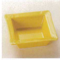
15009-029 黄濁正角鉢 980円 80入 (11×11×3.5cm)