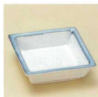
15027-269 青霞松花堂角鉢 750円 80入 (11.5×11.5×3cm)