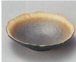
01602-589 夜明け8.0盛皿 7,020円 20入 (25×6.4cm)