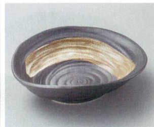
01619-459 黒釉白刷毛変型大鉢 2,700円 40入 (24.7×21.8×7.5cm)