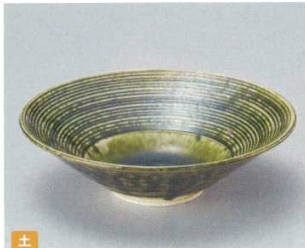
01601-519 総織部クシメ8.5反盛鉢 9,000円 30入 (24×7cm)