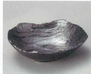
01604-189 荒瀬黒8.5盛鉢 5,000円 12入 (26×22.5×7cm) 01605-189 荒瀬黒7.0盛鉢 2,750円 30入 (21.5×18×6.2cm) 01606-189 荒瀬黒4.5小鉢 1,100円 60入 (14.5×12×4.5cm)