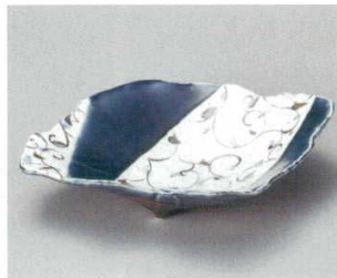
01608-579 藍唐草足付7寸菱鉢 4,950円 25入 (26.8×22×6cm)