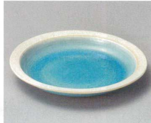
01603-579 トルコブルー8.0リム皿 5,400円 25入 (24.3×3.5cm)