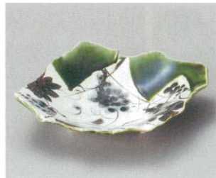
01609-579 織部ぶどう足付7寸菱鉢 4,950円 25入 (26.8×22×6cm)