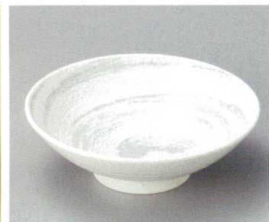
01624-179 早瀬白雲8.0盛鉢 1,550円 (24.5×7cm)