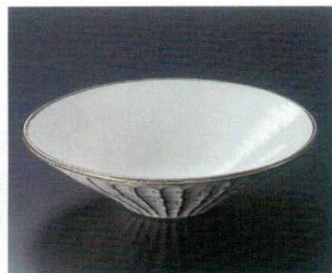
01617-409 錆粉引しのぎ浅鉢(大) 3,000円 20入 (24.5×6.6cm)