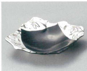
01607-579 黒織部花足付7寸菱鉢 4,950円 25入 (26.8×22×6cm)