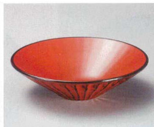
01612-449 ゆず黒マグナ深皿 大 4,400円 25入 (24.5×6.6cm) 01613-449 ゆず黒マグナ深皿 中 2,600円 40入 (20.2×5.8cm)