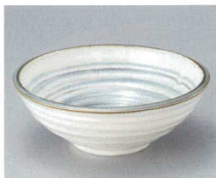
01620-319 さばトラ荒引大鉢 2,450円 20入 (23.8×8cm)