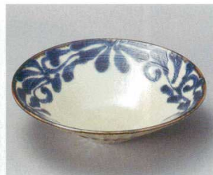
01618-449 南風深皿 大 3,200円 40入 (24.5×6.6cm)