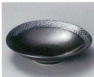
01616-199 ショコラ大鉢 3,000円 30入 (25.5×6cm)