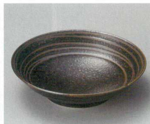
01621-199 黒イラホらいん8.0大鉢 2,200円 30入 (25×6cm)