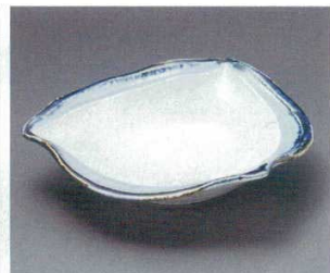
01615-149 瀬呉須変形8.0鉢 4,200円 30入 (25×6cm)