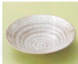
01622-029 わら土リップル8.0鉢 2,400円 20入 (26.2×7cm) 01623-029 わら土リップル7.0鉢 2,100円 30入 (23.2×6.4cm)