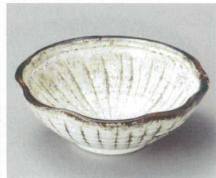
01610-189 うのふ流し白十草8.5盛鉢 4,560円 10入 (25.7×24.7×9cm)