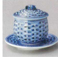
17023-179 強化呉須巻きカゴ蒸碗 2,200円 (6.5×5.6cm・150cc) ※蓋つきの高さ8cm