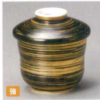
17001-439 黒金刷毛ミニ蒸し碗 4,600円 100入 (7.8×8.1cm)