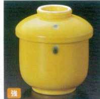
17034-149 金吹むさしのむし碗 1,900円 80入 (8×8.5cm・160cc)