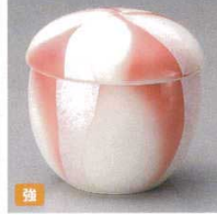
17016-249 強化オレンジむし碗(小) 2,600円 60入 (7.7×7.5cm・132cc)