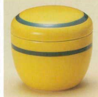
17028-549 梅祥瑞小むし碗 2,150円 60入 (7.5×8.3cm・140cc)