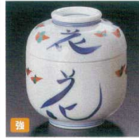
17003-149 雪月花むし碗(小) 3,500円 80入 (7×8.2cm・140cc)