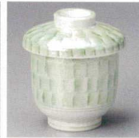
17006-189 グリンカスリラスター小むし碗 4,250円 60入 (7×9cm・180cc)