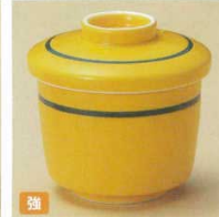
17038-549 ラインむし碗(小) 1,750円 80入 (7.3×8.5cm・180cc)