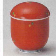
17032-549 白盛山茶花小むし碗 2,050円 60入 (7.8×8.5cm・150cc)