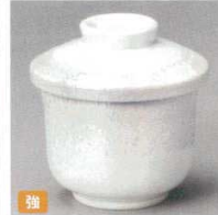
17036-739 駒筋小むし碗(有田焼) 2,100円 5×24入 (6.5×8cm・150cc)