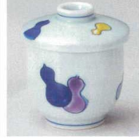
17020-739 錦瓢小むし碗(有田焼) 2,500円 5×24入 (7.5×8cm・150cc)