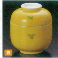
17004-149 黄釉グリーン点ミニむし碗 3,500円 80入 (7×8.2cm・140cc)