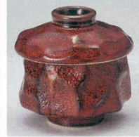
17026-469 岩肌黒むし碗 2,300円 80入 (8×8.4cm・150cc)