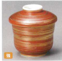
17002-439 赤金刷毛ミニ蒸し碗 4,600円 100入 (7.8×8.1cm)