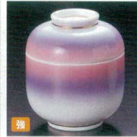
17005-259 二色吹ピンクムラサキミニ蒸し碗 2,850円 80入 (7.2×8.5cm・150cc)