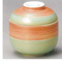
17010-479 曙金彩小むし碗 3,150円 80入 (7.8×8cm)