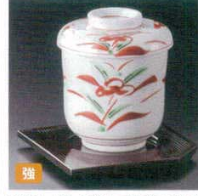
17011-139 赤絵京風小花小むし碗 2,950円 80入 (6.9×8.8cm・180cc)