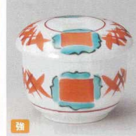
17030-559 錦ほほえみむし碗 2,000円 80入 (7.4×6.8cm・140cc)