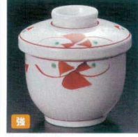
17013-559 細十草菊型むし碗 2,860円 80入 (7.8×8.8cm・160cc)