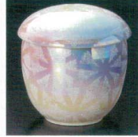
17018-189 ラスター銀彩二色吹むし碗(小) 2,750円 60入 (7×7cm・130cc)