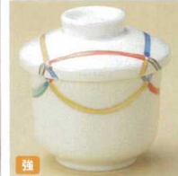
17037-549 真珠小むし碗 1,800円 80入 (7.3×8.6cm・180cc)