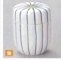
17012-139 うるみ菊切干飯し受皿(ABS) 720円 150入 (10×10cm)