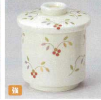
17019-439 南天ミニ蒸碗 3,080円 60入 (6.4×8.1cm・130cc)