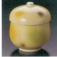
17015-179 あすか三色吹むし碗(小) 2,600円 100入 (6.4×8.5cm・130cc)