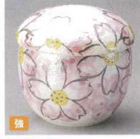
17009-589 ラスター華々蒸碗 3,180円 60入 (7.5×7.2cm・135cc)