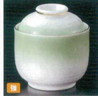
17022-559 グリーンむし碗 2,300円 80入 (8×8.4cm・180cc)