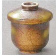
17033-739 朱巻グリーン水玉むし碗(有田焼) 2,200円 5×24入 (6.5×8cm・150cc)