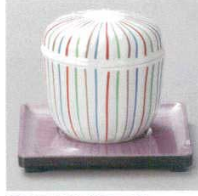
17007-149 菊形十草 3,100円 60入 (8×8cm・160cc)