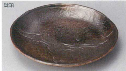
琥珀 17807-659 10号丸皿(萬古焼) 4,500円 15入 (30×4.5cm) 17808-659 9号丸皿(萬古焼) 2,900円 20入 (27×4cm)