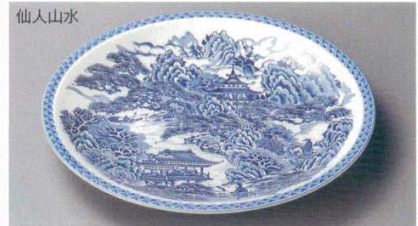
仙人山水 17811-659 12号丸皿(萬古焼) 3,300円 12入 (37×4cm) 17812-659 10号丸皿(萬古焼) 2,100円 20入 (32×3cm)