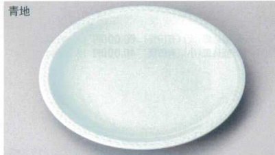
青地 17804-649 10号ダイヤ皿(萬古焼) 2,100円 24入 (32×3.5cm)