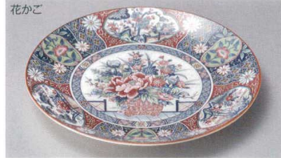
花かご 17802-649 10号丸皿(萬古焼) 2,750円 20入 (32×3.5cm)