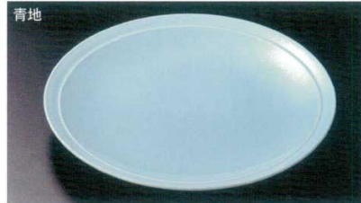
青地 17809-659 高台皿12号(萬古焼) 3,800円 10入 (37.5×5cm) 17810-659 高台皿11号(萬古焼) 3,400円 12入 (34.5×5cm)