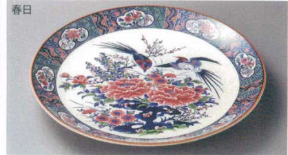
春日 17803-649 13号丸皿(萬古焼) 6,500円 10入 (42.5×5cm)