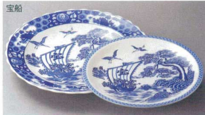
宝船 17822-659 13号雪輪皿(萬古焼) 5,800円 8入 (42×5.5cm) 17823-659 12号皿(萬古焼) 3,300円 12入 (37×4cm) 17824-659 10号皿(萬古焼) 2,100円 20入 (32×3cm)