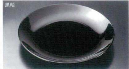
黒釉 17829-649 13号丸皿(萬古焼) 6,500円 10入 (42×5cm) 17830-659 12号丸皿(萬古焼) 3,400円 12入 (37×4cm) 17831-659 10号丸皿(萬古焼) 2,600円 20入 (32×3.5cm)