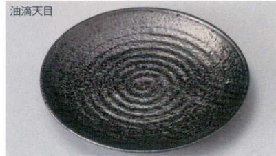
油滴天目 17816-649 11号丸皿(萬古焼) 5,100円 12入 (33.6×3.2cm) 17817-649 10号丸皿(萬古焼) 3,300円 16入 (30×3.2cm) 17818-649 8号丸皿(萬古焼) 2,200円 26入 (24.7×2.5cm)