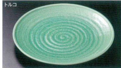
トルコ 17805-649 10号丸皿(萬古焼) 3,300円 18入 (30.3×3.3cm)