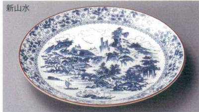
新山水 17813-649 13号丸皿(萬古焼) 5,800円 10入 (42.5×5cm) 17814-649 12号丸皿(萬古焼) 3,300円 14入 (37×4.5cm) 17815-649 10号丸皿(萬古焼) 2,100円 24入 (32×3.5cm)