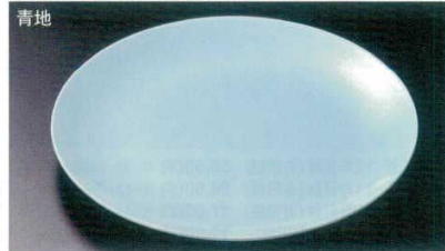
青地 17825-649 13号丸皿(萬古焼) 5,800円 10入 (42.5×5cm) 17826-649 12号丸皿(萬古焼) 3,300円 14入 (37×4.5cm) 17827-649 11号丸皿(萬古焼) 3,000円 16入 (34×4cm) 17828-649 10号丸皿(萬古焼) 2,100円 24入 (32×3.5cm)