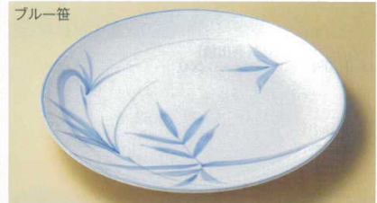
ブルー笹 17806-649 13号丸皿(萬古焼) 5,800円 10入 (42.5×5cm)