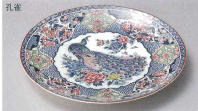
孔雀 17801-649 10号丸皿(萬古焼) 2,750円 20入 (32×3.5cm)