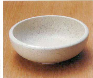
01825-029 荒吹梨地8.0盛鉢 1,750円 16入 (23.5×8cm)