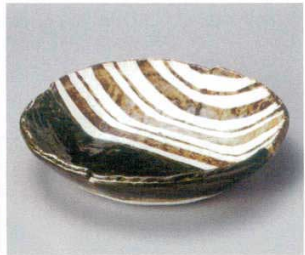
01808-559 織部ストライプ7.5丸鉢 3,400円 30入 (23×4.5cm) 01809-559 織部ストライプ6.5丸鉢 2,570円 40入 (19×4.5cm)