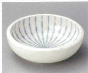
01805-319 ひより白括り手8寸深鉢 2,500円 20入 (23.7×7.4cm)