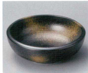
01819-459 月の輪7.5石目深鉢 2,200円 20入 (23×7.6cm) 01820-459 月の輪括り手6.5鉢 1,350円 40入 (20.2×6.6cm)