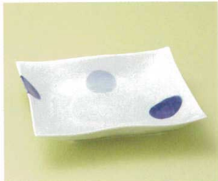
01802-739 二色丸紋角浅大鉢(有田焼) 7,000円 1入 (23×23×4.5cm・1,000cc)