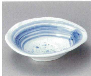
01806-259 青の空うず巻盛鉢 3,850円 30入 (23×20.3×5.8cm)