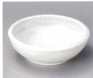
01817-459 ハケメ白雪7.5石目深鉢 2,200円 20入 (23×7.6cm) 01818-459 ハケメ白雪括り手6.5鉢 1,350円 40入 (20.2×6.6cm)