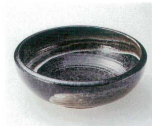
01822-189 白刷8.0鉢 2,250円 16入 (23.5×8cm)