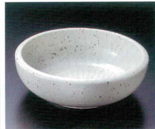
01823-189 白ゆず8.0鉢 2,250円 16入 (23.5×8cm)