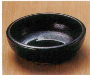
01812-139 青彩天目7.5寸ボール 2,350円 15入 (23.5×7.8cm) 01813-139 青彩天目6.5ボール 1,600円 30入 (20.6×6.5cm)