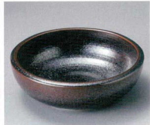
01821-479 火色流し8.0深鉢 2,000円 18入 (23.5×7.7cm)