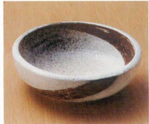
01814-279 志野サビ刷毛括り手8.0鉢 2,200円 18入 (23.5×7.5cm)