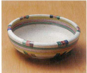
01804-029 荒吹春日8.0盛鉢 5,900円 16入 (23.5×8cm)