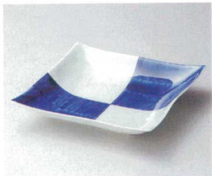
01801-739 市松紋角浅大鉢(有田焼) 7,000円 1入 (23×23×4.5cm・1,000cc)