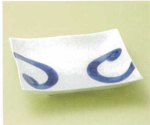
01803-739 渦紋角浅大鉢(有田焼) 7,000円 1入 (23×23×4.5cm・1,000cc)