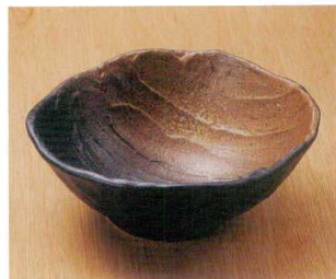
01810-299 黒備前吹き荒ソギ23cm大鉢 4,300円 10入 (23.2×10cm)