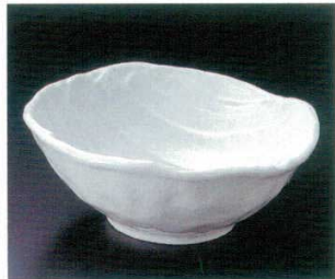
01807-029 白荒削ぎ23cm大鉢 3,500円 20入 (23×9.5cm)