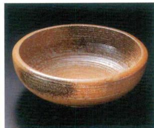
01815-319 大地8.0深鉢 2,250円 20入 (23×8cm) 01816-319 大地6.5深鉢 1,500円 60入 (20×5.5cm)