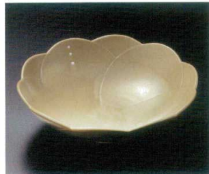
01811-319 花ドット一珍白茶大鉢 2,850円 30入 (23.4×23.4×6.3cm)