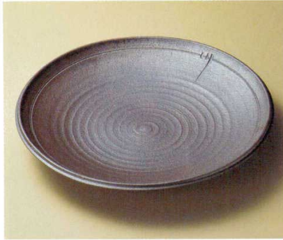
18103-669 炭化ロクロ目13.0大皿 (信楽焼) 17,500円 8入 (39.5×6cm) 18104-669 炭化ロクロ目11.0大皿 (信楽焼) 11,500円 10入 (33×5.5cm)