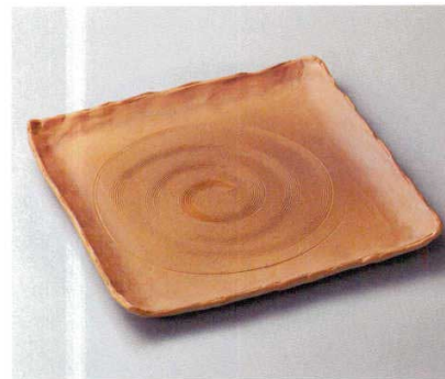
18119-669 火色10.0正角皿 (信楽焼) 7,100円 10入 (29×29×3cm)