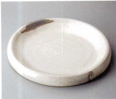
18101-669 灰釉粉引12.3台皿 (信楽焼) 21,000円 5入 (37×4.5cm) 18102-669 灰釉粉引10.0台皿 (信楽焼) 12,500円 10入 (31.5×3.5cm)