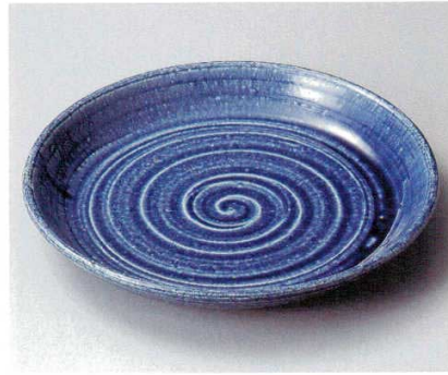
18118-309 紺コバルト10.0皿 8,800円 10入 (33.5×5cm)