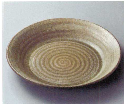
18109-669 古窯13.0皿鉢 (信楽焼) 14,800円 10入 (39×6cm) 18110-669 古窯11.0皿鉢 (信楽焼) 10,000円 10入 (33.5×5cm) 18111-669 古窯9.0皿鉢 (信楽焼) 5,500円 20入 (27×4.3cm)