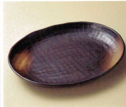
18120-309 黒備前吹桶円大盛皿 6,300円 10入 (37×29×5cm)