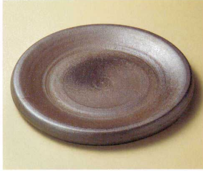
18105-669 黒窯変12.3台皿 (信楽焼) 17,000円 6入 (37×4.6cm) 18106-669 黒窯変10.0台皿 (信楽焼) 11,000円 10入 (31×3.5cm)