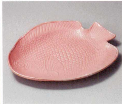
18116-269 窯変ピンク鯛盛皿 4,200円 16入 (32.5×27×3.5cm) 18117-269 窯変ピンク鯛皿 1,900円 40入 (24×19.8×2.8cm)