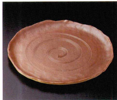
18114-669 火色12.0丸皿 (信楽焼) 11,500円 10入 (34×2.5cm) 18115-669 火色10.0丸皿 (信楽焼) 6,000円 15入 (29×2.5cm)