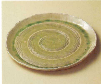
18112-669 萌黄12.0丸皿 (信楽焼) 11,500円 10入 (35×3cm) 18113-669 萌黄10.0丸皿 (信楽焼) 6,000円 15入 (29×2.5cm)