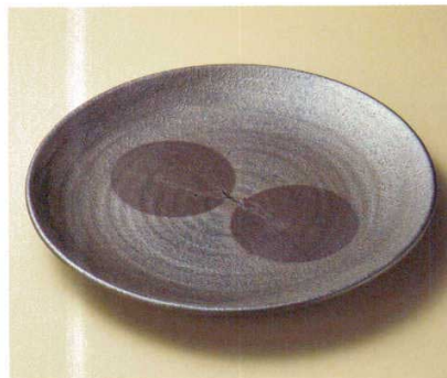
18107-669 黒窯変13.0ボタモチ丸皿 (信楽焼) 13,800円 5入 (39×5cm) 18108-669 黒窯変11.0ボタモチ丸皿 (信楽焼) 7,800円 10入 (33×4cm)