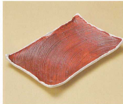
18711-059 朱巻粉引き角皿 大 6,100円 14入 (37×24.5×4cm) 18712-059 朱巻粉引き角皿 中 4,700円 16入 (31×21×4cm) 18713-059 朱巻粉引き角皿 小 3,200円 25入 (26×17.5×3.5cm)