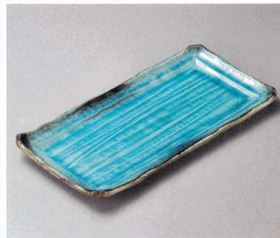
18718-179 均窯スカイブルーソギ長角大皿 5,300円 10入 (42.8×21.5×3.7cm)