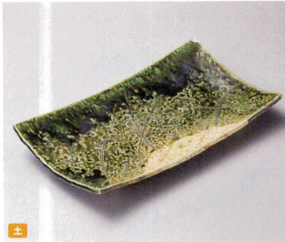
18701-519 織部長角大皿 20,000円 10入 (35.5×21.3×5.5cm)