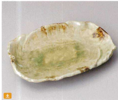
18709-649 砂ビードロ12号変形皿 (萬古焼) 6,000円 10入 (37×25.5×6cm) 18710-649 砂ビードロ10号変形皿 (萬古焼) 3,900円 16入 (32×22×5.5cm)