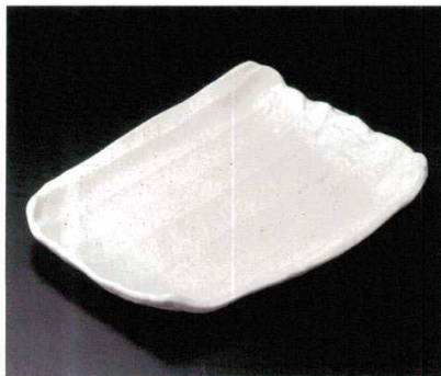
18717-579 荒削ぎ白釉 台形大皿 8,100円 9入 (36.5×29×4.8cm)