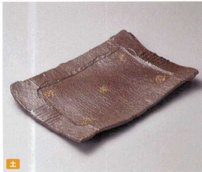
18704-179 炭化土砂目長角13.0盛皿 9,400円 10入 (38.5×27×3.7cm)