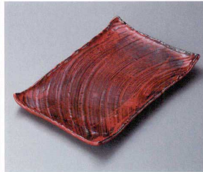
18705-449 ゆず黒マグナ角盛皿 大 9,200円 20入 (37×24.5×4cm) 18706-449 ゆず黒マグナ角盛皿 中 7,000円 24入 (31×21×4cm) 18707-449 ゆず黒マグナ角盛皿 小 4,900円 30入 (26×17.5×3.5cm)