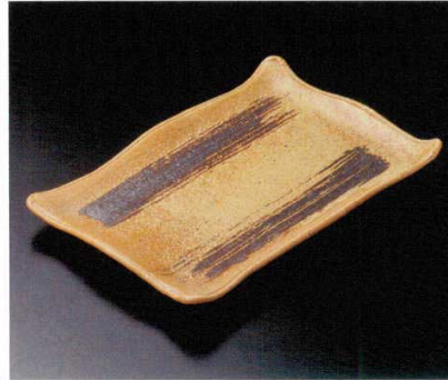
18702-669 イラボ鉄刷毛目13.0足付長角皿 (信楽焼) 12,500円 10入 (38×25×4cm)