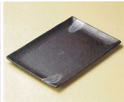
18719-579 白雲尺長角皿 3,950円 15入 (34.5×24×2.3cm)