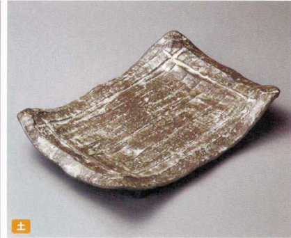
18703-179 炭化土白化粧尺2寸盛皿 10,100円 12入 (37.2×26.5×5.6cm)