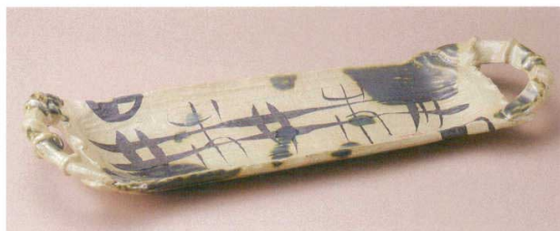
19407-149 織部両手付15.0長皿 7,700円 10入(47.5×16.5×7.5cm)