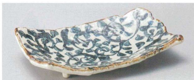
19409-299 新タコ唐草 まな板皿 4,000円 (31×19.2×6.7cm)