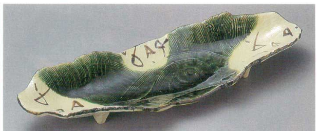
19408-189 織部長盛皿 7,980円 10入(44×14.7×5.3cm)