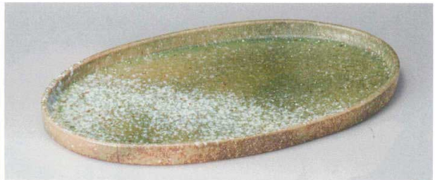
19404-669 ビードロ15.0小判皿 13,500円 (49×28×3cm)