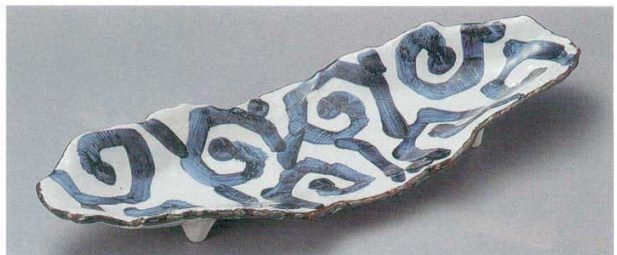
19406-299 たご唐草ワニ皿 8,200円 15入(43.5×14.5×5.3cm)