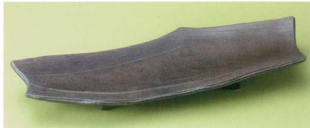
19403-149 金結晶15.0長盛皿 10,500円 10入(48.5×19.5×4.7cm)