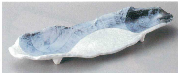
19405-149 呉須串目長皿 8,700円 15入(43×14.5×6cm)