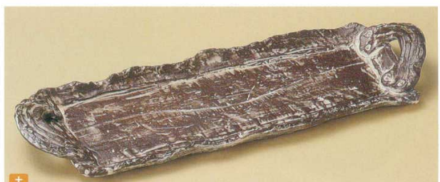
19410-179 炭化土白化粧手付尺5寸皿 7,200円 15入(47×16×5.5cm)