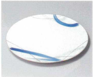
20605-149 銀彩刷毛目28cm丸皿 5,500円 20入 (28×1.6cm) 20606-149 銀彩刷毛目22.5cm丸皿 4,600円 30入 (22.5×1.5cm)