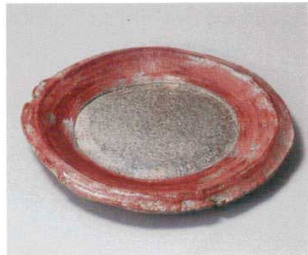
20601-669 黒窯変8.5皿皿 10,000円 (26×3.5cm) 20602-669 黒窯変7.0皿皿 6,750円 (21×3cm)