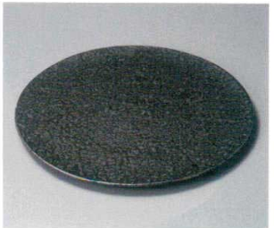
20607-149 金タタキフラット丸皿-大 5,550円 20入 (29.5×1.7cm) ※N 20608-149 金タタキフラット丸皿-中 4,150円 30入 (24.5×1.6cm) ※N 20609-149 金タタキフラット丸皿-小 2,750円 50入 (16.5×1.5cm) ※N