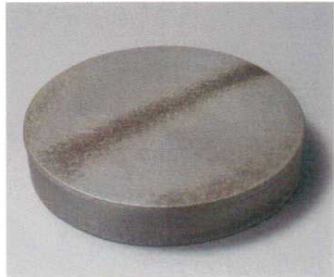
20603-669 黒銀彩8.3台皿 7,500円 (25×25×5cm) 20604-669 黒銀彩5.6台皿 4,250円 (17×17×3.5cm)