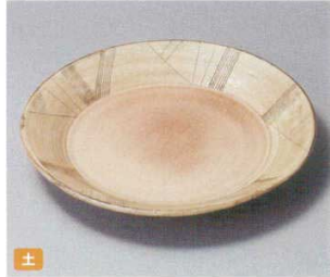
20803-519 ランダム ピンクパスタプレート 4,800円 30入 (24.5×3.5cm)