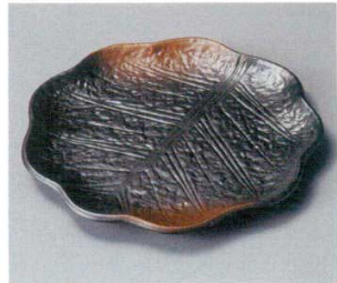
20816-549 やきしめ木の葉型8.0丸皿 3,550円 20入 (25.5×2cm)