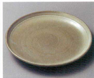
20821-299 手造風粉引吹8.0皿 3,000円 40入 (25×3.5cm)