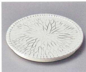
20805-469 粉引ダリア彫り丸皿(大) 5,800円 (25×2.6cm)