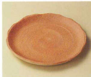
20813-669 火色8.0丸皿(信楽焼) 3,780円 25入 (25×2.5cm)