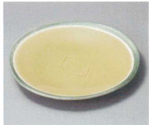
20812-669 深海8.0丸皿 4,300円 (24.5×3cm)