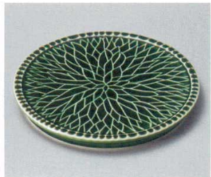
20808-149 織部和紙ダリア彫皿 4,700円 20入 (24.7×2.5cm)