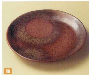
20810-149 備前手起8.0皿 5,200円 20入 (24.8×3.5cm)