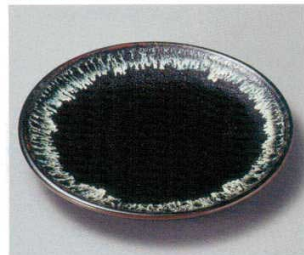
20823-269 ゆず天目白糸丸8.0皿 2,750円 24入 (25×3cm)