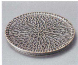
20807-149 孔雀ダリア彫皿 4,700円 20入 (24.5×2.5cm)