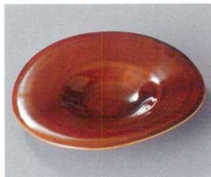
20809-149 ア×軸木目変形大皿 4,650円 20入 (25×24×4.8cm)