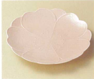
20802-739 さくらさくら桃釉おもてなし皿(有田焼) 7,000円 1入 (25×3.5cm)