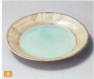
20804-519 ランダム トルコパスタプレート 4,800円 30入 (24.5×3.5cm)