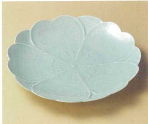
20801-739 さくらさくら青磁おもてなし皿(有田焼) 7,000円 1入 (25×3.5cm)