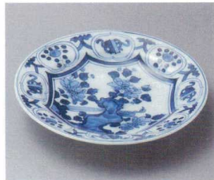
20811-149 染付芙蓉7.5皿 4,200円 20入 (25×4.3cm)