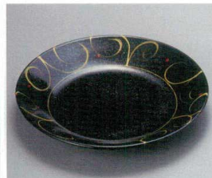
20822-459 黒御影金彩唐草8寸皿 2,950円 25入 (24.6×3.5cm)