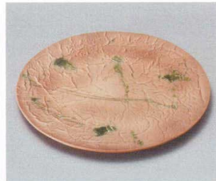
20815-149 焼締め飛ばし和紙丸皿 3,550円 25入 (24.5×1.5cm)