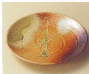
20819-669 古信楽8.0丸皿(信楽焼) 3,650円 25入 (25×3.5cm)