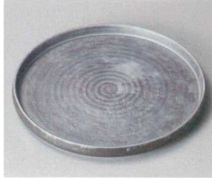
21004-139 いぶし銀巻切立24cmプレート 5,500円 24入 (24.2×2.1cm) 21005-139 いぶし銀巻切立21cmプレート 4,750円 30入 (21×2cm) 21006-139 いぶし銀巻切立18cmプレート 3,900円 40入 (18×2cm)