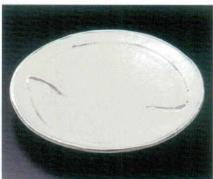
21017-179 粉引拭取り8寸深皿 3,900円 25入 (24.3×3.8cm)