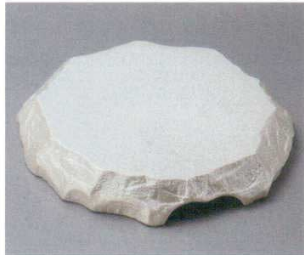
21010-149 プラチナ岩肌高台8.0皿 5,400円 20入 (24.5×8cm)