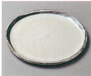
21019-669 鉄刷毛目8.0丸皿(信楽焼) 3,780円 30入 (24×2cm) 21020-669 鉄刷毛目7.0丸皿(信楽焼) 2,850円 35入 (21×2cm)