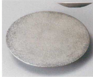
21001-669 黒窯変8.0高台皿(信楽焼) 11,000円 12入 (24.4×4.2cm)