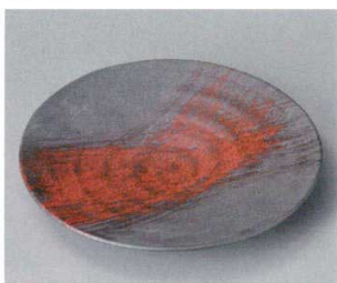
21026-469 プラステリカ(赤)24cm/バスタ皿 3,800円 24入 (24.5×3.7cm)