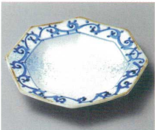
21023-139 染付タコ吹墨八角7.5盛皿 3,450円 30入 (24.7×23.2×3.7cm)