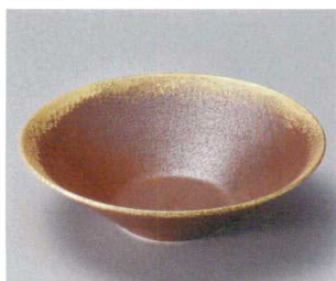
21025-459 備前測金彩8寸鉢 3,300円 25入 (24.6×7.3cm)