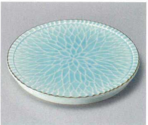
21012-149 マリンブルーダリア影皿 4,700円 20入 (24.3×2.5cm)