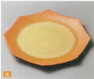
21011-179 伊賀八角皿 5,400円 20入 (24.4×2.5cm)