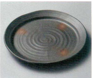
21024-259 備前8寸皿 3,700円 30入 (24.7×2.8cm)