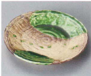
21021-559 錆袖ヒワ流8.0丸皿 3,700円 20入 (24.5×3.4cm) 21022-559 錆袖ヒワ流6.3丸皿 3,000円 30入 (19.5×2.7cm)