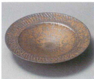
21015-189 金結晶8.0浅ボール 4,250円 20入 (24.7×4.6cm) 21016-189 金結晶7.0浅ボール 3,750円 30入 (21.7×4.4cm)