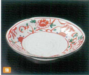
21007-589 赤絵花8.0丸皿 7,840円 20入 (24.8×4.7cm)