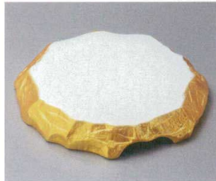
21009-149 ゴールド岩肌高台8.0皿 5,400円 20入 (24.5×8cm)