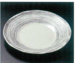
21018-179 粉引刷毛目くしめ8寸皿 3,900円 25入 (24.5×3.4cm)