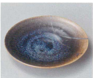
21027-469 煌デリカ24cm/バスタ皿 3,800円 24入 (24.7×3.5cm)