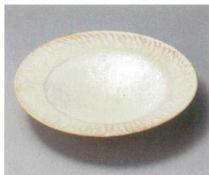
21013-189 シェル釉8.0浅ボール 4,200円 20入 (24.7×4.6cm) 21014-189 シェル釉7.0浅ボール 3,700円 30入 (21.7×4.4cm)