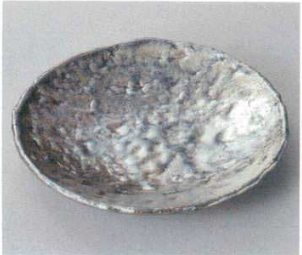
21008-669 銀袖8.0丸皿(信楽焼) 5,300円 25入 (24×3.8cm)