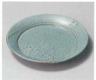
21413-459 ドライブルー7.5リム皿 2,960円 40入 (22.5×2.9cm) 21414-459 ドライブルー5.0リム皿 1,200円 100入 (15.2×2cm)