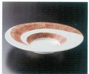
21408-469 朱金タタキ祝渦巻皿 4,600円 20入 (23.5×4cm)