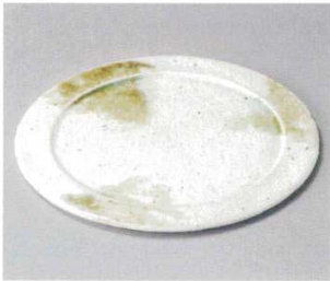
21409-179 浮雲六寸丸皿 4,200円 (23.5×1cm)