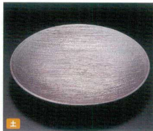
21407-149 桐炭化7.5皿 4,300円 30入 (23×3cm)