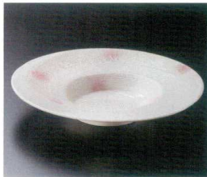
21406-469 ピンクラスター祝渦巻皿 4,600円 20入 (23.5×4cm)