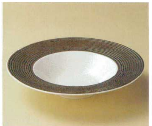
21422-409 リベラブラック24cmスープ 2,550円 40入 (24.2×5.1cm)