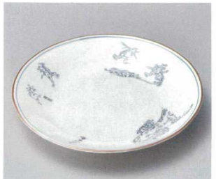
21426-149 測錆波型高山寺7.0皿 2,150円 30入 (22×3.5cm)