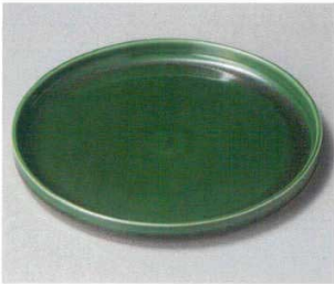
21415-189 グリーン7.5スタックプレート 2,800円 20入 (23.1×2cm) 21416-189 グリーン7.0スタックプレート 2,300円 30入 (21.2×2cm) 21417-189 グリーン6.0スタックプレート 1,800円 40入 (17.5×1.8cm)