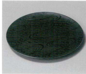
21403-179 黒マット釉流水22cm丸皿 4,900円 (22×1.5cm)