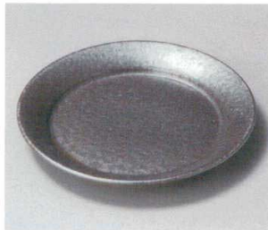
21411-459 ドライブラック7.5リム皿 2,960円 40入 (22.5×2.9cm) 21412-459 ドライブラック5.0リム皿 1,200円 100入 (15.2×2cm)