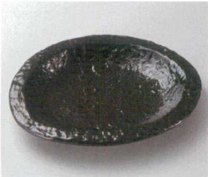
21423-299 黒帽子型7.0皿 3,200円 50入 (23.8×21×3cm)