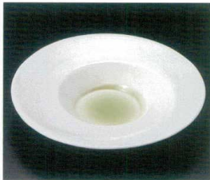
21421-189 ヒワリング和皿 3,800円 30入 (23.5×4cm)