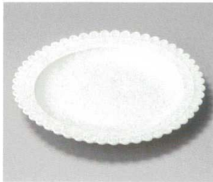
21410-189 フラワー8.0浅鉢 4,000円 30入 (23.6×3cm)