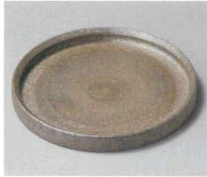
21402-669 黒窯変7.0切立皿 6,250円 (22×2.3cm)