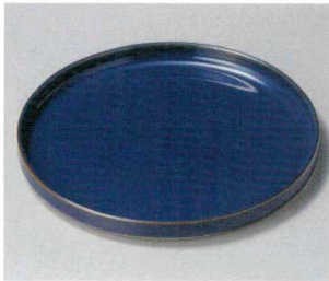
21418-189 ブルー7.5スタックプレート 2,800円 20入 (23.1×2cm) 21419-189 ブルー7.0スタックプレート 2,300円 30入 (21.2×2cm) 21420-189 ブルー6.0スタックプレート 1,800円 40入 (17.5×1.8cm)