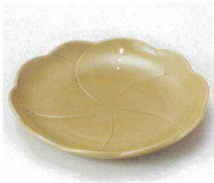
21425-319 花ドット一珍白茶バスタ皿 2,200円 30入 (23.5×23.5×3cm)