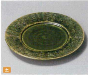
21401-519 総織部くし目リム75皿 7,000円 40入 (22.8×2cm)