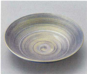
21424-459 青釉緑金彩7寸鉢 2,250円 25入 (22×5.3cm)