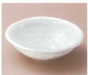
02218-459 さざ波 白舞 深鉢 1,800円 40入 (20.5×19.4×6cm)