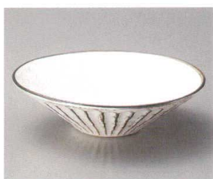
02214-409 錆粉引しのぎ浅鉢(中) 1,750円 30入 (20.2×5.8cm)