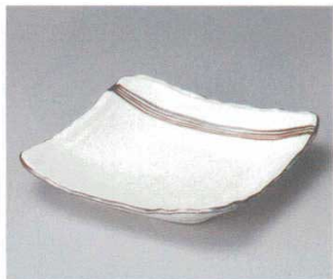
02207-339 志野流線7寸正角鉢 3,000円 20入 (20.5×3.7cm)