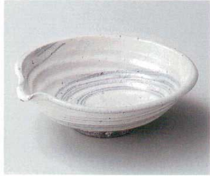
02203-669 白刷毛目7.0片口平鉢(信楽焼) 4,600円 35入 (20.5×20×6cm)