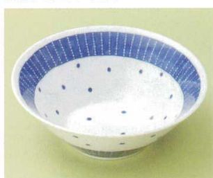
02220-199 蒼天7.0鉢 1,300円 40入 (20.5×7.5cm)