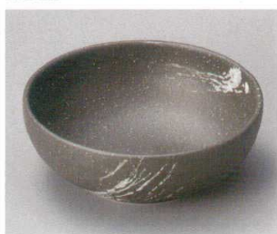
02215-279 吹雪石目6.5ボール 1,800円 28入 (20.4×7.5cm) 02216-279 吹雪石目5.5ボール 900円 40入 (17×6.2cm)