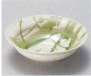
02202-669 ビードロ流し7.0鉢 5,000円 (20×6cm)