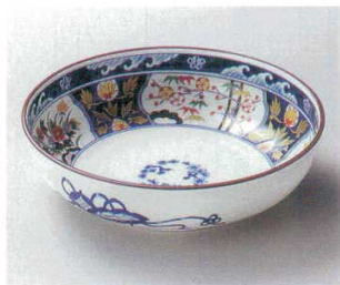
02206-739 染錦紋様7号鉢(有田焼) 4,200円 3入 (20.5×6cm・1.100cc)