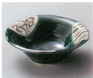
02212-109 織部トチリストライプ7寸鉢 1,850円 30入 (20×6.5cm)