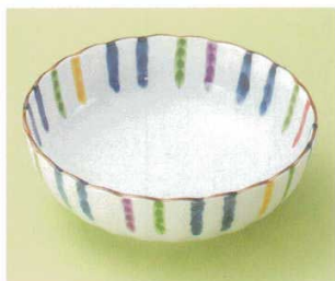
02210-109 彩十草6.8盛鉢 2,200円 40入 (20.5×20.5×7.2cm) 02211-109 彩十草5.5鉢 1,150円 60入 (16.6×16.6×6cm)