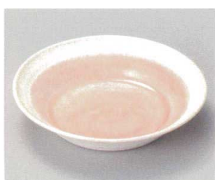
02219-579 ローゼ7.0鉢 1,700円 40入 (21.3×4.5cm)