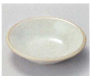
02222-579 宙20cmスーパボウル 1,300円 40入 (20×5.3cm)