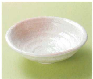
02208-459 あげほの舞 深鉢 2,250円 30入 (20.5×19.4×6cm)