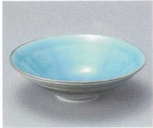
02201-669 トルコブルー7.0鉢 5,780円 (21×6.5cm)