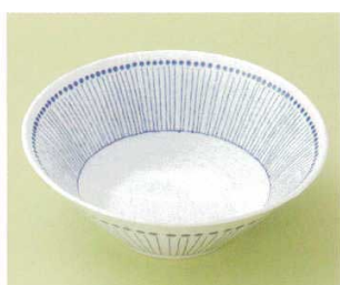
02221-199 蒼十草7.0鉢 1,300円 40入 (20.5×7.5cm)