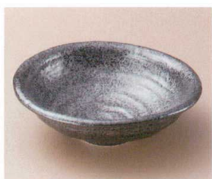
02217-459 いぶし黒舞 深鉢 1,800円 40入 (20.5×19.4×6cm)