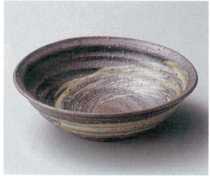
02204-669 灰刷毛目7.0鉢(信楽焼) 4,700円 40入 (20.5×6cm)