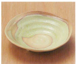
02213-139 ビードロイエローミツ足盛鉢 1,800円 36入 (21×5.5cm)