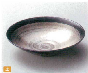
02205-469 銀彩6.5浅鉢 4,500円 45入 (20.4×5cm)