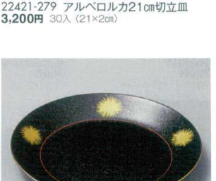
22427-459 黒御影金彩火花7寸皿 2,300円 40入 (21.6×2.7cm)