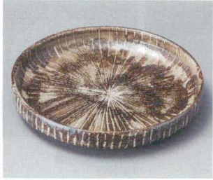
22403-519 雪志野十草切立和皿 7,000円 30入 (20.5×2.5cm)