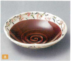
22410-279 アメ釉草花輪花7.0鉢 3,800円 40入 (20.5×5.7cm)