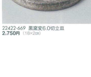
22422-669 黒窯変6.0切立皿 2,750円 (18×2cm)