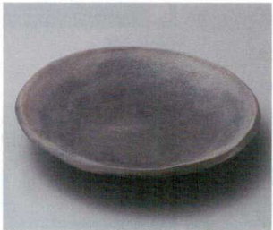
22420-669 炭化タタラ7.0皿(信楽焼) 3,800円 25入 (21×2.5cm)