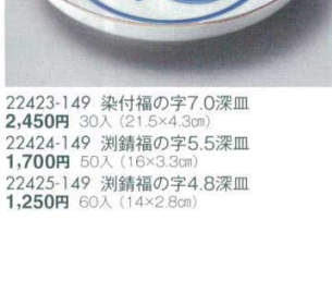
22423-149 染付福の字7.0深皿 2,450円 30入 (21.5×4.3cm)