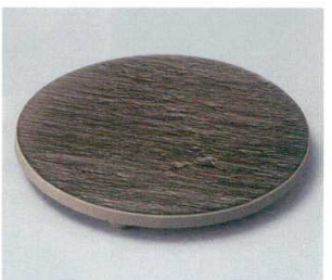
22417-179 黒陶石目四つ足丸皿 3,600円 (21×2cm)