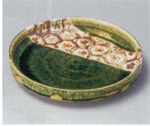
22402-519 織部亀甲切立和皿 7,000円 30入 (20.5×2.5cm)