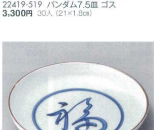
22419-519 バンダム7.5皿 ゴス 3,300円 30入 (21×1.8cm)