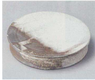
22405-669 黒銀彩5.6台皿小 4,250円 (17×17×3.5cm)