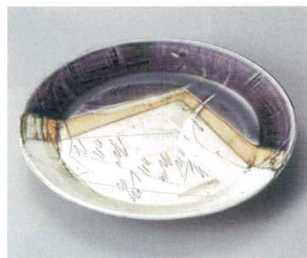
22411-519 紫釉刻紋70皿 4,500円 40入 (21.4×2.8cm)