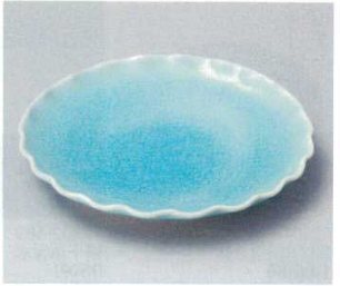
22404-579 トルコブルー輪花7.0皿 5,400円 40入 (20.8×3.2cm)