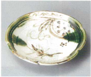
22408-519 織部70皿 4,000円 30入 (21×2.8cm)