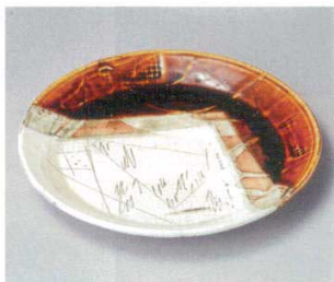
22413-519 飴釉刻紋70皿 4,500円 40入 (21.4×2.8cm)