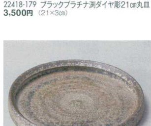
22418-179 ブラックプラチナ測ダイヤ彫21cm丸皿 3,500円 (21×3cm)