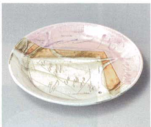
22415-519 ピンク釉刻紋70皿 4,500円 40入 (21.4×2.8cm)