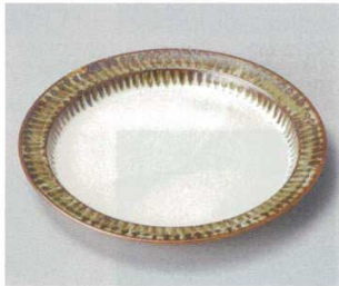
22414-519 飴釉刻紋50皿 2,200円 80入 (16.4×2.8cm)