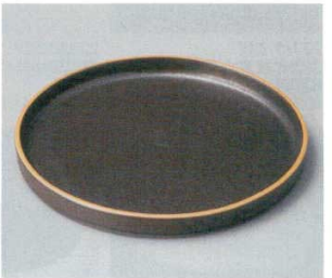
22421-279 アルペロルカ21cm切立皿 3,200円 30入 (21×2cm)