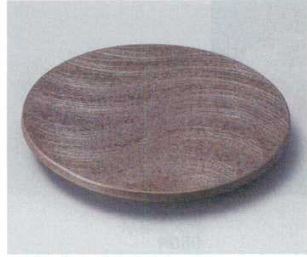
22401-319 炭化黒丸台皿(小) 8,000円 30入 (18.2×2.4cm)