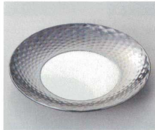
22412-519 紫釉刻紋50皿 2,200円 80入 (16.4×2.8cm)