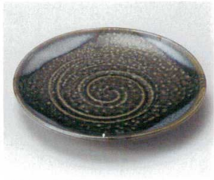
22812-269 織部おふけ丸7寸皿 1,650円 40入 (22×3cm)