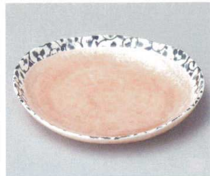
22805-519 唐草ピンク和皿 1,850円 40入 (19.2×18.7×2.8cm)