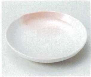
22816-459 春がすみ22cmバスタ皿 1,200円 30入 (22×4cm)