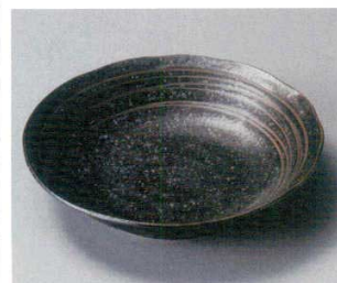
22818-199 黒イラボらいん7.0深皿 880円 40入 (22×4.8cm)