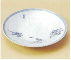
22804-469 鳥獸戯画大皿 2,600円 40入 (22×3.2cm)