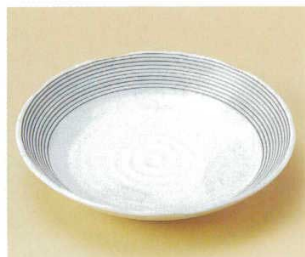
22819-459 ドリームライン白7.0深皿 860円 40入 (21.8×4cm)