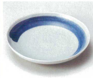
22814-319 清瀬新バスタ皿 1,200円 30入 (22×22×4cm)