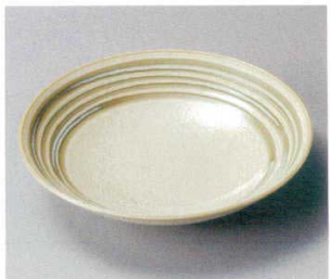
22821-199 ビードロらいん220深プレート 650円 40入 (22×4.7cm)