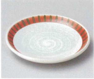
22803-259 白化粧丸7.0皿 2,850円 20入 (22×3.2cm)