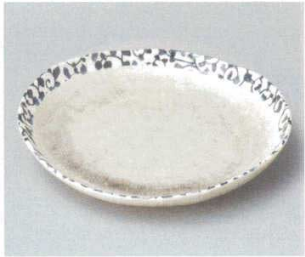
22807-519 唐草グレー和皿 1,850円 40入 (19.2×18.7×2.8cm)