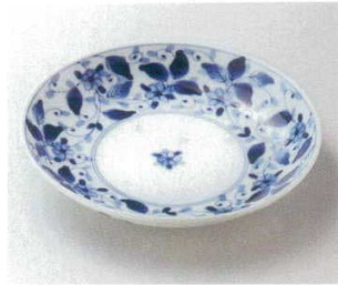
22815-199 染付彩華7.0皿 1,100円 50入 (22×3.5cm)