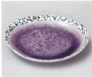
22806-519 唐草バイオレット和皿 1,850円 40入 (19.2×18.7×2.8cm)