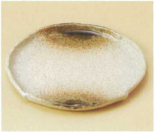
22808-559 伊賀織部タタラ型7.0寸丸皿 2,770円 30入 (21.8×1.5cm)