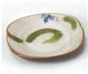
22811-549 織部ぶどう7.0変形角皿 1,800円 40入 (22×19×2.5cm)