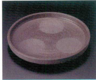
22801-179 炭化土7.5切立丸皿 4,400円 20入 (22.4×2.7cm)