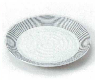
22820-459 ドリームライン白7.0皿 860円 40入 (21.4×2.7cm)