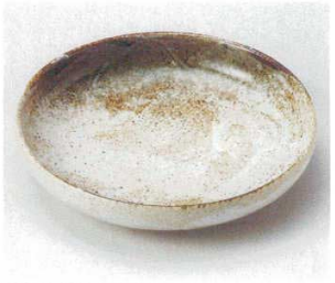
22813-179 雪志野バスタ 1,250円 40入 (21.8×4.5cm)