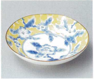
22817-319 黄彩花紋六兵6.8深皿 800円 40入 (21×5.2cm)