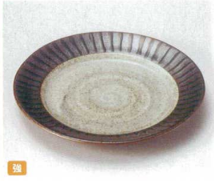
22802-149 瀏オリベ刷毛目7.5皿 3,700円 30入 (22.5×3.5cm)