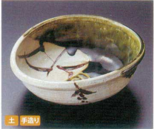
02403-519 織部草紋たわみ預け鉢 4,500円 30入 (19×16×6.8cm)