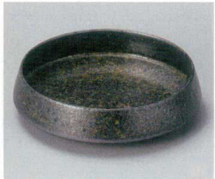
02407-139 黒唐津くくり鉢(大) 3,550円 30入 (19×5.2cm)