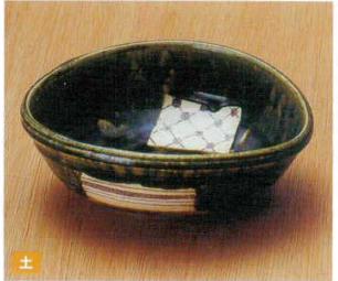
02404-519 織部格子たわみ預け鉢 4,500円 40入 (19×16×6.8cm)