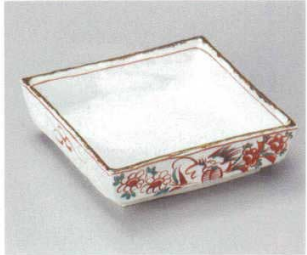
02402-579 赤絵花六寸正角鉢 5,900円 20入 (18×18×5.3cm)