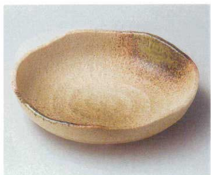
02410-559 伊賀織部ろくへ型6.5寸ボウル 2,600円 30入 (19.4×4.3cm)