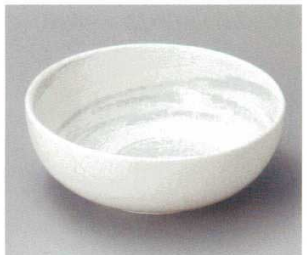
02416-179 早瀬白雪6.5ボール 1,100円 (19.5×7.3cm)