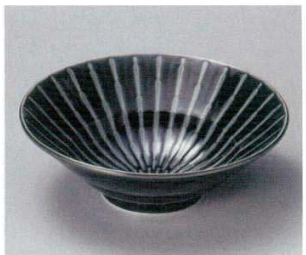
02420-059 黒影6.5寸鉢 880円 40入 (20×6.8cm)