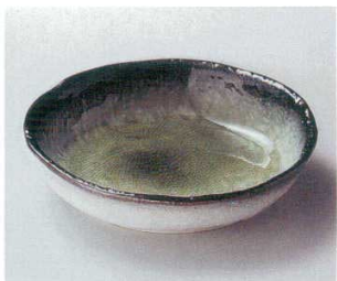
02419-459 御深井貫入6寸盛鉢 1,300円 40入 (19×4.3cm)