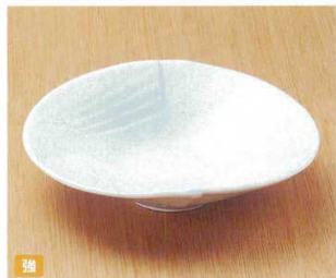
02413-149 青白磁切り合せ皿 1,850円 40入 (19×18×4.5cm)