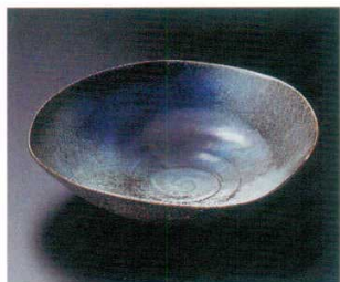
02409-299 森の湖平鉢 2,300円 40入 (18.3×5.2cm)