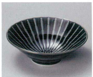
02420-059 黒影6.5寸鉢 880円 40入 (20×6.8cm)