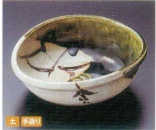
02403-519 織部草紋たわみ預け鉢 4,500円 30入 (19×16×6.8cm)