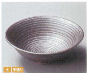
02411-109 焼しめボール 大 2,200円 30入 (19.5×6.8cm)