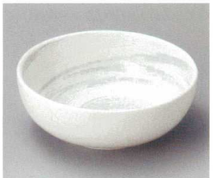
02416-179 早瀬白雪6.5ボール 1,100円 (19.5×7.3cm)