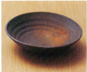
02406-669 炭化窯変6.2丸鉢(信楽焼) 4,150円 50入 (18.5×4.5cm)