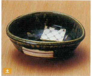
02404-519 織部格子たわみ預け鉢 4,500円 40入 (19×16×6.8cm)