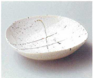
02408-299 オアシス平鉢 2,300円 40入 (18.3×4.8cm)