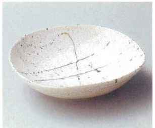
02408-299 オアシス平鉢 2,300円 40入 (18.3×4.8cm)