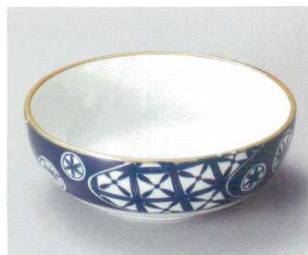
02417-179 ネジリ祥瑞6.5ボール 1,100円 (19.5×7.3cm)