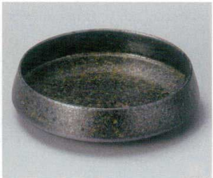
02407-139 黒唐津くくり鉢(大) 3,550円 30入 (19×5.2cm)