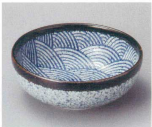
02415-179 青海波6.5ボール 1,100円 (19.5×7.3cm)