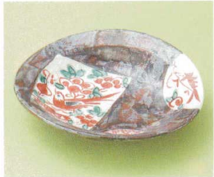
02401-519 鼠志野赤彩おでん皿 5,800円 40入 (19×18.5×4.3cm)