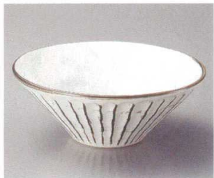
02414-409 錆粉引しのぎ深鉢(大) 1,750円 30入 (18.6×7cm)