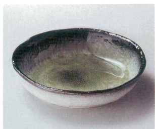
02419-459 御深井貫入6寸盛鉢 1,300円 40入 (19×4.3cm)