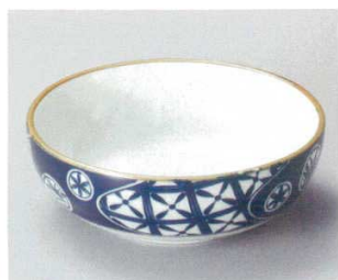
02417-179 ネジリ祥瑞6.5ボール 1,100円 (19.5×7.3cm)