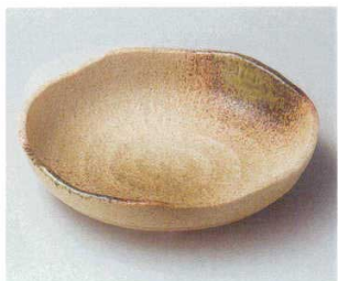
02410-559 伊賀織部ろくへ型6.5寸ポウル 2,600円 30入 (19.4×4.3cm)