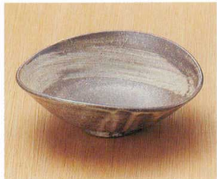
02405-669 灰釉刷毛目楕円鉢(信楽焼) 4,200円 40入 (18.5×16.5×6cm)