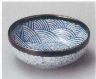
02415-179 青海波6.5ボール 1,100円 (19.5×7.3cm)