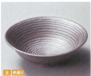
02411-109 焼しめボール 大 2,200円 30入 (19.5×6.8cm)