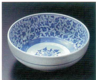
02418-199 古伊万里唐草6.0鉢 1,300円 40入 (19×7cm)