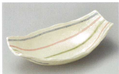
25610-299 三色線舟型鉢 4,100円 30入(22.8×12.4×6.3cm)