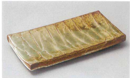
25604-669 ピード口錆8.0長角皿 6,800円 (24×10×2.8cm)