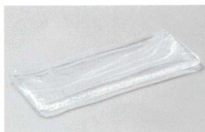
25608-279 水墨長角皿(小)白 4,700円 32入(24×10×1.1cm)※ガラス