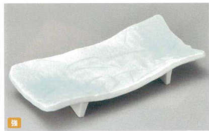
25613-559 青白磁9.0まな板焼物皿 3,740円 20入(24.8×11.8×3.4cm)