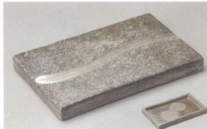
25602-669 黒窯変柊目9.1長角皿(両面使用可)(信楽焼) 7,000円 10入(27.5×17×2.7cm) 25603-669 黒窯変柊目9.0長角皿(両面使用可)(信楽焼) 5,300円 16入(27×12×2.8cm)