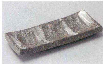
25606-669 黒窯変錆8.0長角皿 6,000円 (24×10×2.8cm)