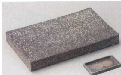
25601-669 黒窯変金ちらし7.6長角皿(両面使用可) 8,500円 (23×13.5×3cm)