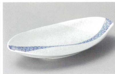
25612-739 波絵光彩ラスタ-多用皿(有田焼) 3,900円 5入(26×14×4.3cm)