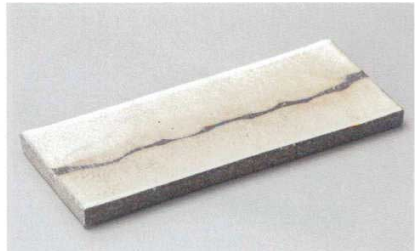
25607-669 白化粧掛分け7.6長角皿 4,400円 (23×10×1.8cm)