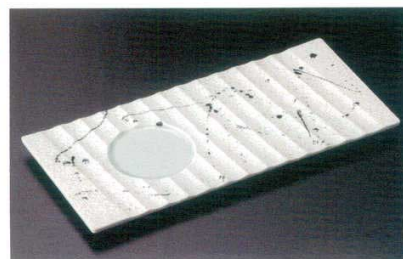
25614-139 黒飛ばしラスタ-青磁長角前菜皿 3,600円 30入(26.8×12.4×1.5cm)