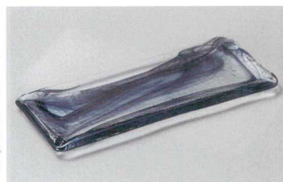
25609-279 水墨長角皿(小)黒 4,700円 32入(24×10×1.1cm)※ガラス