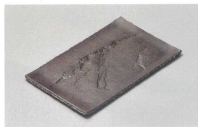
25611-179 炭化土石目半切長角皿(小) 3,900円 (27.5×17×2cm)