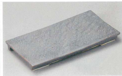
25616-179 ジワ鉄まな板口変り皿 3,100円 (25×12.5×2.5cm)