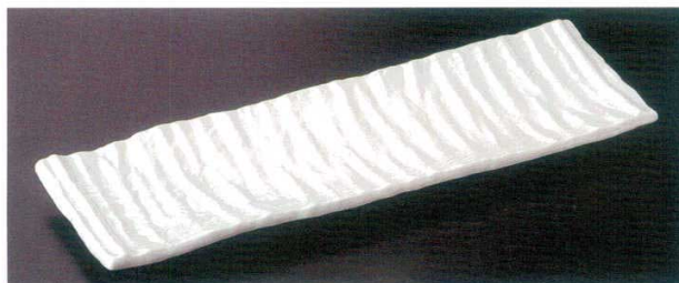
26409-139 白マット長皿 1,200円 30入 (33.5×10.8×2.3cm)