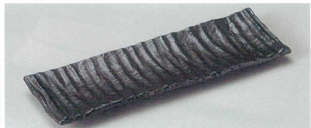
26410-139 黒いぶし長皿 1,200円 30入 (33.5×10.8×2.3cm)