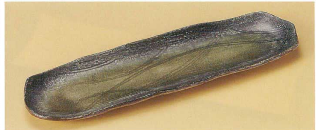
26408-459 御深井貫入書き落し突出皿 1,200円 60入 (33.5×10×2cm)