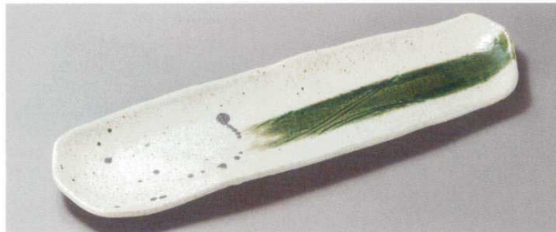
26407-109 いなか道櫛目長皿 1,150円 50入 (33.4×10×2.3cm)