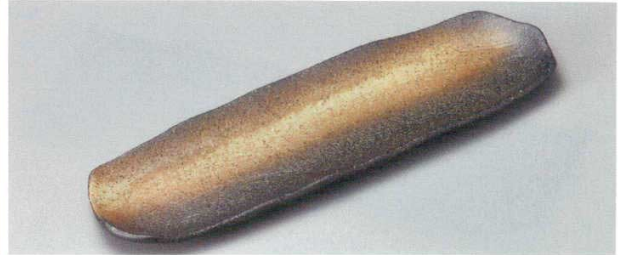
26402-469 黒備前変形長皿 1,300円 40入 (33.3×10×1.7cm)