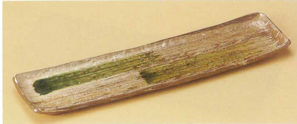
26401-319 黄瀬戸オリベ石目さんま皿 1,700円 60入 (38.3×10.2×2cm)