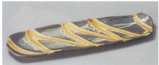
26406-109 乱線白流し櫛目長皿 1,200円 50入 (33.5×10×2cm)