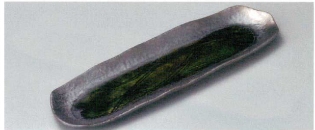
26404-469 金結晶織部流し変形長皿 1,300円 40入 (33.3×10×1.7cm)