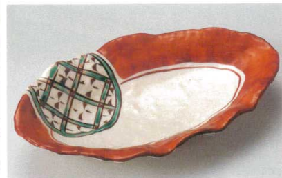
27409-189 緑格子花型楕円皿 4,200円 30入 (26.7×16.2×4.8cm)