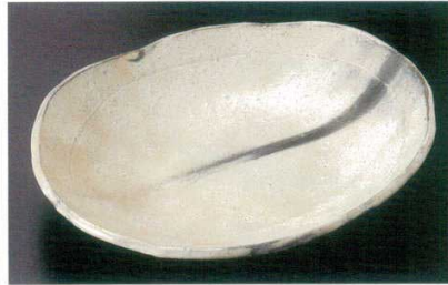
27403-669 白化粧ぼかし楕円浅鉢(信楽焼) 6,600円 20入 (25×21×4.5cm)