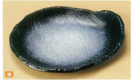
27404-559 雲海9.0変形皿 5,300円 20入 (28×24.5×3.5cm) 27405-559 雲海7.0変形皿 2,270円 40入 (21×18×2.5cm)