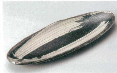
27406-669 刷毛目付出血(信楽焼) 4,300円 40入 (28.5×12×2.5cm)