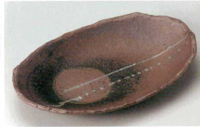
27407-669 炭化ボタモチ9.6楕円皿(信楽焼) 4,300円 25入 (29×20×5cm)