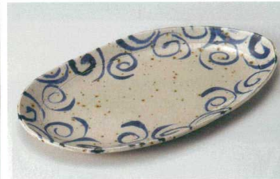
27413-669 呉須9.6楕円皿(信楽焼) 3,800円 40入 (29×17×2cm)