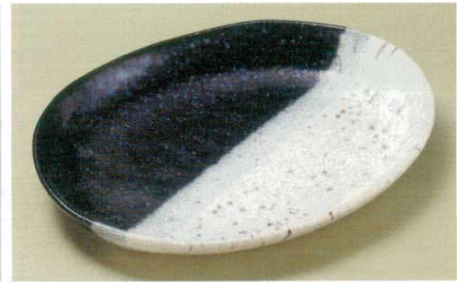
27411-549 流星9.0夕円皿 3,700円 20入 (26.5×20×3.5cm)