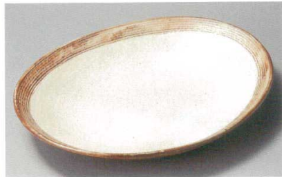
27401-669 瀏荒横彫楕円皿(大) 5,750円 (27.4×21.5×4.3cm) 27402-669 瀏荒横彫楕円皿(中) 5,000円 (25.6×17×4.5cm)