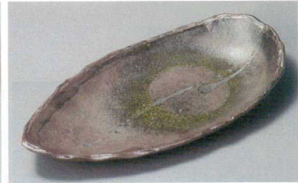
27414-669 炭化ボタモチ10.0変形皿 3,800円 (31×16.5×4cm)