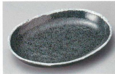
27410-549 青唐津9.0夕円皿 3,700円 20入 (26.5×20×3.5cm)