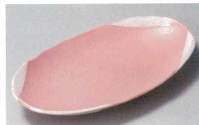
27415-269 薫麦ピンク楕円盛鉢 3,600円 20入 (32×18.2×4.2cm)