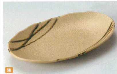
27412-589 伊賀織部筋10.0多用皿 3,640円 30入 (30×17.2×3.5cm)