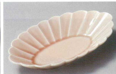
27416-259 紅ガラス菊型楕円皿 3,250円 60入 (24.5×13.7×4.5cm)