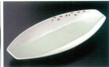
27417-179 ヒワ釉ラスター両上り9寸皿 3,300円 30入 (28×13×3cm)