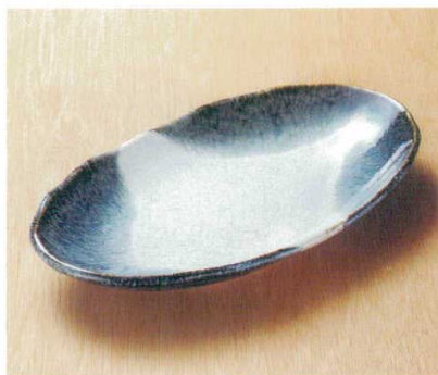
02807-269 青霞楕円盛鉢 3,600円 20入 (32×18.2×4.2cm)