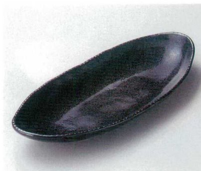
02810-199 黒結晶楕円長盛鉢 2,100円 40入 (33×14×4cm)