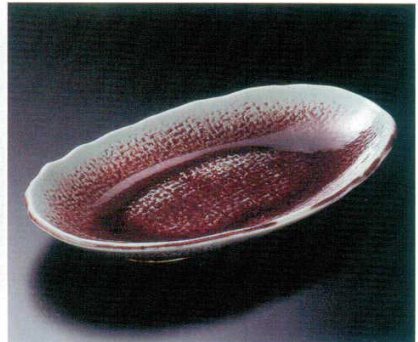
02803-269 辰砂楕円盛皿 4,000円 20入 (32×18.2×4.2cm)