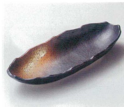
02811-579 黒備前風33cm舟型長皿 2,700円 10入 (32.5×13.3×4.5cm)