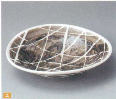
02801-519 雪志野格子あみ笠鉢 9,500円 30入 (25×23.5×6cm)