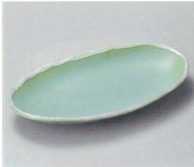
02802-269 深海マット楕円盛鉢 4,000円 20入 (32×18.2×4.2cm)