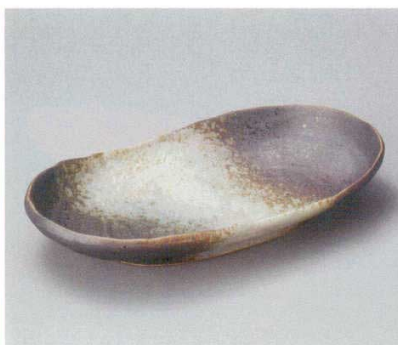
02805-659 備前風小判多用皿(萬古焼) 3,950円 15入 (32.5×18.5×5.5cm)