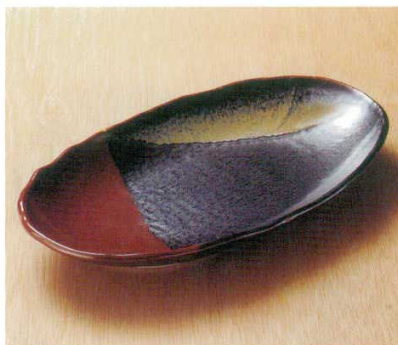
02808-269 トリプル楕円盛皿 3,600円 20入 (32×18.2×4.2cm)