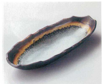
02812-109 あかね舟型鉢 1,700円 30入 (32.5×13×4.8cm)