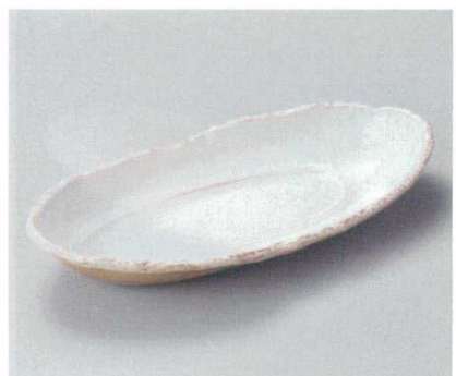
02806-449 窯変彩袖長盛皿 3,600円 30入 (32×16×5.5cm)