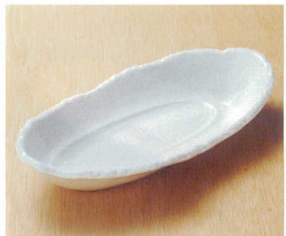
02809-029 白シェル長盛皿 2,850円 20入 (32×15×5.3cm)