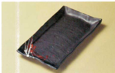
28507-239 潮 串目長角大皿 2,100円 20入 (31.5×17×2.6cm)