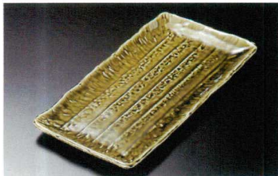
28504-259 織部アジアンホッケ皿 1,950円 40入 (33×17×2cm)