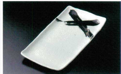
28506-199 白釉黒刷毛ほっけ皿 2,000円 30入 (33.7×17.2×2.7cm)