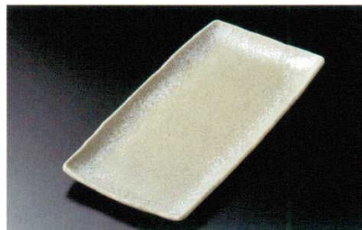
28511-279 淡雪白ほっけ皿 1,800円 24入 (33.8×15.5×2.5cm)