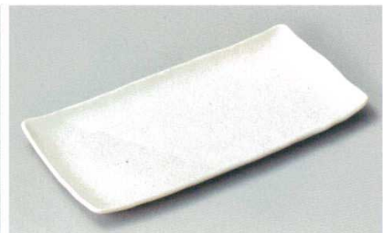
28512-319 小倉粉引ホッケ皿 1,800円 20入 (34×18×2.8cm)