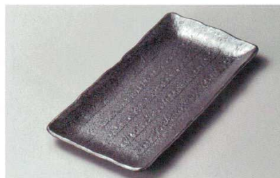
28514-239 黒長角ホッケ皿 1,750円 24入 (33×16.5×3cm)