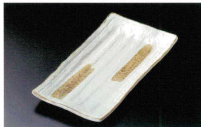
28508-559 茶刷毛ホッケ皿 1,650円 30入 (30×15.5×2.5cm)