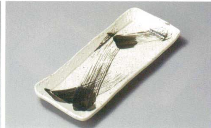
28503-479 黒刷毛石目焼物皿 2,000円 25入 (33.5×14.5×3.5cm)