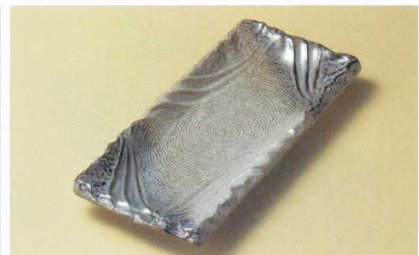
28509-649 淡雪ホッケ皿(萬古焼) 1,600円 24入 (32×15×3.5cm)