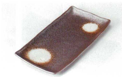
28513-319 黒水晶ホッケ皿 1,800円 30入 (34×17.5×2.3cm)