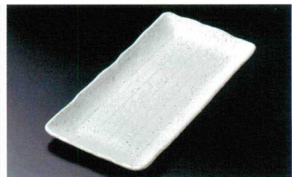
28515-239 うのふホッケ皿 1,750円 24入 (33×16.5×3cm)