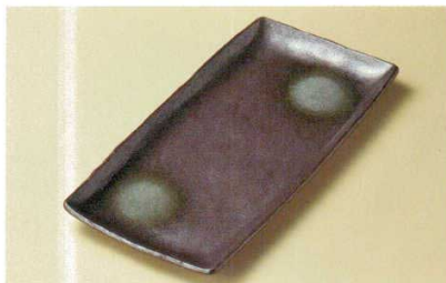
28510-279 鉄砂ほっけ皿 1,800円 24入 (33.8×15.5×2.5cm)