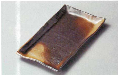
28501-309 黒備前吹楯目長角盛皿 2,300円 10入 (31×16.7×3cm)