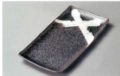
28505-199 黒釉白刷毛ほっけ皿 2,000円 30入 (33.7×17.2×2.7cm)