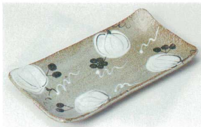
28813-559 山帰来焼物皿 2,500円 40入 (25.5×14×2.8cm)