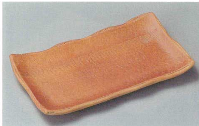
28806-669 火色8.0長方皿(信楽焼) 2,900円 30入 (25×14×2.5cm) 28807-669 火色7.0長方皿(信楽焼) 2,480円 50入 (21×12×2cm) 28808-669 火色6.0長方皿(信楽焼) 1,650円 90入 (19×11×2cm)