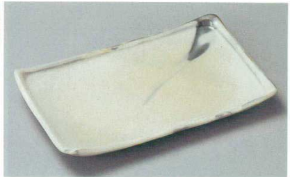
28804-669 白化粧ほかし8.0焼物皿(信楽焼) 3,220円 30入 (24×15×2.5cm)