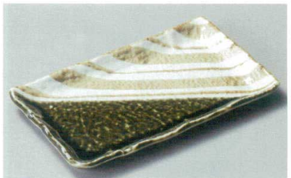
28817-559 織部ストライプ9.0長角皿 2,450円 20入 (26.5×15.9×2.5cm)