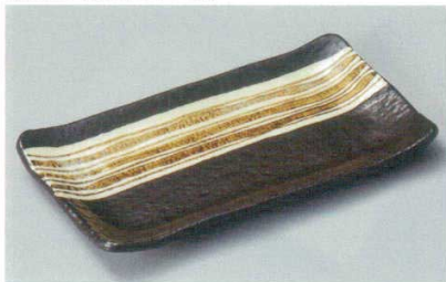
28811-589 ゆず黒錆十草焼物皿 2,690円 60入 (25.5×14.5×2.8cm)