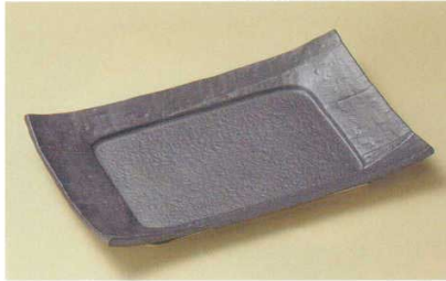
28801-249 いぶし黒9.0寸長角四方皿 3,200円 30入 (27.8×17.2×4.1cm) 28802-249 いぶし黒7.5寸長角四方皿 2,150円 40入 (22.7×13.7×3.5cm)