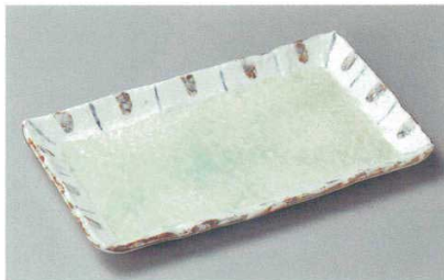
28810-559 ヒワ釉測十草9.0長角皿 2,480円 20入 (27×16.4×2.2cm)