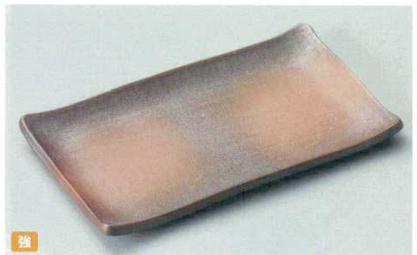
28809-559 黒彩長角尺皿 3,050円 30入 (27.2×16×2.5cm)