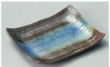
28820-199 黒青吹ソギ長角盛皿 2,300円 30入 (26×21×3cm)