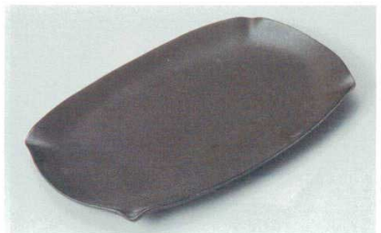
28812-409 そよかぜ黒鉄25cm長角皿 2,400円 30入 (25×15×2.4cm)