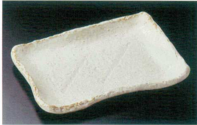
28803-029 桃山27cm長皿 3,300円 20入 (27×19×3cm)