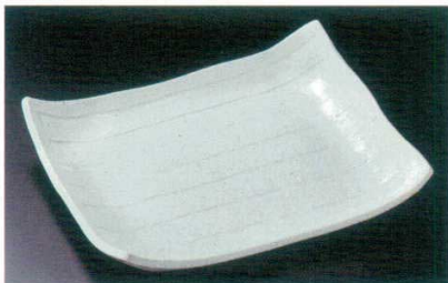
28819-199 白釉ソギ長角盛皿 2,300円 30入 (26×21×3cm)