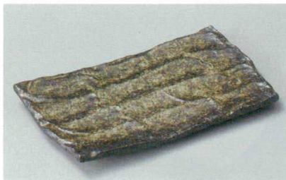
28818-179 黒唐津結晶削ぎ彫中皿 2,350円 (24.5×14.5×2.5cm)