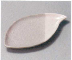
29804-269 ピンク志野しずく焼物皿 1,000円 60入 (22.3×12.7×1.9cm)