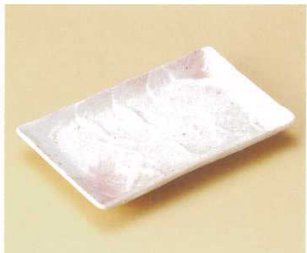
29809-039 桜志野7.0皿 1,280円 40入 (20.5×13×2.5cm)