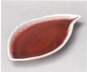
29803-269 辰砂しずく焼物皿 1,250円 60入 (22.3×12.7×1.9cm)