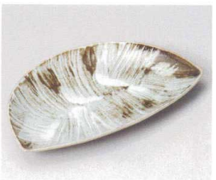
29808-479 荒刷毛目半月多用皿 1,250円 40入 (24.8×15.6×2.6cm)