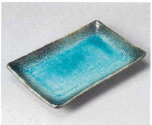
29817-299 藍染スカイ角焼物皿 1,150円 40入 (21.8×14.6×2.7cm)