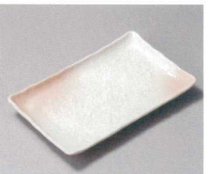
29820-459 あげほの庵焼物皿 1,050円 40入 (22.2×13.7×2.7cm)