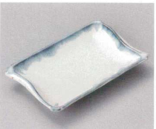
29815-269 青霞竹型焼物皿 1,200円 50入 (19.6×12.8×2.8cm)