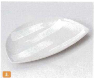
29807-469 粉引刷毛半月焼物皿 1,280円 48入 (24.8×15.6×2.8cm)