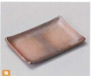
29811-559 黒彩長角7.0皿 1,600円 50入 (18.7×12.8×2.3cm)