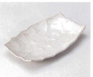
29816-319 手折粉引焼物皿 1,160円 60入 (23×15×3cm)