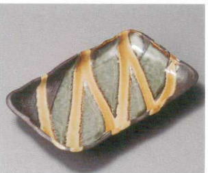
29819-109 乱線白流し焼物皿 1,100円 40入 (20.4×14.3×3.3cm)