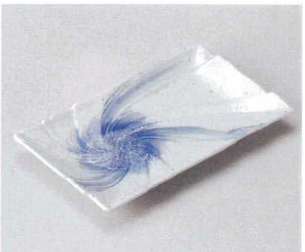
29814-149 星雲焼物皿 1,200円 40入 (23×14×2.3cm)