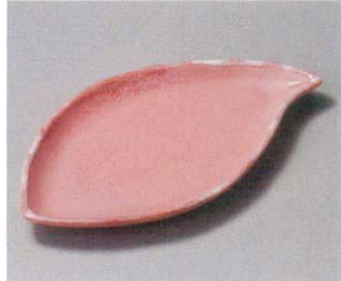
29801-269 窯変ピンクしずく焼物皿 1,200円 60入 (22.3×12.7×1.9cm)