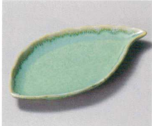
29802-269 深海マットしずく焼物皿 1,250円 60入 (22.3×12.7×1.9cm)