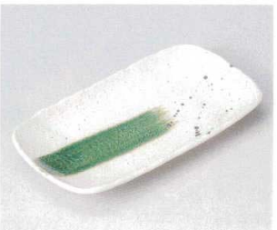
29818-109 いなか道小判焼物皿 1,100円 50入 (24×13.3×2.8cm)