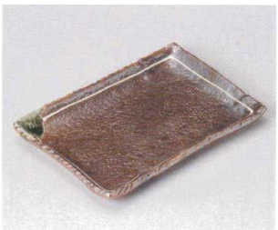
29810-579 鉄軸ライン7寸長角皿 1,400円 40入 (20.5×14×2cm)