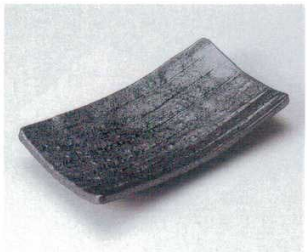
29813-239 黒四足焼物皿 1,500円 30入 (22×12×3.5cm)