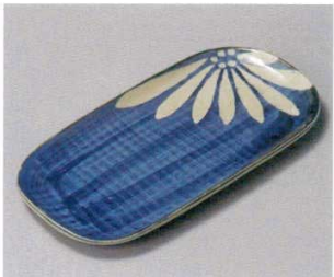
29806-579 菊花布目トジメ長皿 1,300円 60入 (21×11.8×1.6cm)