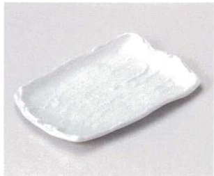
29805-029 白荒削ぎ22cm焼物皿 1,400円 30入 (22×15×2cm)