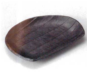
30314-209 黒備前半月皿(大) 950円 40入 (22×16.3×2cm)