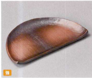
30301-559 黒彩半月8.0皿 2,300円 50入 (24.5×14.5×2.3cm)