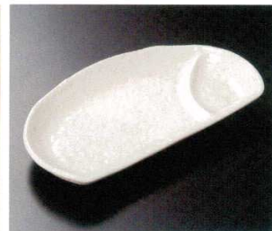
30309-189 白志野半月仕切皿 1,200円 40入 (23.8×12.8×2.7cm)