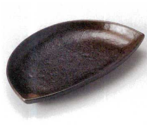
30305-139 黒渋半月皿 1,350円 40入 (23.5×13.8×3cm)