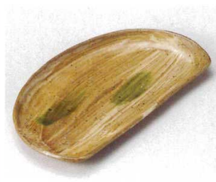
30316-319 黄瀬戸オリベ半月焼物皿 910円 60入 (24×13.5×1.4cm)