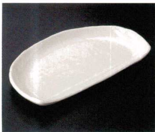
30310-029 白粉引半月焼物皿 1,200円 50入 (22×13×2.2cm)