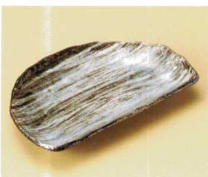
30318-039 白刷目半月皿 720円 60入 (21×13.5×3cm)