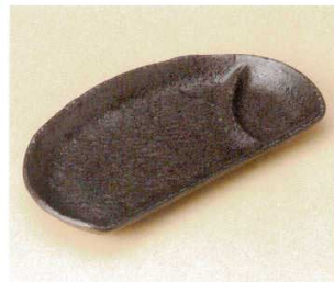
30308-189 ゆず黒半月仕切皿 1,200円 40入 (23.8×12.8×2.7cm)