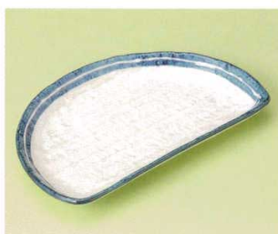
30319-579 一珍測ライン半月皿 740円 60入 (21×13.2×2.5cm)