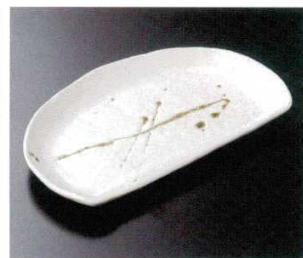
30313-239 筆流 半月焼皿白 950円 80入 (22×13×2cm)