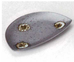
30306-479 南蛮吹半月焼物皿 1,100円 50入 (25.3×15.7×2.5cm) 30307-479 南蛮吹半月銘々皿 850円 100入 (18×11.6×2cm)