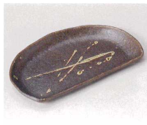
30312-239 筆流 半月焼皿茶 950円 80入 (22×13×2cm)