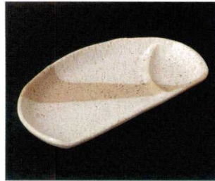
30302-459 白化粧塗分半月仕切皿 1,280円 50入 (23.5×12.5×3cm)