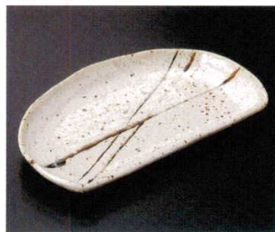
30311-459 半月アメハケ焼物皿 1,050円 80入 (21.5×12.7×2.4cm)