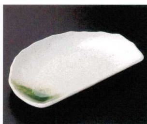
30320-199 若草半月焼物皿 700円 60入 (21×13×2.5cm)