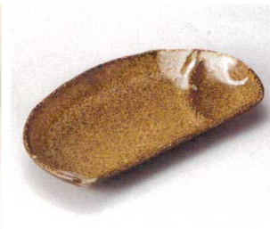
30304-459 黄河半月仕切皿 1,280円 40入 (24×13×2.8cm)