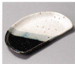
30317-239 めり分半月焼物皿 950円 60入 (22×13×2cm)