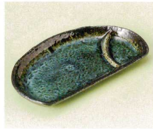
30303-189 ゆず黒銀河半月仕切皿 1,250円 40入 (23.8×12.8×2.7cm)