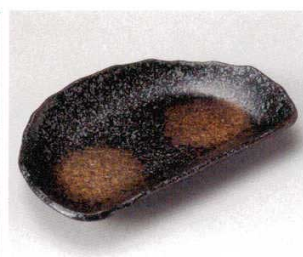
30321-029 黒油滴半月皿 550円 50入 (21×13.2×2.5cm)