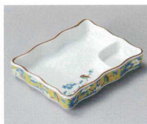
30422-109 黄花鳥ミニ仕切皿 1,250円 50人 (15.5×12×2.8cm)