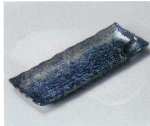
30425-239 仕切皿ルリ焼物皿 1,300円 40人 (31.3×12×3cm)