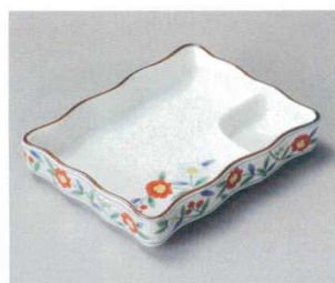
30423-109 銀彩ミニ仕切皿 1,250円 50人 (15.5×12×2.8cm)