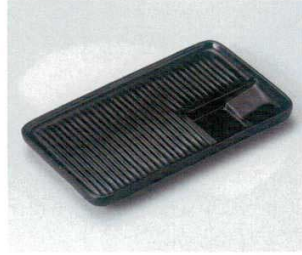
30419-319 いぶし天目ななめ皿(中) 1,200円 38人 (21.7×12.3×2cm)