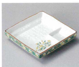
30421-109 緑彩正角仕切皿 1,350円 50人 (14.8×14.5×3cm)