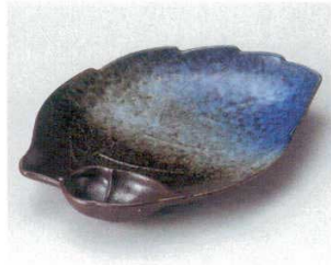
30410-469 森の湖木の葉型栃仕切皿 1,850円 40人 (23.8×17×3.5cm)