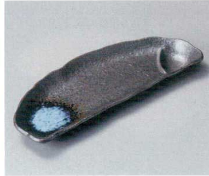
30416-059 青吹き半月仕切皿 1,500円 (30.5×12×2.8cm)