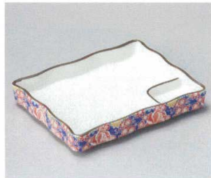
30414-319 四季友禅長角仕切皿(大) 1,500円 30人 (17.5×14×3cm) 30415-319 四季友禅長角仕切皿(小) 1,200円 50人 (14.5×11.7×3cm)