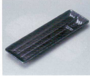
30418-459 長角仕切皿黒 1,200円 60人 (33×10×2.5cm)