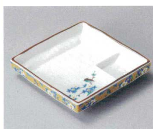
30420-109 黄花鳥正角仕切皿 1,350円 50人 (14.8×14.5×3cm)