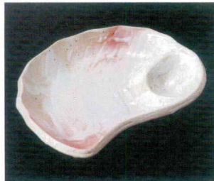
30413-039 桜志野貝型仕切皿 1,600円 30人 (23×17×4cm)