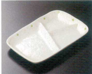
30404-519 ドットグリーン仕切ランチプレート 1,900円 30人 (27.5×18.4×2.6cm) 30405-519 ドットグリーン仕切ヘルシープレート 1,300円 40人 (22×14.8×2.2cm) 30406-519 ドットグリーン仕切皿 850円 60人 (18×11.7×2cm)