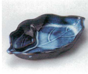
30417-059 清流木の葉仕切皿 1,300円 40人 (21.5×13.2×3cm)