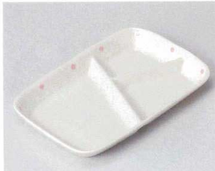
30401-519 ドットピンク仕切ランチプレート 1,900円 40人 (27.5×18.4×2.6cm) 30402-519 ドットピンク仕切ヘルシープレート 1,300円 40人 (22×14.8×2.2cm) 30403-519 ドットピンク仕切皿 850円 60人 (18×11.7×2cm)