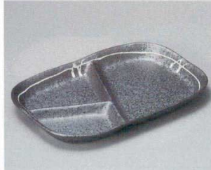
30407-519 黒仕切ランチプレート 1,900円 30人 (27.5×18.4×2.6cm) 30408-519 黒仕切ヘルシープレート 1,300円 40人 (22×14.8×2.2cm) 30409-519 黒仕切皿 850円 60人 (18×11.7×2cm)