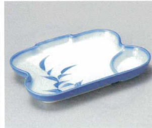
30426-189 笹ひさご仕切皿 1,200円 30人 (22×15×3cm)