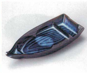
30412-059 清流舟型仕切皿 1,700円 30人 (26×11.5×4.6cm)