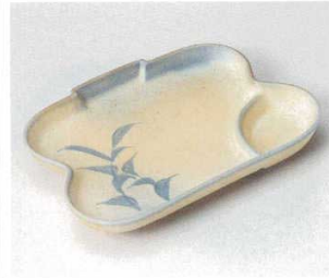
30427-149 梨地ひさご型仕切付皿 1,100円 40人 (22×15×3cm)