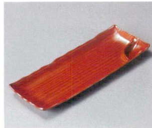
30424-239 仕切皿 赤焼物皿 1,300円 40人 (31.3×12×3cm)