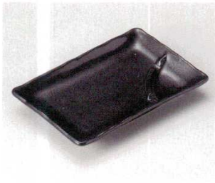
30515-139 いぶし黒波紋仕切付串皿 950円 80入 (16.8×10.1×1.2cm)