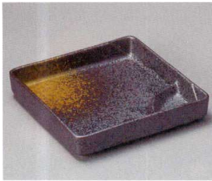
30501-029 伊賀天目仕切皿(大) 1,180円 40入 (16.5×16.5×3cm)