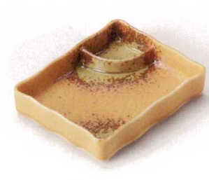
30517-029 伊賀仕切付皿 650円 60入 (14.8×11.7×3cm)