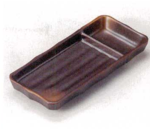
30503-459 焼が突出仕切皿 1,100円 50入 (20.6×9.4×2.4cm)