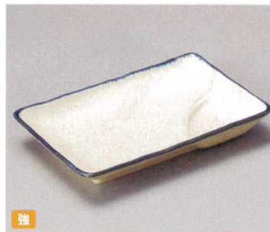
30507-589 黄瀬戸6.0長角仕切皿 1,000円 60入 (17.3×11.6×2cm)