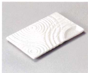
30511-139 粉引釉波紋仕切付焼物皿 1,050円 36入 (21.2×13.4×1.5cm)