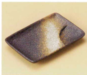
30513-589 京備前6.0仕切皿 810円 60入 (17.5×11.9×2.1cm)