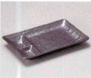
30519-179 いぶし黒仕切皿 800円 (21×13.3×2.5cm)