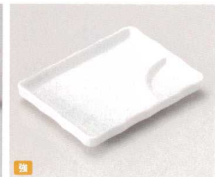
30508-459 白磁5.5長角仕切り皿 900円 120入 (13.6×10.4×2cm)