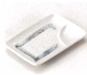
30521-549 オフケ6号長角仕切皿 600円 60入 (17.8×11.8×2cm)