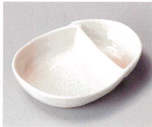
30516-029 桃吹き仕切鉢 700円 60入 (17×13×3cm)