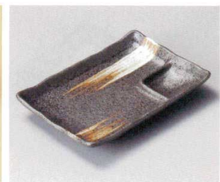
30514-239 白刷毛天目仕切串皿 950円 80入 (17×12×2.5cm)