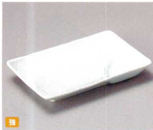
30505-559 青白磁6.0長角仕切皿 980円 (17.3×11.6×2.7cm)