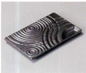
30509-139 いぶし黒波紋仕切付焼物皿 1,050円 36入 (21.2×13.4×1.5cm)