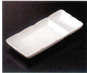
30502-579 無地白釉仕切付長皿 1,200円 80入 (20.7×9.3×2.8cm)