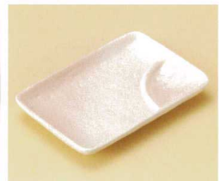
30522-549 桜志野6号長角仕切皿 600円 60入 (17.6×12×2cm)