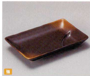
30506-559 やぎしめ6.0長角仕切皿 980円 (17.3×11.6×2.7cm)