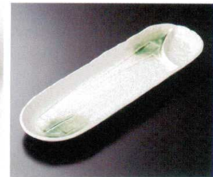
30504-059 粉引楕円仕切り皿 1,000円 42入 (32.8×10.5×2.3cm)