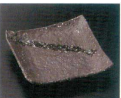
31621-409 基星石目角取皿 850円 60入 (13×13×3cm)