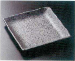
31605-239 黒四角皿 1,100円 50入 (16.5×2cm)