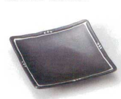
31622-559 一珍黒マット3.0正角皿 830円 120入 (12.2×12.2×2.2cm)