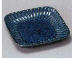
31607-239 窯変しのぎ四角取皿 1,000円 80入 (15.8×2.6cm)