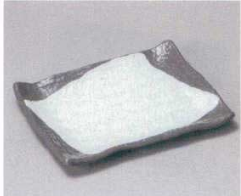
31613-549 アッシュターク長角銘々皿 950円 80入 (15.5×12×1.5cm)