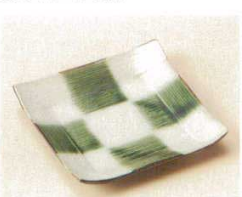
31626-459 織部市松角銘々皿 790円 80入 (11.8×2cm)