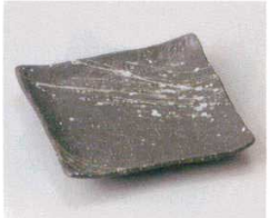
31614-279 吹雪石目5.0正角皿 950円 50入 (15×15×3cm) 31615-279 吹雪石目4.3正角皿 850円 80入 (13×13×3cm)