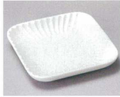
31606-239 白しのぎ四角取皿 1,000円 80入 (15.8×2.6cm)