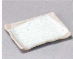
31611-549 アッシュライト長角銘々皿 950円 80入 (15.5×12×1.5cm)