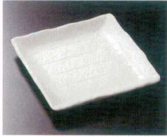
31603-239 粉引四角皿 1,100円 50入 (16.5×2cm)