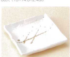
31629-239 筆流串目取皿白 950円 60入 (14.5×13.5×2.2cm)