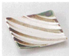
31617-559 織部志野ストライプ3.0正角皿 880円 120入 (12.2×12.2×2.2cm)