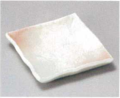
31610-239 ピンク吹くしめ角取皿 880円 60入 (14.5×13.5×2.2cm)