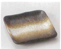
31620-589 京備前正角中皿 810円 100入 (13.9×13.9×2cm)