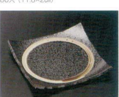
31631-239 わ角ちぎり皿(黒) 950円 60入 (14.5×14.3×2.2cm)