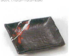
31630-239 潮 串目角取皿 950円 60入 (14.5×13.5×2.2cm)