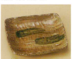
31625-319 黄瀬戸オリベ四角取皿 790円 90入 (15.5×15.5×2cm)