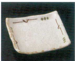
31619-549 織部結び4.0正角銘々皿 820円 80入 (12×12×2.3cm)