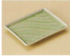
31602-559 ヒワ貫入銘々皿 980円 100入 (15×11.5×2cm)