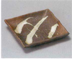
31608-239 なまこ流し角取皿 880円 60入 (14.5×13.5×2.2cm)