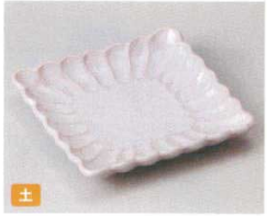
31604-319 ピンクうのふ菊華角取皿 910円 80入 (15.1×15.1×2.6cm)