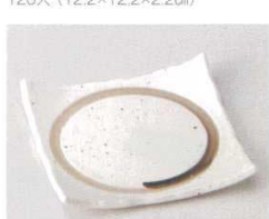
31627-239 わ角ちぎり皿(白) 950円 60入 (14.5×14.3×2.2cm)