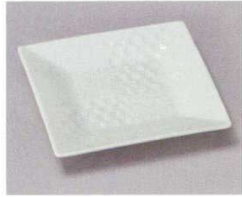
31601-459 青白磁市松銘々皿 850円 80入 (14×2cm)