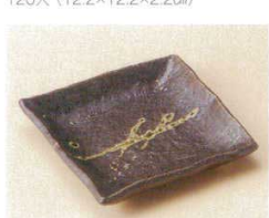
31628-239 筆流串目取皿茶 950円 60入 (14.5×13.5×2.2cm)