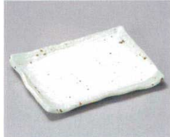
31612-549 アッシュグリーン長角銘々皿 950円 80入 (15.5×12×1.5cm)