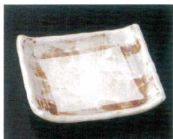
31618-549 志野タタキ4.0角皿 820円 60入 (12.5×12.5×2cm)