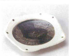
31624-109 和黒ちぎり型 取皿 800円 80入 (16×14.8×2.4cm)