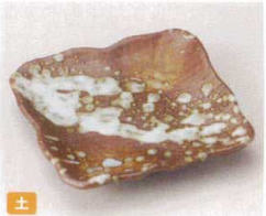
31616-239 備前白四足角皿(中) 1,050円 80入 (15×14.5×3cm)