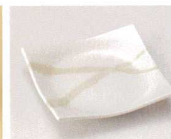
31731-579 白湧水4.5正角皿 430円 90入 (13.7×13.7×3cm)