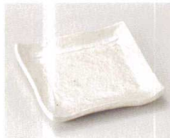
31717-459 白釉正角銘々皿 690円 80入 (12.5×2.2cm)