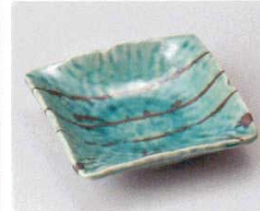
31715-109 緑彩金散らし縄文正角小皿 660円 80入 (11×3cm)