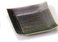
31711-199 織部こヨリ取皿 750円 100入 (12×12×2cm)