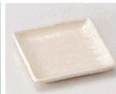
31725-589 白志野銘々皿 560円 100入 (12×12×1.5cm)