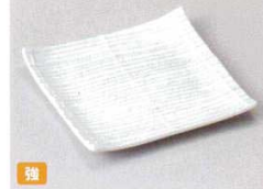
31709-579 青磁スタレ正角銘々皿 750円 100入 (11.7×11.7×1.6cm)