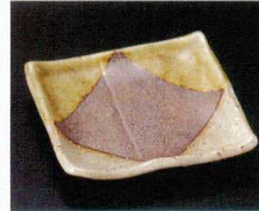
31704-269 信楽正角銘々皿 700円 80入 (13.4×13.4×2.3cm)