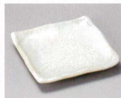
31723-269 窯変グレー正角銘々皿 600円 60入 (13.5×13.5×2cm)