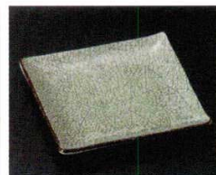
31724-269 墨貫入正角銘々皿 600円 80入 (12.8×12.8×1.5cm)