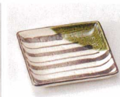
31726-579 織部十草四角皿 550円 120入 (12.3×12.3×1.8cm)