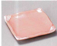
31712-269 窯変ピンク正角銘々皿 700円 60入 (13.5×13.5×2cm)