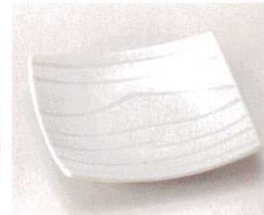
31720-239 青白ライン4.0角皿 780円 100入 (13.5×13.5×2.6cm)