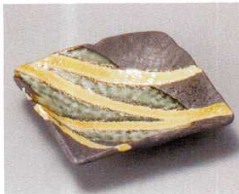
31701-109 乱線白流し縄文小皿 760円 120入 (11×11×3cm)