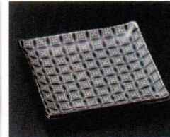
31721-269 七宝正角銘々皿 600円 80入 (12.8×12.8×1.5cm)