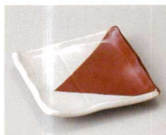
31722-269 赤楽正角銘々皿 600円 80入 (13.4×13.4×2.3cm)