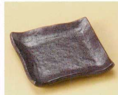
31718-459 黒釉正角銘々皿 690円 80入 (12.5×2.2cm)