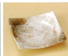
31730-179 雪志野正角4.5皿 460円 120入 (13.7×3.2cm)