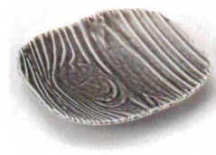
31707-109 黒屋久島木目形 取皿 710円 80入 (15×13.8×2cm)