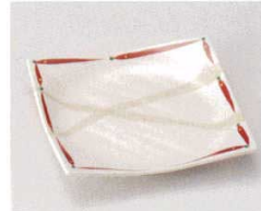
31714-579 赤絵湧水4.5正角皿 700円 90入 (13.7×13.7×3cm)