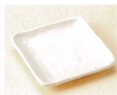
31728-579 粉引 正角中皿 620円 80入 (13.8×13.8×2.7cm)