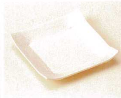
31702-469 乙よりパール取皿 740円 80入 (12×12×1.8cm)