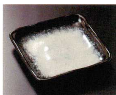
31727-579 雲竜 正角中皿 620円 80入 (13.8×13.8×2.7cm)