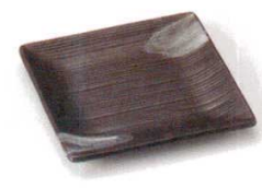
31706-579 白雲正角フルーツ皿 780円 66入 (15.3×15.3×1.8cm)