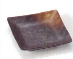
31719-029 金茶吹12cm正角皿 650円 60入 (12.5×12.5×2.6cm)