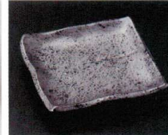
31716-269 銀彩結晶正角銘々皿 660円 80入 (13.5×13.5×2cm)