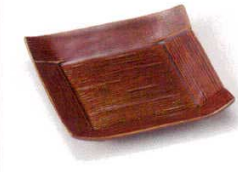
31710-199 あめこヨリ取皿 750円 79入 (12×12×2cm)