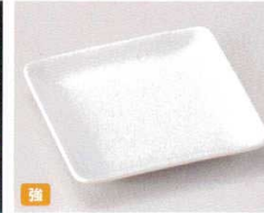
31705-579 白磁正角取皿 830円 125入 (11.8×11.8×2.3cm)