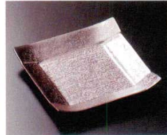
31703-469 乙よりシルバー取皿 740円 80入 (12×12×1.8cm)