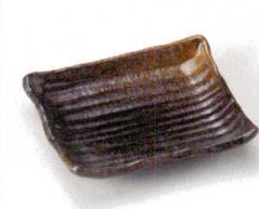
31713-649 琥珀角銘々皿(萬古焼) 750円 80入 (13.5×12×3cm)