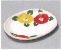
32007-669 火色4.0丸皿(信楽焼) 1,000円 120入 (12×2cm)