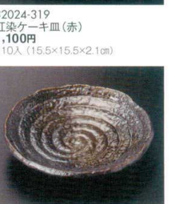
32030-559 新緑丸4.0皿 1,080円 80入 (14×2.3cm)