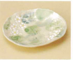
32004-519 華清水銘々皿 1,300円 60入 (16×14.2×2cm)