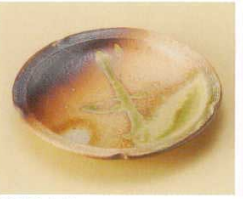
32009-449 粉引山水4.0皿 1,300円 120入 (13.8×2.5cm)