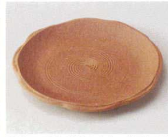
32006-669 火色5.0丸皿(信楽焼) 1,350円 70入 (15×2cm)