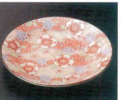
32025-519 花ごころ銘々皿 1,100円 60入 (16×14.2×2cm)