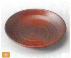
32023-109 織部トトリ拵入り48皿 1,100円 50入 (16×3cm)