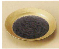
32001-439 黒潮5.0皿 1,400円 60入 (16.3×2.5cm)