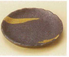
32010-669 古信楽5.0丸皿(信楽焼) 1,500円 70入 (15.2×2cm)