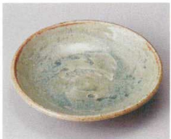
32022-309 炭火烧4.0皿 990円 100入 (13.2×2cm)