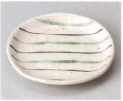
32003-559 二色ストライプフルーツ皿 1,250円 60入 (16.2×2.5cm)