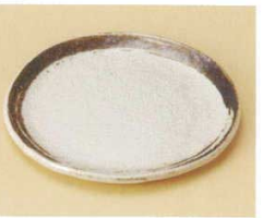
32005-669 鉄刷毛目5.0丸皿(信楽焼) 1,350円 100入 (15×2cm)