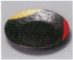
32002-459 黒耀三色金彩5寸皿 1,350円 60入 (15.2×2.4cm)