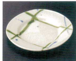
32021-309 炭火烧5.0皿 1,100円 100入 (15.2×2.5cm)