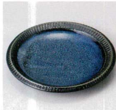
33116-109 深海淵十草型40皿 460円 100入 (14×2cm) 33117-109 深海淵十草型小皿 410円 150入 (11×2cm)