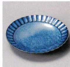
33136-199 窯変紺ソギ5.0皿 450円 100入 (16.5×3cm) 33137-199 窯変紺ソギ4.0皿 400円 150入 (13.5×2.5cm) 33138-199 窯変紺ソギ3.0皿 350円 200入 (10×2cm)