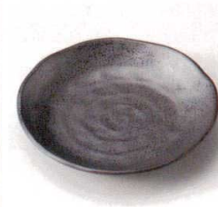
33121-179 いぶし鉄黒5.0皿 450円 80入 (16.7×3.2cm) 33122-179 いぶし鉄黒4.0皿 320円 120入 (14×2.8cm) 33123-179 いぶし鉄黒3.5皿 280円 120入 (12×2.7cm)