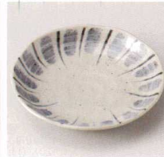
33110-189 唐津トクサ5.0皿 540円 80入 (16.7×3.2cm) 33111-189 唐津トクサ4.0皿 410円 120入 (14×2.7cm) 33112-189 唐津トクサ3.5皿 350円 160入 (12×2.7cm)