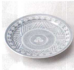
33145-319 三島リム型5.0皿 400円 100入 (16×1.9cm) 33146-319 三島リム型4.0皿 340円 120入 (13.7×1.9cm) 33147-319 三島リム型3.5皿 280円 140入 (12.3×1.9cm)