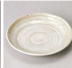
33157-189 水玉粉引うず4.0皿 380円 80入 (14×2.5cm) 33158-189 水玉粉引うず3.5皿 310円 120入 (12×2cm)