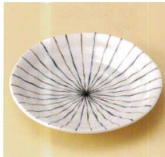
33159-109 京十草5寸皿 330円 100入 (16.5×2.6cm) 33160-109 京十草4寸皿 280円 120入 (13.7×2.5cm) 33161-109 京十草3.5寸皿 230円 150入 (12×2cm)