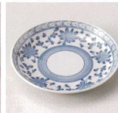
33142-179 新唐草5.0皿 400円 120入 (17×3cm) 33143-179 新唐草4.0皿 360円 140入 (14×2.7cm) 33144-179 新唐草3.5皿 290円 150入 (12×2.5cm)