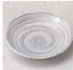
33107-189 グレー巻5.0皿 530円 80入 (16.7×3.2cm) 33108-189 グレー巻4.0皿 400円 120入 (14×2.7cm) 33109-189 グレー巻3.5皿 340円 160入 (12×2.7cm)