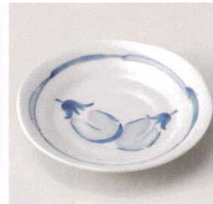
33168-209 バナス5寸皿 320円 100入 (16.4×2.7cm) 33169-209 バナス4寸皿 270円 120入 (13.7×2.4cm) 33170-209 バナス3.5寸皿 220円 160入 (12×2.2cm)