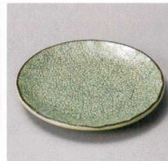
33139-269 墨貫入布目5寸皿 440円 80入 (16.3×2cm) 33140-269 墨貫入布目4寸皿 400円 100入 (14×1.7cm) 33141-269 墨貫入布目3.5寸皿 350円 150入 (11.8×1.4cm)