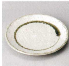
33133-469 白織部ライン丸皿(大) 460円 (16.5×2cm) 33134-469 白織部ライン丸皿(中) 400円 (14×1.7cm) 33135-469 白織部ライン丸皿(小) 360円 (12×1.4cm)