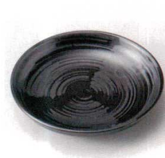
33130-139 風車(黒)16.5cm皿 440円 60入 (16.7×3.2cm) 33131-139 風車(黒)14cm皿 390円 100入 (13.8×2.8cm) 33132-139 風車(黒)12.5cm皿 300円 150入 (12.4×2.5cm)