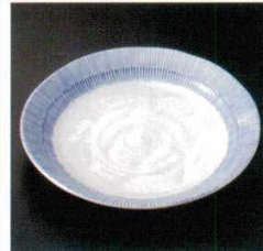
33154-209 京十草5.0皿 350円 100入 (16.5×2.4cm) 33155-209 京十草4.0皿 280円 120入 (14×2.3cm) 33156-209 京十草3.5皿 240円 160入 (12×2cm)