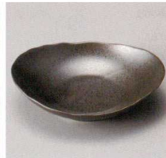
33165-579 黒茶5.0楕円深皿 500円 80入 (16×14×4cm) 33166-579 黒茶4.0楕円深皿 380円 100入 (13.5×13×3.5cm) 33167-579 黒茶3.5楕円深皿 320円 120入 (11×10×3cm)