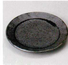
33124-469 黒織部ライン丸皿(大) 460円 (16.5×2cm) 33125-469 黒織部ライン丸皿(中) 400円 (14×1.7cm) 33126-469 黒織部ライン丸皿(小) 360円 (12×1.4cm)