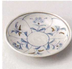
33118-189 草花5.0皿 540円 80入 (16.7×3.2cm) 33119-189 草花4.0皿 410円 120入 (14×2.7cm) 33120-189 草花3.5皿 350円 160入 (12×2.7cm)