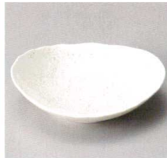
33162-579 白粉引5.0楕円深皿 500円 80入 (16×14×4cm) 33163-579 白粉引4.0楕円深皿 380円 100入 (13.5×13×3.5cm) 33164-579 白粉引3.5楕円深皿 320円 120入 (11×10×3cm)