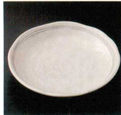
33104-209 粉引ライン5.0皿 460円 100入 (16.5×2.8cm) 33105-209 粉引ライン4.0皿 350円 120入 (14×2.5cm) 33106-209 粉引ライン3.5皿 300円 160入 (12×2.2cm)