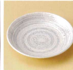
33113-199 うず粉引グレー5.0皿 450円 100入 (16×3cm) 33114-199 うず粉引グレー4.0皿 400円 150入 (13.8×2.7cm) 33115-199 うず粉引グレー3.5皿 350円 200入 (12×2.3cm)