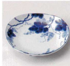
33148-179 藍染ぶどう三角5.0皿 400円 80入 (16.3×3.2cm) 33149-179 藍染ぶどう三角4.0皿 350円 100入 (13.5×2.8cm) 33150-179 藍染ぶどう三角3.5皿 300円 120入 (12×2.5cm)