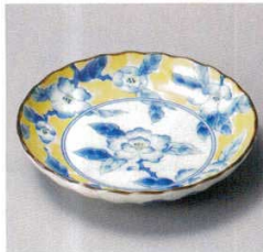
33101-319 黄彩花紋菊形5.0皿 480円 100入 (16.3×3.5cm) 33102-319 黄彩花紋菊形4.0皿 390円 120入 (13.7×3cm) 33103-319 黄彩花紋菊形3.5皿 340円 140入 (12.2×2.7cm)