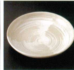
33127-139 風車(白)16.5cm皿 440円 60入 (16.7×3.2cm) 33128-139 風車(白)14cm皿 390円 100入 (13.8×2.8cm) 33129-139 風車(白)12.5cm皿 300円 150入 (12.4×2.5cm)