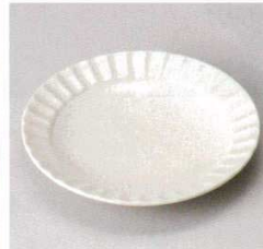
33151-109 白水晶しのぎ50皿 380円 100入 (16.5×2.7cm) 33152-109 白水晶しのぎ40皿 330円 120入 (13.8×2.2cm) 33153-109 白水晶しのぎ30皿 280円 200入 (10×2cm)