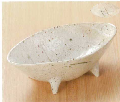
03405-239 オアシス四足大鉢 3,000円 30入 (24.7×13×7.6cm)