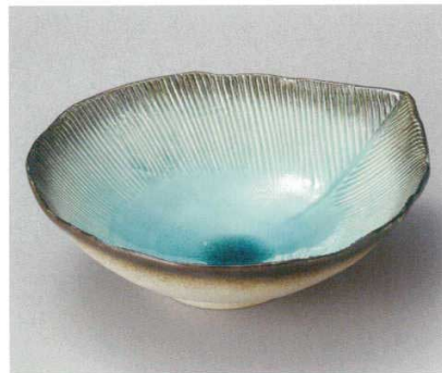
03407-109 藍染スカイ葉型8寸鉢 2,450円 30入 (24.3×22×7cm)