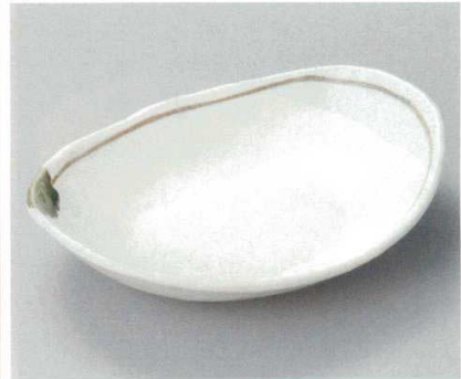
03410-519 志野ライン小判鉢 大 2,200円 30入 (24.8×19.5×6.2cm) 03411-519 志野ライン小判鉢 小 1,600円 40入 (20.5×16.5×5.2cm)