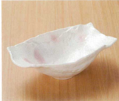
03402-149 ピンクスター舟型鉢 4,300円 30入 (24.5×15.5×7.5cm)