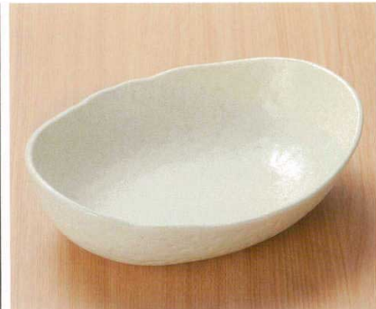
03416-109 粉引風楕円中鉢 1,650円 33入 (24×17.3×6.5cm)