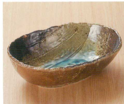
03412-179 和三彩手作り楕円鉢(大) 1,900円 24入 (24.3×16.5×8cm) 03413-179 和三彩手作り楕円鉢(小) 900円 60入 (16.5×12.3×6cm)