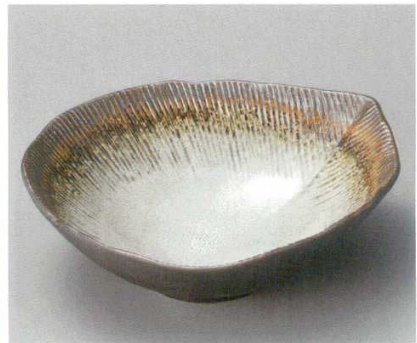
03406-109 あかね葉型8寸鉢 2,450円 30入 (24.3×22×7cm)