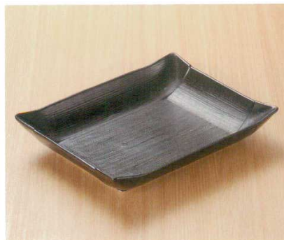
03404-469 こより(黒)盛鉢 2,900円 36入 (24.6×18.2×4.5cm)