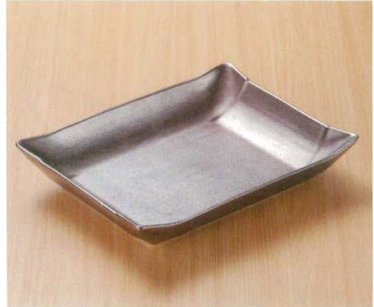
03403-469 こよりシルバー盛鉢 2,900円 36入 (24.6×18.2×4.5cm)