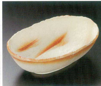
03414-029 ヒダスキ楕円鉢(大) 1,700円 20入 (24.4×16.5×7.8cm) 03415-029 ヒダスキ楕円鉢(小) 880円 40入 (16.1×12.2×6cm)