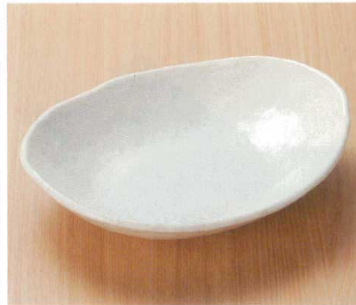
03408-519 粉引小判鉢 大 2,200円 30入 (24.7×19.5×6cm) 03409-519 粉引小判鉢 小 1,600円 40入 (20.5×16.5×5.2cm)