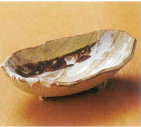
03816-309 茶布目流水刺身鉢 1,200円 50入(20.5×12×6cm)