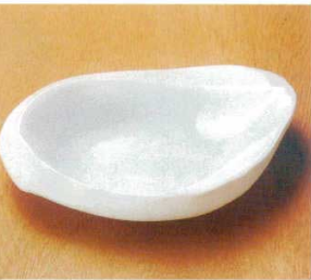
03808-179 青白磁6.5寸皿 2,500円 30入(20×16.3×3.6cm)