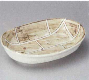
03820-189 クラフト楕円鉢 1,150円 30入(20.7×15.4×5.3cm)