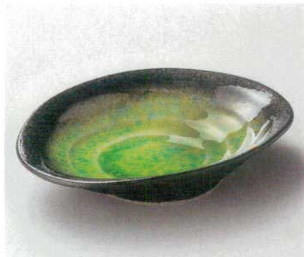
03817-269 有明楕円平鉢 1,200円 40入(20×14.6×3.5cm)