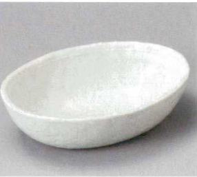
03812-589 オフケ白ライン5.5楕円鉢 1,500円 60入(17×12.8×4.7cm)