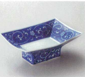
03804-149 染付濃唐草高台皿 4,500円 30入(20.5×15×7.5cm)