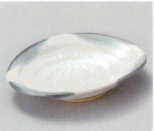
03818-269 青霞楕円平鉢 1,200円 40入(20×14.6×3.5cm)