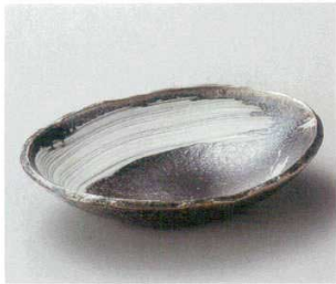
03801-669 刷毛目7.0楕円皿(中)(信楽焼) 5,250円 50入(20.5×15×4cm)