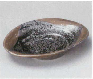
03814-269 金結晶楕円平鉢 1,400円 50入(20×14.6×3.5cm)