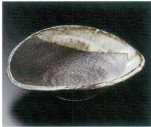
03809-319 柳ヶ瀬扇大鉢 2,000円 36入(20.3×18.3×5.7cm)