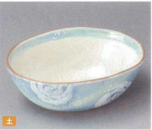
03806-519 ホワイトローズブルーオーバルボール 2,500円 40入(17×13×5.8cm)