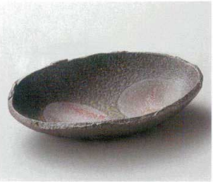
03802-669 炭化6.5楕円皿(信楽焼) 5,000円 50入(20×15×3.5cm)