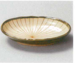
03811-579 織部内筋楕円6寸鉢 1,650円 40入(20.2×13.3×4.4cm)