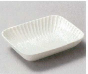
03819-239 白しのぎ長角深鉢 1,200円 80入(19.6×15.5×4.5cm)