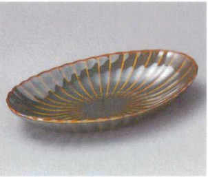
03810-029 かすみ山藍楕円皿 大 2,000円 60入(21.5×12.6×4cm)