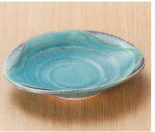
03815-269 トルコブルー楕円平鉢 1,300円 40入(20×14.6×3.5cm)