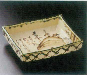
03803-179 乾山洲オリベ手描山水長角盛鉢 5,000円 20入(20×16×5.2cm)