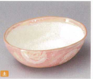
03807-519 ホワイトローズピンクオーバルボール 2,500円 40入(17×13×5.8cm)