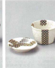
38811-319 白銀彩千代口(小) 730円 150入 (8.4×5.8cm・170cc)