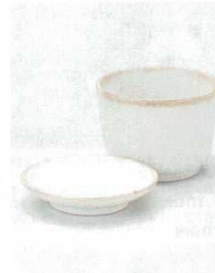
38806-149 黄マット刷毛薬味皿 680円 100入 (9.8×1.7cm)