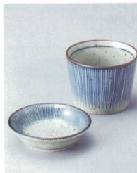
38825-559 ダミラインそば猪口 750円 80入 (8.2×6cm・170cc)