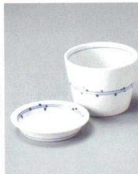
38815-459 伊賀織部そば千代口 600円 120入 (8.5×6.5cm・190cc)