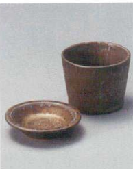
38802-319 うるしプラウン薬味皿 900円 300入 (8×1.8cm)