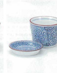
38823-439 山水そば千代久 650円 (8.2×6.2cm)