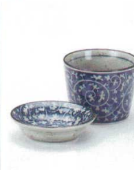
38827-259 うみぶどうそば千代口 600円 100入 (8×6cm・180cc)