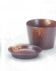
38829-199 千段十草そば千代口 700円 120入 (8×6cm・170cc)