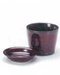
38801-319 うるしプラウンそば千代久 1,150円 150入 (7.7×6.2cm・170cc)