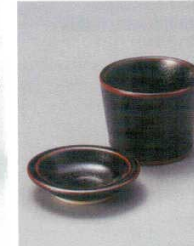
38831-439 十草ソバ千代久 650円 100入 (180cc)