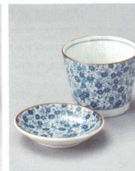
38818-459 錆びボカシ丸薬味皿 520円 200入 (9.4×1.8cm)