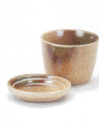
38804-559 富士薬味皿 690円 150入 (9×1.5cm)