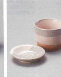
38833-179 唐草そば千代口 540円 100入 (8.3×6.3cm・200cc)