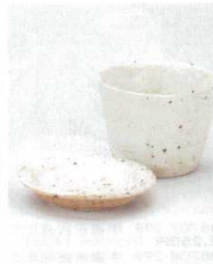
38805-149 黄マット刷毛ソバ千代口 1,060円 60入 (8.7×7.7cm・200cc)