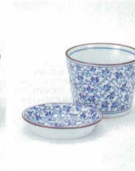
38821-439 たご唐草そば千代久 650円 (8.2×6.2cm)