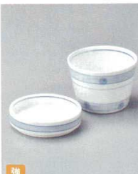
38813-269 金結晶そば千代口 700円 80入 (8×6.5cm・170cc)