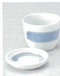
38816-459 伊賀織部薬味皿 500円 200入 (9×1.8cm)