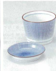
38817-459 錆びボカシそば千代口 680円 120入 (9×6.3cm・190cc)