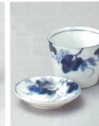
38822-439 たご唐草薬味皿 400円 (8.9×2.4cm)