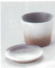
38803-559 富士そば猪口 1,050円 60入 (8.5×7cm・160cc)