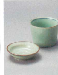
38808-179 藍花薬味皿 650円 (8.8×1.3cm)