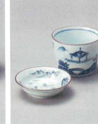
38812-319 白銀彩薬味皿 590円 270入 (9×9×1.8cm)