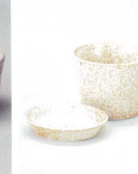
38835-179 みじんタコ唐草そば千代口 540円 100入 (8.3×6.3cm・200cc)