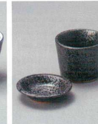
38824-439 山水薬味皿 400円 (8.9×2.4cm)