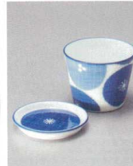
38807-179 藍花そば猪口 750円 (8.5×7cm・230cc)