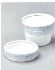
38814-269 金結晶薬味皿 450円 150入 (8.5×1.7cm)