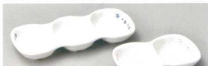
39030-589 小町ブルー三品盛 1,230円 100入 (20.5×9.2×2.5cm) 39031-589 小町ピンク二品盛 1,020円 120入 (13.8×9.2×2.5cm)