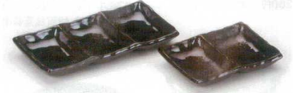
39012-589 備前灰釉三品盛 1,520円 80入 (19.5×9.5×2.5cm) 39013-589 備前灰釉二品盛 1,110円 120入 (13.5×9.5×2.5cm)