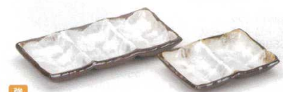
39014-579 備前志野三品盛 1,350円 80入 (19.2×9.1×2.5cm) 39015-579 備前志野二品盛 980円 80入 (13.2×9.4×2.5cm)