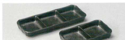
39026-459 瀬戸黒三品皿 1,280円 80入 (18.5×7.4×2.2cm) 39027-459 瀬戸黒二品皿 940円 100入 (13×7.4×2.2cm)