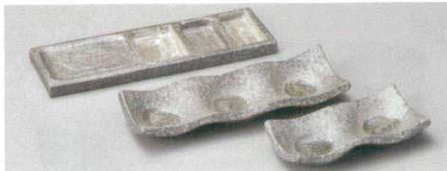
39001-669 黒窯変8.5仕切皿(信楽焼) 6,600円 30入 (25.7×7.8×1.8cm) 39002-669 黒窯変三品薬味皿(信楽焼) 4,050円 60入 (23×8.2×3cm) 39003-669 黒窯変二品薬味皿(信楽焼) 2,530円 90入 (15.2×7.6×3cm)