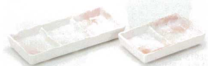
39024-039 桜志野三品皿 1,170円 60入 (19×8.2×2.6cm) 39025-039 桜志野二品皿 720円 80入 (13×8.3×2.7cm)