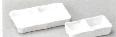
39034-439 白磁二品皿(大) 1,100円 80入 (15×9×2.2cm) 39035-439 白磁二品皿(小) 760円 100入 (11.3×6×2.9cm)