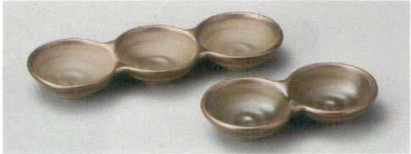
39006-589 銅彩丸三品皿 1,750円 100入 (23.8×8.1×2.8cm) 39007-589 銅彩丸二品皿 1,430円 120入 (15.7×8.1×2.8cm)