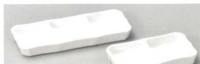
39028-439 白磁三品皿(中) 1,280円 200入 (18.6×7.4×2.2cm) 39029-439 白磁二品皿(中) 920円 200入 (12.9×7.3×2.2cm)