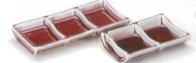
39010-269 辰砂三つ仕切皿 1,500円 40入 (20×8.7×3cm) 39011-269 辰砂二つ仕切皿 1,250円 60入 (13.5×8.8×3cm)