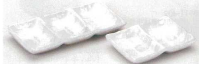
39016-549 乳白志野三品盛 1,380円 60入 (19.2×9×2.3cm) 39017-549 乳白志野二品盛 1,100円 80入 (13×9×2.3cm)