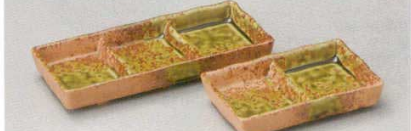
39018-039 織部吹三つ切皿 1,230円 60入 (19×8.5×2.7cm) 39019-039 織部吹二つ切皿 750円 80入 (13×8.5×2.7cm)