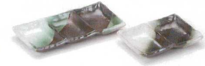
39008-589 青海三品盛 1,550円 60入 (19.5×9.2×2.3cm) 39009-589 青海二品盛 1,240円 80入 (13×9.3×2.3cm)