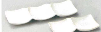
39036-319 白釉角切三品皿 980円 70入 (26×8.8×2.5cm) ※608050 39037-319 白釉角切二品皿 660円 90入 (17×8.5×2.5cm) ※608052