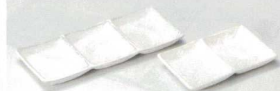
39040-319 白釉石目三品皿 980円 60入 (24.2×9.8×2.3cm) 39041-319 白釉石目二品皿 660円 100入 (15.7×9.4×2.3cm)