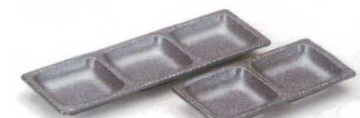
39020-139 黒いぶし三品皿 1,450円 48入 (27.3×9.1×2.5cm) 39021-139 黒いぶし二品皿 880円 80入 (18.6×9.2×2.5cm)