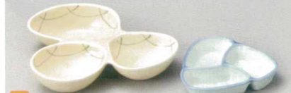
39042-559 一珍カゴ三品盛 2,740円 40入 (19.5×17.8×3.8cm) 39043-559 青磁淵呉須三角三品盛 1,060円 60入 (11.9×11.9×2.3cm)