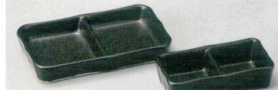
39032-439 瀬戸黒二品皿(大) 1,100円 80入 (15×9×2.2cm) 39033-439 瀬戸黒二品皿(小) 760円 100入 (11.3×6×2.9cm)