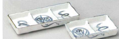
39038-039 手描花三品皿 1,150円 60入 (19×8.5×2.7cm) 39039-039 手描花二品皿 820円 80入 (13×8.5×2.7cm)