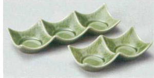
39207-559 ねり抹茶石目型3連皿(小) 1,540円 80入 (20.3×6.7×3.2cm) 39208-559 ねり抹茶石目型2連皿(小) 1,200円 100入 (13.6×6.7×3.2cm)