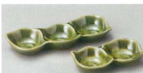
39245-579 織部木の葉三品盛 660円 129入 (17.5×6.5×2.5cm) 39246-579 織部木の葉二品盛 490円 200入 (11.8×6.5×2.5cm)