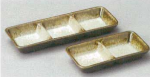
39213-579 織部かすみ三品盛(大) 1,350円 60入 (21.8×8×2.6cm) 39214-579 織部かすみ二品盛(大) 1,100円 90入 (15×7.8×2.5cm)