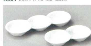
39255-469 白だんご3連珍味 700円 150入 (18×6.2×2cm) 39256-469 白だんご2連珍味 550円 200入 (12.2×6.2×2cm)