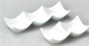
39205-439 白磁石目型3連皿(小) 1,430円 80入 (20.3×6.7×3.3cm) 39206-439 白磁石目型2連皿(小) 1,100円 100入 (13.6×6.7×3.2cm)