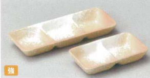
39221-589 雪どけ三品盛 1,390円 80入 (17.6×6.7×2.1cm) 39222-589 雪どけ二品盛 1,140円 120入 (11.7×6.5×2.2cm)