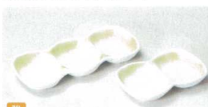
39243-559 ヒワ吹き三品盛 1,100円 80入 (20.5×9.2×2.5cm) 39244-559 ヒワ吹き二品盛 880円 150入 (13.8×9.2×2.5cm)