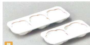
39233-559 赤ライン梅型三品盛 1,380円 120入 (17×6.3×2cm) 39234-559 赤ライン梅型二品盛 1,020円 150入 (13×6.4×1.6cm)