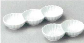
39229-439 青磁菊型三品皿 1,050円 60入 (19×6.9×2.6cm) 39230-439 青磁菊型二品皿 880円 100入 (12.9×7×2.6cm)