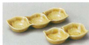
39247-579 黄瀬戸木の葉三品盛 660円 129入 (17.5×6.5×2.5cm) 39248-579 黄瀬戸木の葉二品盛 490円 200入 (11.8×6.5×2.5cm)