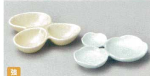
39231-559 一珍カコメ三品珍味 980円 60入 (12×11×2.2cm) 39232-559 青磁梅型三品盛 870円 60入 (12×9cm)