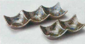
39203-439 いろり石目型3連皿(小) 1,590円 100入 (20.1×6.6×3.3cm) 39204-439 いろり石目型2連皿(小) 1,300円 120入 (13.1×6.4×2.8cm)