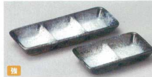
39217-559 雲海三品盛 1,390円 60入 (17.6×6.7×2.2cm) 39218-559 雲海二品盛 1,130円 80入 (11.7×6.5×2.2cm)