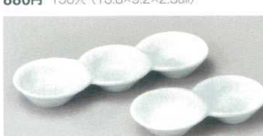
39251-469 青白だんご3連珍味 700円 150入 (18×6.2×2cm) 39252-469 青白だんご2連珍味 550円 200入 (12.2×6.2×2cm)