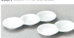
39253-469 白だんご3連皿 1,500円 60入 (26.2×9.5×2.6cm) 39254-469 白だんご2連皿 1,100円 100入 (17.8×9.5×2.6cm)