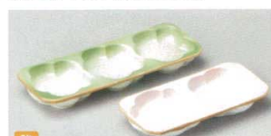
39241-549 緑翠梅型三品盛 1,380円 100入 (17×6.3×2cm) 39242-549 ピンク吹二品盛 1,250円 120入 (13×6.3×2cm)