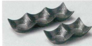
39209-439 瀬戸黒石目型豆3連皿 920円 200入 (15.1×5×2.5cm) 39210-439 瀬戸黒石目型豆2連皿 690円 200入 (10.1×5×2.5cm)