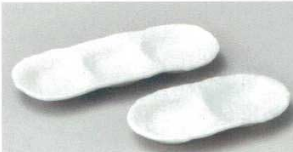
39227-459 さざ波三品皿 1,000円 60入 (18×7.5×1.7cm) 39228-459 さざ波二品皿 760円 80入 (13.5×7×1.7cm)