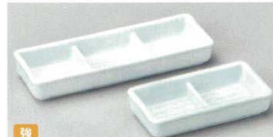
39239-579 青磁三品盛 850円 80入 (18.2×6.3×2.7cm) 39240-579 青磁二品盛 600円 120入 (12×6.3×2.7cm)