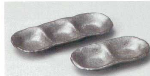
39225-459 銀天目三品皿 1,000円 60入 (18×7.5×1.7cm) 39226-459 銀天目二品皿 760円 80入 (13.5×7×1.7cm)