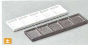
39201-459 雪志野五品珍味皿 2,700円 100入 (22.5×6×1.2cm) 39202-459 いぶし黒五品珍味皿 2,700円 100入 (22.5×6×1.2cm)