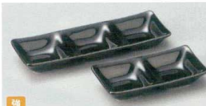
39237-579 黒三品盛 880円 100入 (20.2×6.8×2.7cm) 39238-579 黒二品盛 650円 142入 (13.5×6.8×2.7cm)