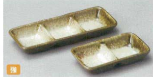
39215-579 織部かすみ三品盛(小) 1,100円 80入 (17.5×6.7×2.2cm) 39216-579 織部かすみ二品盛(小) 880円 120入 (11.7×6.5×2.2cm)