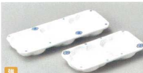
39235-549 花暦三品盛 1,380円 100入 (17×6.3×2cm) 39236-549 花暦二品盛 1,250円 120入 (13×6.3×2cm)