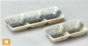
39219-559 緑川三つ仕切(小) 1,280円 80入 (17.5×6.2×2.2cm) 39220-559 緑川二つ仕切(小) 1,050円 100入 (11.9×6.2×2.2cm)