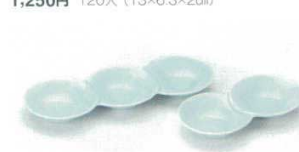
39249-469 青磁だんご3連皿 1,500円 60入 (26.2×9.5×2.6cm) 39250-469 青磁だんご2連皿 1,100円 100入 (17.8×9.5×2.6cm)