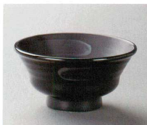
39911-139 銀刷毛5.0腰張丼 1,450円 48入 (14.9×8cm)