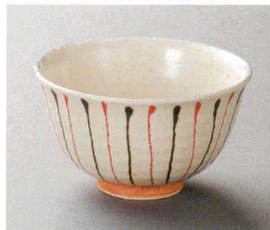
39907-449 一珍十草5.0反多用丼 3,030円 30入 (15×8.8cm)