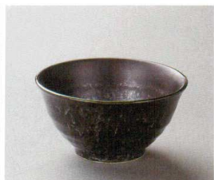
39923-029 黒真珠手引4.8反和丼 550円 40入 (14.5×6.5cm)