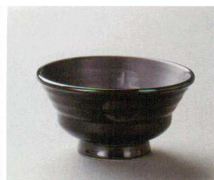
39912-139 銀刷毛4.5腰張丼 1,350円 60入 (13.5×7.2cm)