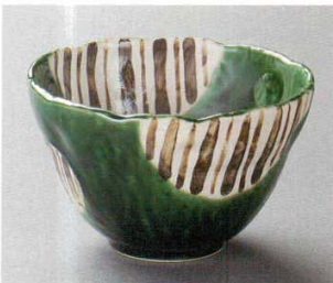
39913-109 織部十草6寸丼 2,400円 24入 (17.5×11cm・1,200cc) 39914-109 織部十草5寸丼 1,800円 30入 (15.5×10cm・900cc)