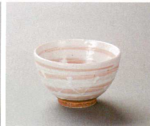
39904-449 一珍萩色うず飯器 1,980円 45入 (11.8×7.5cm)