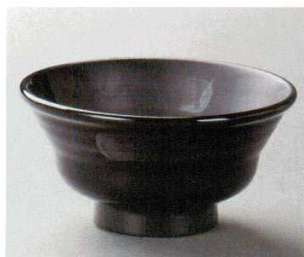
39910-139 銀刷毛5.5腰張丼 1,760円 36入 (16.3×8.6cm)