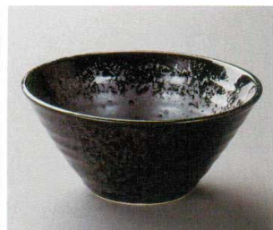
39919-029 黒真珠水輪6.5種鉢 1,200円 40入 (19.7×9cm)