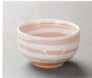
39903-449 一珍萩色うず京碗 2,780円 36入 (13.8×8cm)