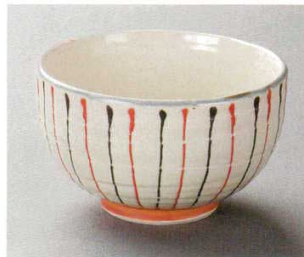
39906-449 一珍十草5.0夏目丼 3,480円 30入 (15.8×9.5cm)