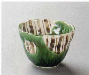
39915-109 織部十草4寸丼 1,200円 50入 (13×9cm・550cc) 39916-109 織部十草3.6寸丼 950円 60入 (11.3×8cm・320cc)