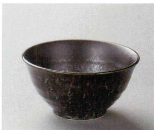
39921-029 黒真珠手引5.0反和丼 820円 60入 (15.8×7.8cm)