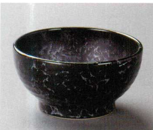
39920-029 黒真珠5.5釜上丼 1,300円 24入 (17×9cm)