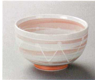
39902-449 一珍萩色うず5.0丼 3,350円 30入 (15.5×9.5cm)