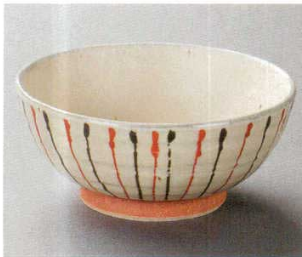
39905-449 一珍十草6.0丼 3,480円 24入 (17.5×8cm)