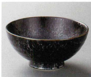
39917-029 黒真珠6.5種丼 1,180円 40入 (19.5×9.5cm) 39918-029 黒真珠5.8種丼 1,050円 40入 (18×9.5cm)