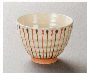
39908-449 一珍十草4.5深口丼 2,900円 45入 (12.3×9cm)