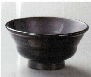
39909-139 銀刷毛6.0腰張丼 2,250円 30入 (18.4×9.4cm)