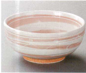
39901-449 一珍萩色うず6.0深ボール 4,980円 20入 (19×9cm)