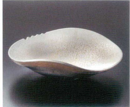
00405-669 金彩たわみ14.0鉢(信楽焼) 31,600円 6人(42.5×36.5×12cm) 00406-669 金彩たわみ鉢(信楽焼) 12,000円 10人(36×27.5×11cm)