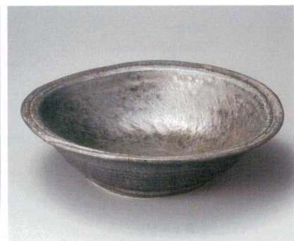
00422-149 金結晶くし目たわみ鉢 12,800円 8人(36×34×9cm)