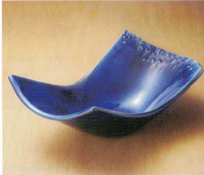
00404-669 青ガラス15.3角ソリ鉢(信楽焼) 16,500円 6人(47×28×17cm)