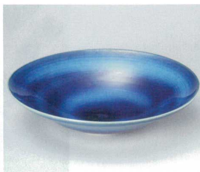
00421-669 マリンブルー12.0丸鉢 13,200円 (37×9.5cm)