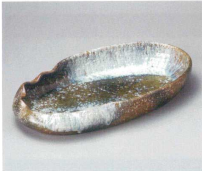
00401-669 焼びードロ16.0小判鉢(信楽焼) 13,000円 5人(48×30×6.5cm) 00402-669 焼びードロ13.0小判鉢(信楽焼) 8,000円 10人(39×23.5×6cm) 00403-669 焼びードロ10.0小判鉢(信楽焼) 6,000円 12人(30×18×5cm)