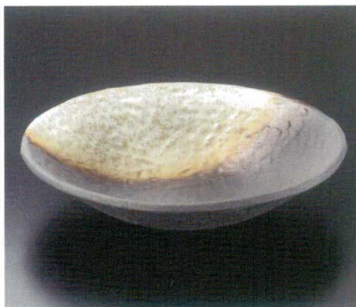
00409-669 コゲ窯変13.3大鉢(信楽焼) 14,500円 6人(40×10cm) 00410-669 コゲ窯変11.5大鉢(信楽焼) 7,200円 8人(35×8.5cm)