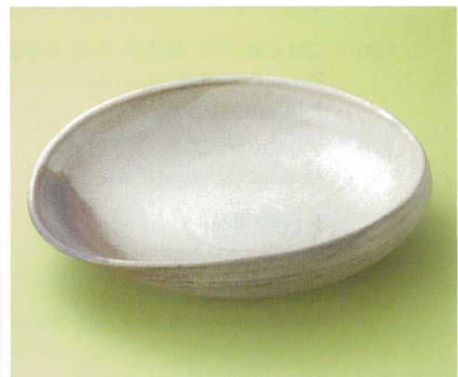
00411-669 灰釉粉引13.0変型鉢(信楽焼) 15,000円 5人(40×37.5×10cm) 00412-669 灰釉粉引11.0変型大鉢(信楽焼) 10,500円 8人(33×31×8.5cm)