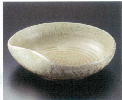
00417-669 古窯13.0大鉢(信楽焼) 15,000円 6人(38×36×10cm) 00418-669 古窯11.0大鉢(信楽焼) 10,000円 10人(32×30×8cm)