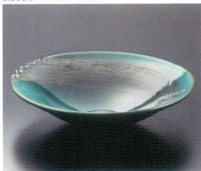
00407-669 緑釉13.7皿鉢(信楽焼) 31,600円 6人(41×10cm) 00408-669 緑釉11.0皿鉢(信楽焼) 11,800円 8人(35×7cm)