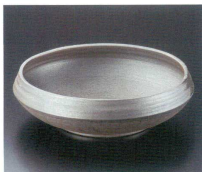
00419-669 炭化12.0ひねり大鉢(信楽焼) 18,000円 6人(37×10.5cm) 00420-669 炭化10.0ひねり大鉢(信楽焼) 13,500円 10人(31×8cm)