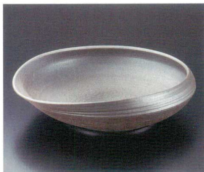
00413-669 黒窯変13.0変型大鉢(信楽焼) 15,000円 6人(40×37.5×10cm) 00414-669 黒窯変11.0変型大鉢(信楽焼) 10,000円 10人(33×30×8.5cm)