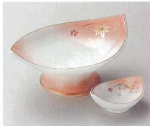
04011-179 オレンジ吹高台刺身 4,400円 30人 (20.8×13.8×8.2cm) 04012-179 オレンジ吹高台千代久 1,550円 150人 (9×6.9×3.3cm)