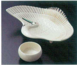
04003-439 高らいツル向付 4,800円 40人 (20.8×13.8×5.3cm) 04004-439 高らい丸のぞき 580円 300人 (5.6×3.2cm)