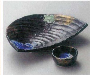
04023-179 黒釉三色吹半月向付 3,900円 40人 (22×15.5×5cm) 04024-179 黒釉三色吹千代久 1,350円 150人 (6.7×3cm)