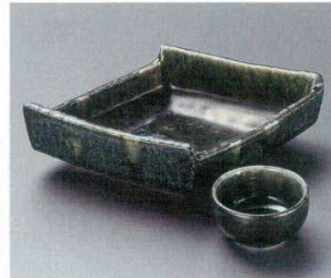
04031-149 紺織部菱型鉢 3,050円 40人 (20.5×15×4.5cm) 04032-149 紺織部丸千代口 1,100円 200人 (6.4×3.3cm)