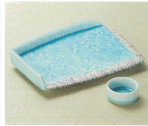
04007-149 湖水屏風型変形皿 4,500円 20人 (27×18.3×4.3cm) 04008-149 湖水青白丸千代口 1,200円 150人 (6.7×3cm)