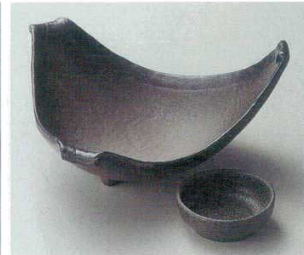
04033-179 炭化土布目三ツ山刺身 3,200円 30人 (21×17.3×9.5cm) 04034-179 炭化土丸千代口 1,000円 200人 (7×2.6cm)