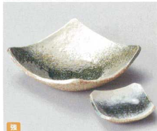
04035-559 緑川ひし形7.0鉢 2,750円 40人 (21.3×19.8×5.4cm) 04036-559 緑川正角3.0皿 750円 150人 (8.6×8.6×2.4cm)