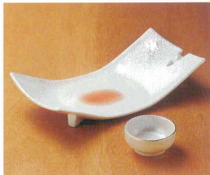
04017-149 オレンジ吹淵上長角皿 3,950円 40人 (26×13×5.5cm) 04018-149 淵金ラスター丸千代口 1,550円 150人 (7×3.5cm)