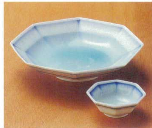
04013-149 藍流し八角皿 4,200円 40人 (20.3×19.5×4.7cm) 04014-149 藍流し八角千代口 1,750円 100人 (8.5×8×3.2cm)