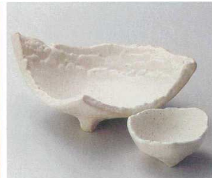
04039-029 桃山21cm三角鉢 2,000円 40人 (20.7×16×8cm) 04040-029 桃山8.5cm三ツ足小付 700円 150人 (8.5×8×4.3cm)