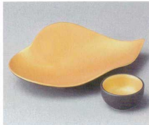
04019-469 鉄結晶(ゴールド)山型向付 4,100円 40人 (22×13.5×5.8cm) 04020-469 ゴールド千代口 1,600円 (6.3×3.3cm)