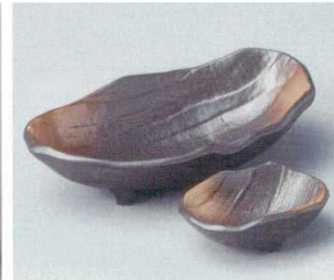
04041-239 布目流水備前吹刺身鉢 1,300円 60人 (21×12×6cm) 04042-239 布目流水備前吹タ円千代口 420円 120人 (10×7×3.5cm)