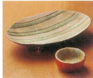
04021-149 金彩精円向付 3,850円 30人 (22×13.8×4cm) 04022-149 金彩丸千代久 1,280円 150人 (6.7×3cm)