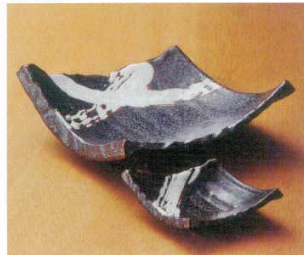
04037-199 黒釉白刷毛瓦皿(中) 2,400円 70人 (26×21×7cm) 04038-199 黒釉白刷毛瓦千代久 980円 180人 (14×11×4cm)