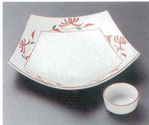
04025-149 朱呉須花繪五角皿(大) 3,200円 40人 (23.5×23.5×4.5cm) 04026-149 朱呉須花繪五角皿(小) 2,050円 60人 (16×16×3.5cm) 04027-149 朱巻丸千代口 750円 200人 (6.5×3cm)