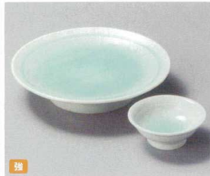
04028-149 青白磁高台6.0皿 4,300円 30人 (19×4.2cm) 04029-149 青白磁高台5.0皿 3,900円 50人 (16×3.9cm) 04030-149 青白磁丸千代口 1,700円 120人 (6.8×3.3cm)