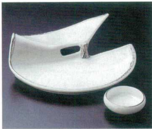
04001-149 淵プラチナ白二段前菜皿 4,800円 30人 (22×19.8×7cm) 04002-149 淵プラチナ白丸千代口 980円 300人 (6.5×2.3cm)