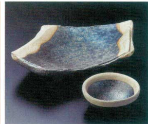
04015-669 黒窯変掛け分け変型足付皿(信楽焼) 4,000円 30人 (19.5×13×5cm) 04016-669 黒窯変掛け分け千代口(信楽焼) 760円 200人 (7.8×3cm)