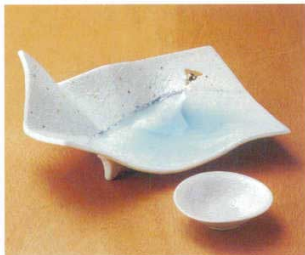
04009-149 折り紙ラスター皿 4,300円 30人 (23.5×17×8.5cm) 04010-149 ラスター反千代口 1,100円 150人 (8.5×2.3cm)